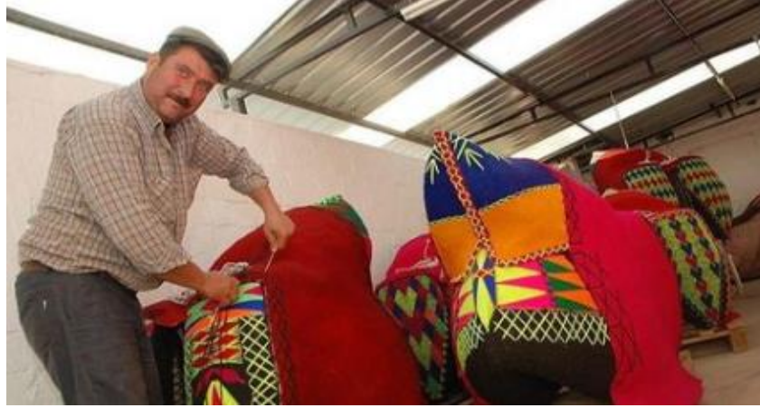
Görüntü 7: Havut rötuş işlemleri

Havut kullanımındaki en temel nokta, bu konforun deve tarafından hissedilmesidir. Bu bakımdan havut yapımında deveyi rahatsız etmeyecek unsurların havut ustası tarafından çok iyi bilinmesi gerekmektedir. Havut yapımında kullanılan sazların devenin hareketlerini kolaylaştırması gerekmektedir.