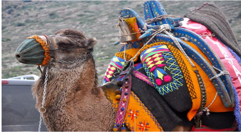
Görüntü 4: Zömbek ( https://egeyedonus.blogspot.com/2017/02/havut-deve-semeri_9.html )