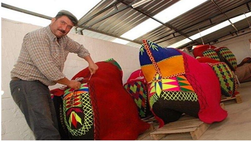
Görüntü 2: Havut bel bölümü