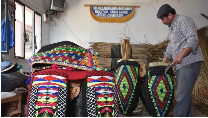
Görüntü 3: Havut tengah kısmı ön profil görünümü