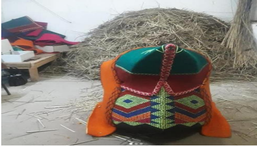
Görüntü 8: Renk kompozisyonlu havut

Havut işlemelerindeki renk ve desenler, deve sahiplerinin tercihine göre dizayn edilmektedir. Havutun yan kısımları son derece ince bir işçilik gerektirdiğinden bu kısımlar genellikle köy kadınları tarafından yapılmaktadır.