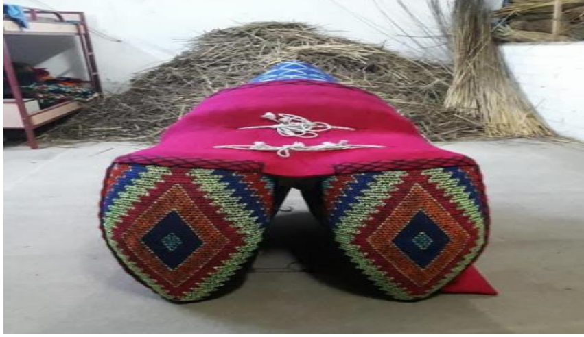
Görüntü 6: Yastık bağı üzerinde duran havut