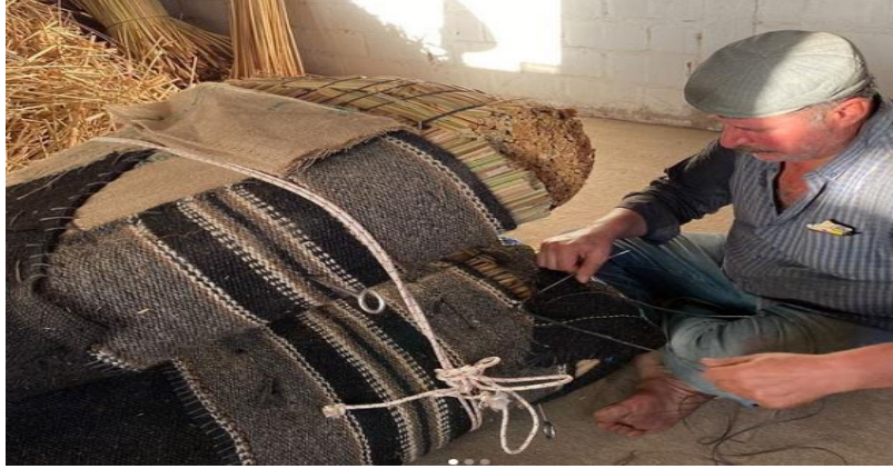
Görüntü 1: Havut yastık bölümü

Devenin üzerinde tek parça aksesuar olarak bulunan havut yapım aşamasında dört bölümden meydana gelmektedir. Havutun üst kısmında bulunan zömbek kısmı ay ve yıldız motifleri ile süslenmektedir. Bu bölüm havutun üst kısmında bulunan çıkıntıyı örtmek için kullanılmaktadır. Bunun dışında havutun ön bölümünde yer alan çatma kısmı “hatap” olarak adlandırılmaktadır. Hatapın önüne genellikle büyük bir çan asılmaktadır. Devenin edalı yürüyüşü sırasında sallanan çandan çıkan melodiler deve severleri etkilemektedir.