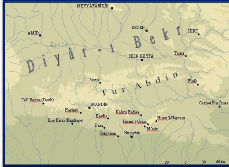
Harita 2: Moğol Hâkimiyeti Öncesi Diyâr-ı Bekr Bölgesi 7