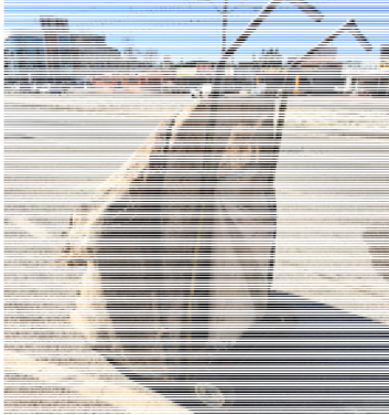
Çekçek hurda toplama aracı Fotoğraf 1: Güngör ÇABUK