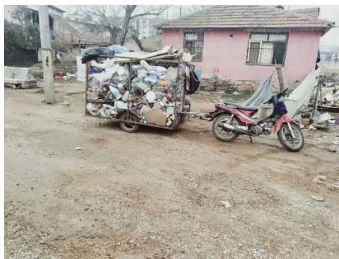
Motosikletli römorklu hurda toplama aracı Fotoğraf 2: Selma ÖNCEL

A3 ailesi altı kişiden oluşmakta ve aile üyelerinin büyük çoğunluğu seracılık, bahçe işleri, mobilyacılık gibi değişik işlerde çalışmış, öğretmen olan baba ise geldiği günden itibaren sadece katı atık toplamıştır. Yapmış oldukları işlerden elde ettikleri gelir yetersiz kalınca diğer aile üyelerinin katılıp katkı verebileceği katı atık toplama işini yapmaya başlamışlar. Konuyla ilgili tercümanın aktarımları şöyledir.