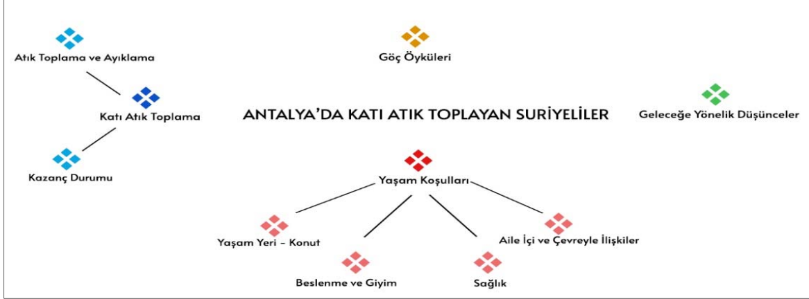
Şekil 1. Temalar

Şekil 1. Araştırma verilerinden elde edilen temalar Araştırmacı Elvan ATAMTÜRK tarafından QDA Miner Lite v2.0.9 kullanılarak oluşturulmuştur.