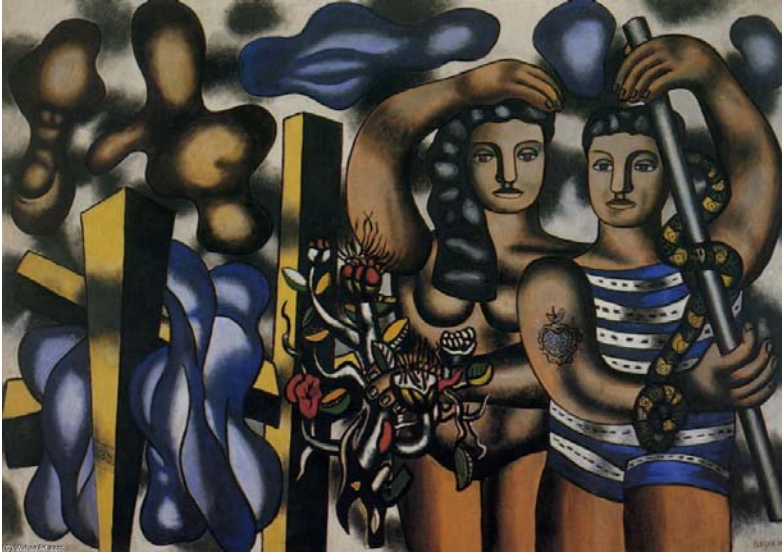
Resim 9: Fernand Leger, “Adem ve Havva”, 1939, Tuval üzerine yağlıboya.

Sanatçının eserlerinde, cennet bahçesi gibi gördüğü bu yer, seçkin ve harika renk kompozisyonlarını oluşturduğu mekân olmuştur. Gauguin, rengin salt temsiliyetine dayalı bağını koparmış, optik gerçeklikten öte sembolik anlayışı benimsemiştir. Batı uygarlığını terk edip egzotik yerleri resimlerine taşımış, doğalcılık ve sağduyuya önem veren, zengin anlatımlar yapan bir sanatçı olmuştur.