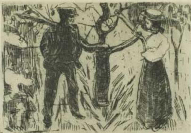
Resim 5: Eduard Munch, "Adem ve Havva", 1915, Gravür, 28 x 38 cm, Clarence Buckingham Koleksiyonu.

Resim 4'de Munch, çalışmanın sol tarafında ayakta ellerini önde kavuşturmuş şekilde Havva resmedilmiştir. Sağ tarafta Adem, sol kolunu göğsünün altına koymuş, sağ kolunu ise yukarıya ensesine koymuş şekilde çalışmıştır. Resmin ortasında siyahların içinde kıvılcım almış bir ağaç durmaktadır. Adem ve Havva'nın göz çukurları siyaha boyanmıştır. Resmin geneline siyah renk hâkimdir. Figürler ten rengine boyanmış, kontrast renkler kullanılmış ve vurgu figürlerin ifadelerine verilmiştir. Eserde hüznün ve melankoli sezilmektedir. Munch, "Doğa, sadece gözle görüneni değil aynı zamanda ruhun içsel pencerelerini de içerir" sözüyle sembolist ve ekspresyonist bir tavır sergilemiştir.