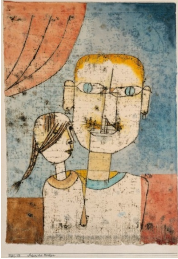
Resim 11: Paul Klee, “Adam ve Küçük Havva”, 1921, Kağıt üzerine suluboya ve transfer baskı boyası, 31.4x21.9cm, New York Metropolitan Müzesi, Berrgruen Koleksiyonu