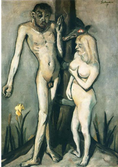
Resim 1: Max Beckmann, "Adem ve Havva", 1917, Tuval üzerine yağlıboya, 80-57 cm, Özel Koleksiyon.

Sanatın varoluşundan bu yana geçmişin ya da içerisinde bulunduğumuz dönemin sanat anlayışlarını ve sanatta meydana gelen değişimleri anlamının bir yolu da sanatçıların eserlerinin incelenerek çözümlenmesidir. Farklı biçimlerde ve anlayışlarda yorumlanan sanat eserleri aynı konuyu bile ele alsın bir değişim içerisinde olmuştur. Modern resim sanatçılarının Cennet Bahçelerindeki Adem ve Havva eserleri, bu değişimin üslup ve anlayışlarına göre hikayenin sunulmasında farklı bakış açıları ortaya koymaktadır.