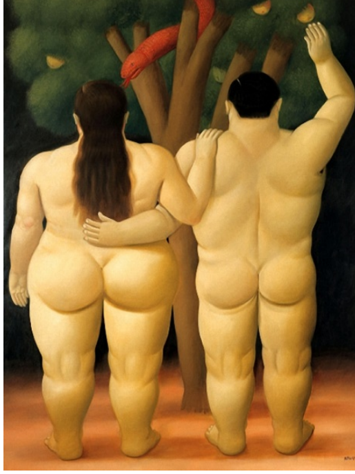
Resim 12: Fernando Botero, “Adem ve Havva”, Tuval üzerine yağlıboya.

1932, Medellín, Kolombiyalı ressam Botero, eğitimi İspanya'da San Fernando Güzel Sanatlar Kraliyet Akademisi'nde almıştır. Sanatçı, genellikle şişman insanları çizmekte ve standart günümüz güzellik anlayışını da değiştirmiştir. Botero, sergi için yapılan basın toplantısında yaklaşımını şöyle açıklamaktadır: “Herkes benim şişman insanları sevdiğimi düşünüyor, ama benim derdim hacim. Bu XX. Yüzyılda unutulmuş bir şey. Hacim, yaşamı yüceltmek ve yükseltmektir.” (Llosa, M.V. 2000; 20) demiştir. Eserlerinde, neşeli, sevecen, masum insan tiplerini görmektedir. Sanatçı, “karakterlerimi onlara tensellik vermek için şişman yaptığımı” (Llosa, M.V. 2000; 21) belirtmiştir. Sanatçı gözüyle şişmanlık, bir bakış açısı ve bir yöntem olduğudur. Kadın figürlerinde, uysallık, anaçlık ön plandadır, cinsellik geri plana atılmıştır. Sanatçı, yetiştiği Latin Amerika'ya özgü temaları ve anlayışı öne çıkarmıştır.