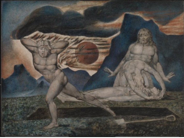
Resim 10: William Blake, ' Adem ile Havva, Habil'in Cesedini Buluyor ', 1826,

Ağaç üzerine fresk, mürrekkep ve altın, 32.5 x 43.3 cm, Tate Müzesi.