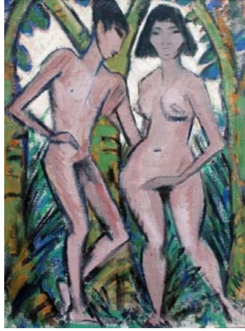
Resim 3: Otto Müeller, “Adem ve Havva”,1918, Tuval üzerine yağlıboya, Städelsche Kunstinstitut und Städtische Galerie – Frankfurt, Almanya

Cennet Bahçesinde Adem ve Havva'yı yorumlayan diğer bir sanatçı ise Alman ressam ve baskı sanatçısı Müeller'dir. 1874 yılında Liebau'da doğan sanatçı, Die Brücke ekspresyonist akımında yer almıştır. I. Dünya Savaşı yıllarında savaşa katılan ve ardından Breslau'daki Sanat Akademisi'nde uzun yıllar çalışmıştır. Lirik Alma Ekspresyonistlerden olan Müeller, insanla doğa birlikteliği ve çingeneler gibi konular üzerinde eserler vermiştir. Çalışmalarında, zıt ve katışksız renkler kullanmış, nesnelerin renklerinde değişikliğe gitmiyordu. Resim sanatı hakkında “Girişimimin başlıca amacı doğa görünümüne ve insanlara olan duygularımı olabildiğince yalına indirgeyerek dışavurmaktır” (Lional 1991; 88) demiştir. Sanat anlayışında Müeller, insan ve doğayı uyumlu bir şekilde betimlemiştir.