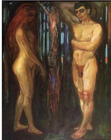
Resim 4: Eduard Munch, “Adem ve Havva”, 1918, Tuval üzerine yağlıboya, Munch Müzesi.

Resim 3'deki “Adem ve Havva” isimli resminde sol tarafta ayakta Havva'ya bakan Adem'i, resmin sağ tarafında ise seyirciye yüzü dönük Havva resmedilmiştir. Resmin arka mekânında ağaçlar görülmektedir. Arka zeminde canlı yeşillerle turkuazlar kullanılmış öndeki figürlerde ise ten rengi baskı yerleri ışıklandırma yapılarak verilmiştir.