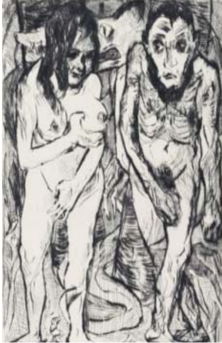
Resim 2: Max Beckmann, "Adem ve Havva", 1917, Kuru kazıma, 23.7 x 17.6 cm, Publisher J. B. Neumann, Berlin, Credit :Larry Aldrich Fund

Sanatçı Resim 1'deki "Adem ve Havva" isimli resimde ilk yaradılışın ve ilk günahın resmini çağdaş bir yorumla sunmuştur. Resimde, sol tarafta ayakta Adem'i ve onun yanında sol elini göğsüne koymuş Havva'yı ve ortalarında kalın bir ağaca dolanmış Adem'e bakan ürkütücü büyük başlı yılan betimlenmiştir. Çalışmanın arka planında sol tarafta koyu zemin üzerinde sarı açmış bir çiçek görülmektedir. Adem sağ kolunu aşağıya doğru açmış Havva'ya bakmaktadır. Resimdeki bedenler abartılı şekilde çarpıtılmış kollar, bacaklar, vücut ve yüz deformasyona uğramıştır. Beckmann, çalışmada yeşil ve tonlarını kullanmış ve vurguyu Adem ve Havva'nın yanında olan Kırmızı gözlü yılanla vermiştir. Ürpertili ve melankolik bir hava sezilmektedir.