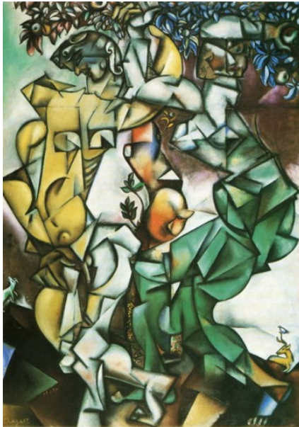
Resim 7: Marc Chagall, “Adem ve Havva”, 1912, 109 x 160.5 cm, Saint Louis Art Museum, St. Louis, Amerika Birleşik Devletleri.

Munch'ın Resim 6'daki çalışmasında son derece modern giysiler içinde günümüz Adem ve Havva'sını resmettiğini görmekteyiz. Çalışmanın sol tarafında şapkalı, üzerinde beyaz bluz ve kırmızı uzun etek giymiş Havva bir eliyle ortada duran ağaca elini koymuş, diğer eliyle de elma yemektedir. Havva'nın karşısında şapkalı, eli cebinde ağaca elini koymuş takım elbiseli Adem, Havva'ya bakmaktadır. Mekan olarak geniş bir bahçe düşünülmüş ve nesnelere fırça tuşlarıyla renkler net olarak boyanmıştır. Çalışmanın geneline soğuk renkler hâkimdir. Eserde bir ilkbahar havası sezilmekte ve mutlu, sakin bir gün geçirdikleri düşündürülen Adem ve Havva yer almaktadır.