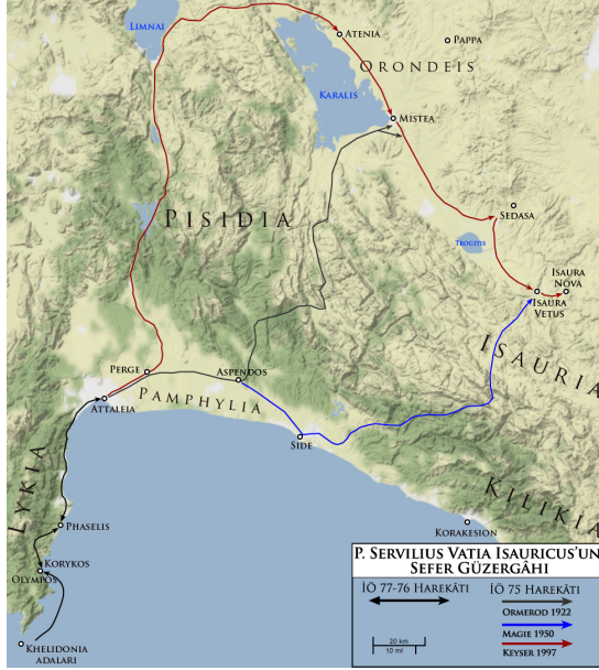
Fig. 2. P. Servilius Vatia Isauricus'un Korsan Seferi (Open Street Map üzerinden düzenlenmiştir)