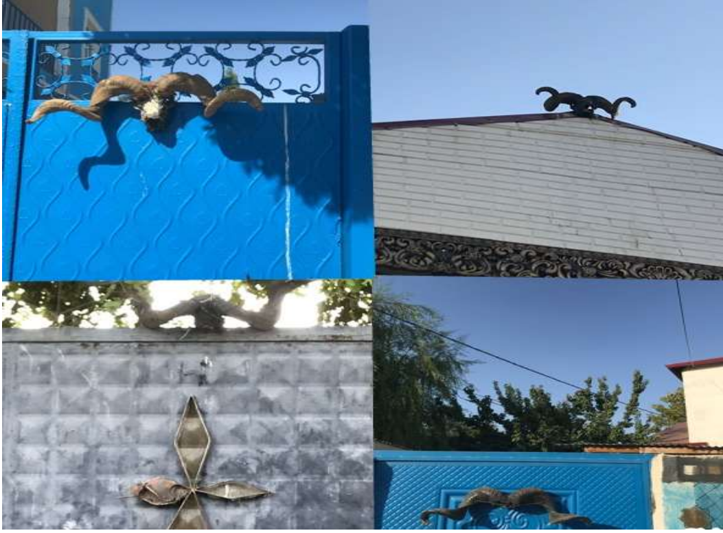
Görsel 5. Yörede kapı ve duvarlara asılan koç boynuzları

Ayrıca kaynak kişilere göre koç boynuzu bereketi, gücü ve üremeyi temsil etmektedir. Bu hayvan yörede temel geçim kaynağı olarak görüldüğünden her daim bolluğun ve bereketin karşılığı olarak kabul edilmektedir. Evin geçimine katkı sağladığı için kutsanarak sosyal yaşamın içerisine dâhil edilmiştir (KK. 8). Koç boynuzunun en önemli işlevi evi kazadan, beladan ve kötülüklerden korumasıdır. Çünkü koç boynuzu evi ve evdeki huzuru nazar etmek isteyenlerin kötü bakışlarını bertaraf etmektedir (KK.3). Yörede yeni bir ev veya yapı inşa edildiğinde ilk olarak kapısına nazara karşı koç boynuzu asılmaktadır. Evlerin ya da işyerlerinin kapısında asılı duran koç boynuzu bir bakıma kötülüklerle karşı kalkan görevi görmektedir (KK.4).