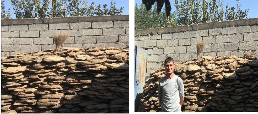
Görsel 4. Kalak ve Süpürge

Atalardan öğrenilip yerine getirilmeye devam eden uygulamalardan biri de kalaktır. Kalak denilen uygulama, büyük bař hayvanların dışkılarından yapılan ve daha çok yakılacak malzeme olarak kullanılan tezeklerden oluřmaktadır. Toplanan tezekerler “kerme” řeklinde üst üste konulmakta ve bir yıđın meydana getirilmektedir. Ortaya çıkan bu yıđının üzerine evler temizlenirken kullanılan süpürge dikilmektedir. Kıř aylarına kadar süpürge kalađın üzerinde bırakılmaktadır. Bu iřlemin amacı nazardan ve olası kötülüklerden kaçınmaktır. Kem göz kalađa baktıđında, kötü enerji oraya yönelmekte ve böylece asıl olanın korunduđu düşünölmektedir. Bundan ötürü de evin dirliđi ve birliđinin sađlandıđına inanılmaktadır (KK. 6).