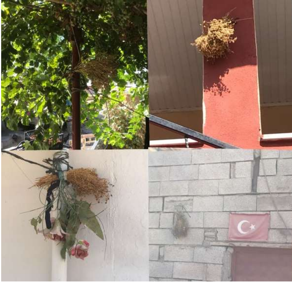
Görsel 3. Yöredeki evlerin duvarlarına, bahçe direklerine ve işyerlerine asılan üzerlik demeti

Varlık alanının sınırlarını nazarı engellediğine inandığı nesnelere korumaya alan birey, böylece yaşadığı mekânda birlik ve beraberliği sağladığını göstermektedir. Daha önceden belirtildiği gibi nazarı değdiği inanan kişilerin en büyük özelliği kendinde olmayan bir özelliği kiskanması ve bunun sonucunda bakışlarına olumsuzluklar yüklemesidir. Evi ile ontolojik bir ilişki kuran kişiler, geliştirdikleri böylesi pratiklerle nazara gelebileceğini düşündüğü huzurunu güvence altına almayı amaçlamaktadır.