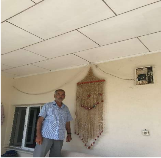
Görsel 1. İplere dizilip kapının yanına asılan üzerlik

2007a: 204). Bu bağlamda Güney Sibirya Türklerinin geleneksel dünya anlayıřında “tös” (özel nesne) sembollerinin evin iç düzenindeki rolü oldukça önemlidir. Zira ongon türündeki bu kült nesnelere yerleřtirildikleri yer ister evin içi, isterse dışı olsun koruyucu iyelerin yansıması veya onlarla aynı amacı taşıması için kullanılmaktadır. Bu nesnelere, mekânın korunmasını güvenceye almakta ve insanın yaşadığı yerin sınırlarını güçlendirmektedir. Hatta bu anlayıřta evin sınırları; “benimsenen” mekânın koruma altında olduđunun ve insan topluluđunun birlik ve beraberlik içerisinde yaşamını sürdürdüđünün bir göstergesidir (Lvova vd. 2013: 82). İğdir ve yöresinde üzerliđin konumlandırıldığı yerler genellikle evlerin eřikleridir. Dıř dünyadan gelen “yabancı”yı karřılayan üzerlik, bir bakıma olumsuzluk veya kötülük durumlarında kalkan olma işlevini üstlenmektedir. Çünkü eve gelen kişilerin bakıřlarına maruz kalan ilk nesne duvardaki üzerlik olmaktadır. Yöre insanına göre dışardan haneye gelen kişilerde var olduđu düşünölen kötü enerjinin üzerlik yoluyla boşaltıldığı düşünölmektedir (KK. 9). Böylece olađan tehditlerin önüne geçilerek yuvanın dinginliđi korunmaya çalışılmaktadır. Ayrıca yaşam alanlarına asılan her bir nesne, mekâna yüklenen özel anlamı göstermesi açısından da oldukça önemlidir.