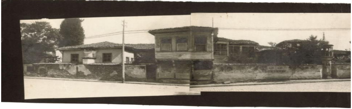
Ahmed Baba Efendi Tekkesi Fotođrafı (Neylâ ve Bekir Peynirciođlu Arşivi)