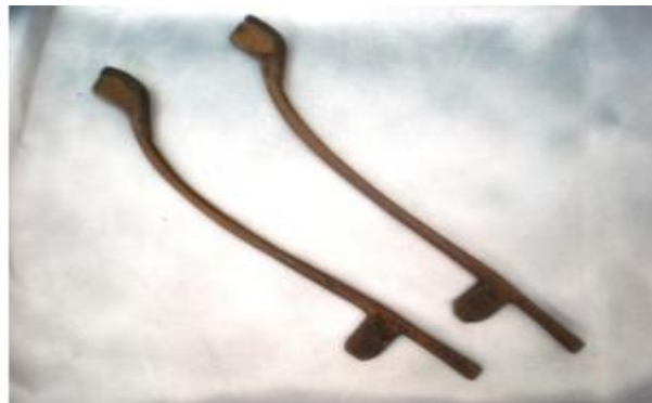
Şeyh Bahâüddîn Efendi'ye Ait Santur (Işık, 2011:152, 153, 180)