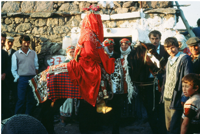
Fotoğraf 15: Çamkalabak'ta gelin atının üzerinde ekoseli (tokatlı) ihram (foto: 1990).

İhramlar çok önceden yerleşik yaşama geçmiş köylerde dokunur. Ayvacık bölgesinde Yörükler halı kilim ve benzeri dokumaları, eski yerleşikler de iç ve dış giyim için gerekli dokumaları ve battaniye gibi örtüleri dokurlardı. İhtiyaçlarını kendi aralarında takas ederek karşılardı. İhramlar da arkalıklar gibi evli kadının giyiminde önemli bir yere sahiptir. Fotoğraf 16'da gelinin atının üzerinde, gelin atı halısının üzerine ekoseli (tokatlı) ihram örtülmüştür. İhramlar Ayvacık geleneksel gelin giyiminde bele bağlanmaz. Gelin giyiminde arkalık olarak, uçları nakışlı kenarı oyalı beyaz büyükçe bir yağlık üçgen katlanarak bağlanır. Son yıllarda ihram dokuyanların sayısı çok azalmıştır. Genç kadınlar hiçbir şekilde ihram kullanmıyorlar. Halen bazı Yörük köylerinde kullanılsa da yerleşik köylerin birçoğunda kullanılmıyor. Sadece ihramları değil, dışarıya çıkarken giydikleri feraceler de giyilmiyor.