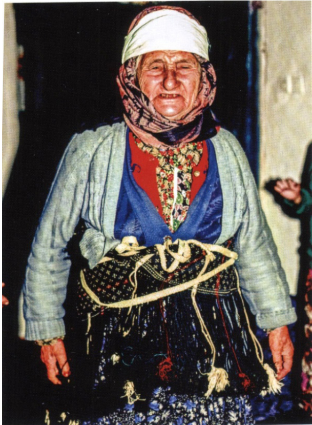
Fotoğraf 3: Günlük giyimde arkalık (şal kuşak), Orhaneli, Harmancık, 1994. (Steiner ve diğ. 2014: 196-197).