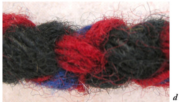
Fotoğraf 11a, b, c, d: Balıkesir- Balya Şalından ayrıntılar (Atlıhan arşivi, foto: 2013).