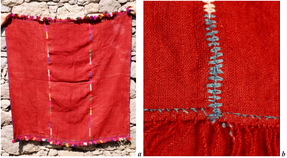
Fotoğraf 13 a, b: Çamkalabak'ta çocuk ihramı ve bir ihram dikişinden ayrıntı (Atlıhan arşivi, foto: 1999).