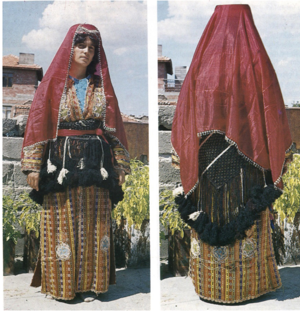
Fotoğraf 1: Gelin giyiminde arkalık [Res:5-6 Bursa Orhanlı İlçesi Harmancı Köyünde "Üçetek"li gelin kıyafetinin ön ve arkadan görünüşleri (Altuntaş ve diğerleri 1993: 4).

Koçu bu konuda; [Memleketimizde İstanbul da dâhil, çok yaygın bir gelenek olarak gelin kızların beline babaları, eğer yoksa erkek kardeşi veya en yakın erkek akrabası bir şal bağlardı. Şalın tabut örtüsü olarak kullanıldığını da hatırlatan aşağıdaki beyit gelinlik çağında ölen kız kardeşi için çağdaş şairlerimizden Tahir Olgun (Tahirülmevlevi) Beyindir. "Bekliyorken ben sana şal bağlama hengamını, Bağladım amma, zavallı kardeşim, tabutuna!."] der. 34