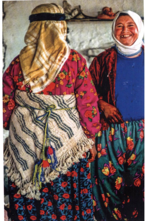
Fotoğraf 6: Arkalık, Karakocalı ve Karakeçili, Dikili -Ayvalık (Üçkabağaç), 1991 (Steiner 2014: 220-221).