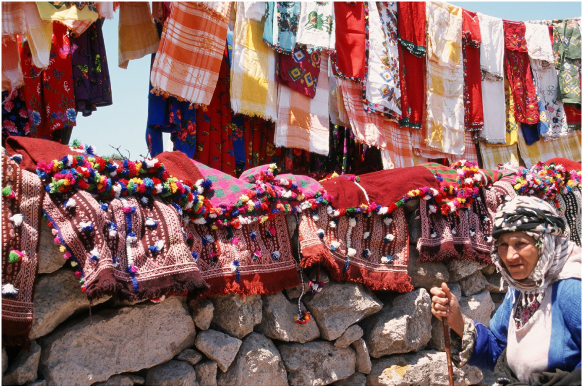
Fotoğraf 14: Çeyiz sergisinde duvarın üzerinde kenarları kozalı ihramlar (foto: 1999).