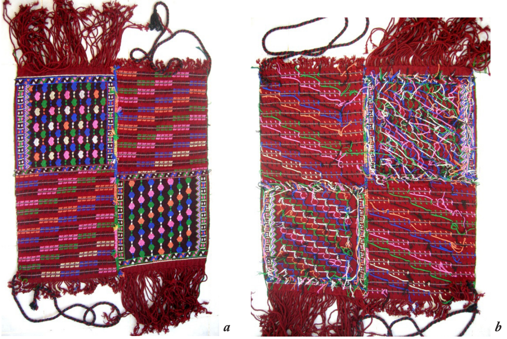
Fotoğraf 10a, b: Balya Şalınmın ön ve arka yüzü (Atlıhan arşivi, Foto: 2013)