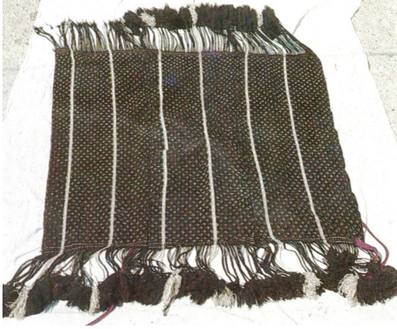
Fotoğraf 4: Arkalık, (Altuntaş ve diğerleri 1993: Res. 15, s. 9).