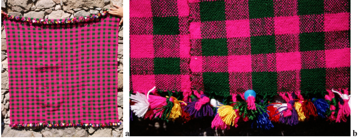
Fotoğraf 15a, b: Çanakkale- Ayvacık'ta tokatlı ihram ve kenar ayrıntısı (Atlıhan arşivi, foto: 2013).

İhramlar da arkalıklar gibi bez tezgâhlarında dokunurlar. Ayvacık bölgesinde çeyizlerde çok sayıda ihram yer alır (Fotoğraf: 14). İhramların ensiz kenarlarındaki saçakların uçlarına renkli kozalar ve mavi boncuklar bağlanır. Bu sergide kenarları renkli kozalarla süslenmiş ihramlar duvarın üzerindeki gergilerin (önlük) üzerinde sergilenmektedir.