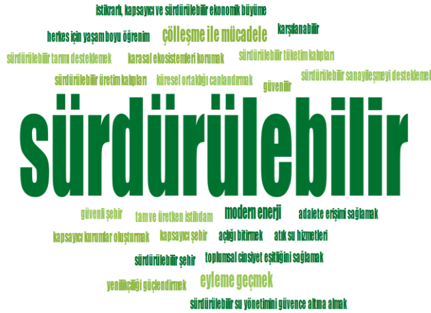
Şekil 1. Sürdürülebilir kalkınma kod bulutu.

“sürdürülebilir”, “çölleşme ile mücadele”, “eyleme geçmek”, “modern enerji”, “kapsayıcı kurumlar oluşturmak”, “küresel ortaklığı canlandırmak”, “tam ve üretken istihdam”, “yenilikçiliği güçlendirmek”, “istikrarlı, kapsayıcı ve sürdürülebilir ekonomik büyüme” ve “sürdürülebilir tüketim kalıpları” olduğunu ortaya çıkarmıştır.