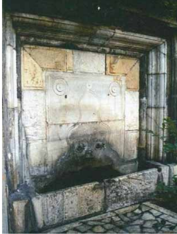
Foto.: 5- Tokat / Niksar Hükümet Önü Çeşmesi

rastlanmaktadır 17 (Foto: 5). Başları aşağıya sarkmış vaziyette İstanbul Haydar Paşa Gar Binası'nın (1906-1908) güneydoğu cephesinde karşımıza çıkan balık figürleri de, Bayramören / Balıklı Pınar'daki figürlere benzer formlarıyla oldukça ilgi çekici örneklerdir. 18