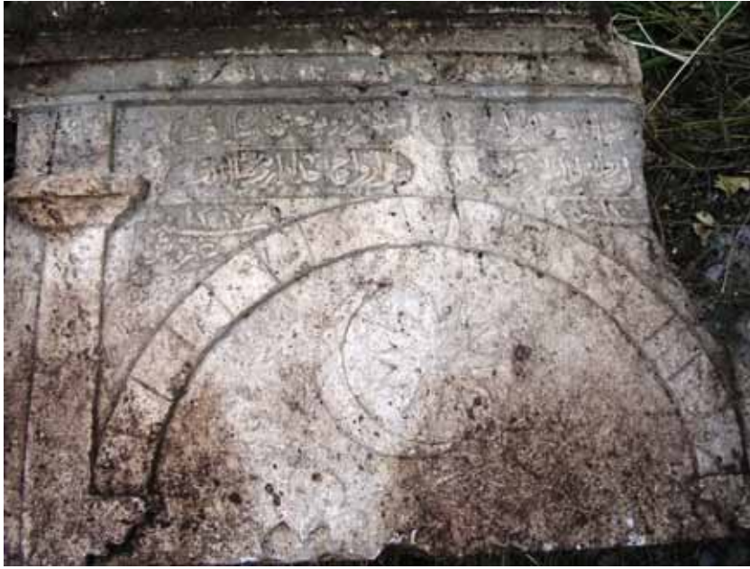
Foto.: 2- Balıklı Pınar'ın Cephesinin Üst Kısmı