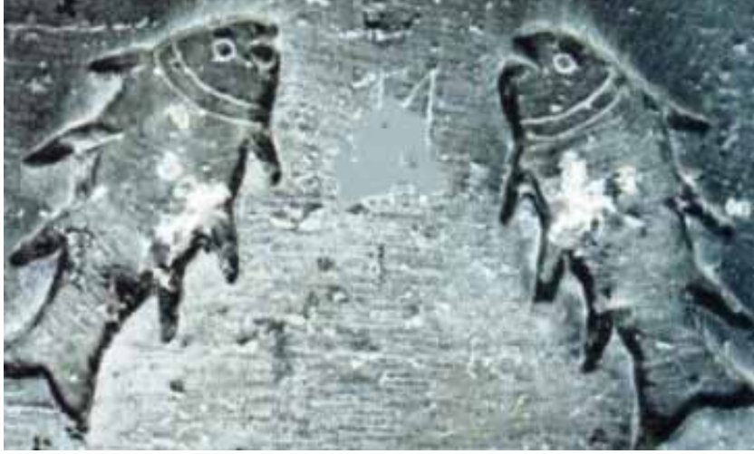
Foto.: 4- Denizli / Çardak Hanı'nın Hol Payelerindeki Balık Figürleri

eden bir sembol olarak kabul gören 7 balık figürleri, bu mahiyette Anadolu'daki bazı yapılarda çeşitli burç hayvanlarıyla birlikte tasvir edilmiştir.