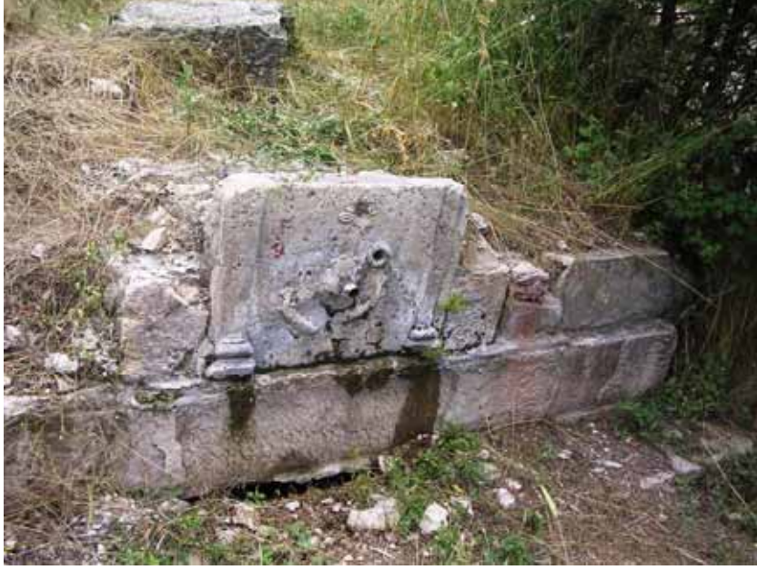
Foto.: 1- Balıklı Pınar'ın Bugünkü Durumu