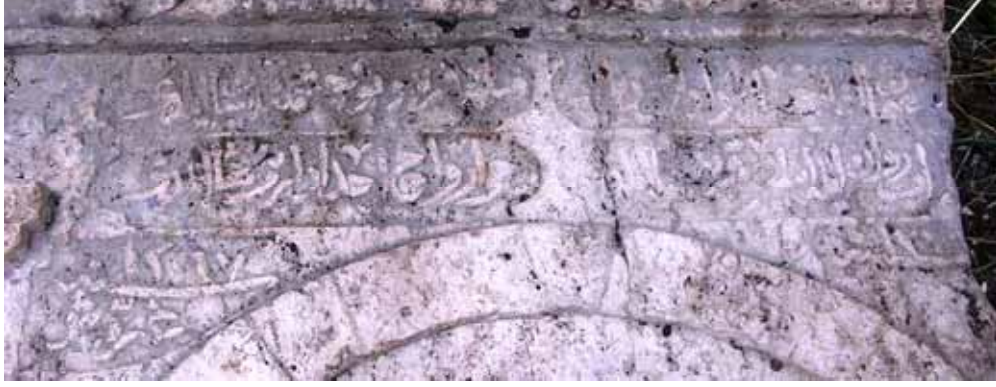
Foto.: 3- Balıklı Pınar'ın Kitabesi