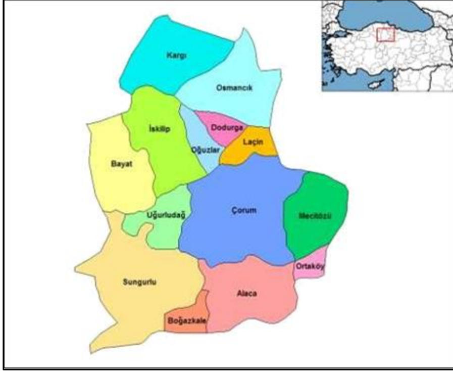
Şekil 1: Çorum'un yerleşme haritası