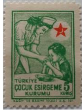
Resim 11: Şefkat Pulları

Şefkat pulları, Himaye-i Etfal ve Hilal-i Ahmer gibi hayır kurumları için satılırdı. Mektup ve telgraflarda kullanılan pullar işlevsel olması sebebiyle kolaylıkla satılabilir malzemelerdi. Görsellerde betimlendiği üzere şekil 10’da yeni doğmuş bir bebek ve sağlıklı olduğu düşünülen beyaz gömleli bir kadın görülür. Şekil 11’de ise çocuğu besleyen bir görevli vardır. İki görselde de şefkatli kadın imgesi sürdürülmektedir. Pulların adının da şefkat pulları olması bu görüşü desteklemektedir.