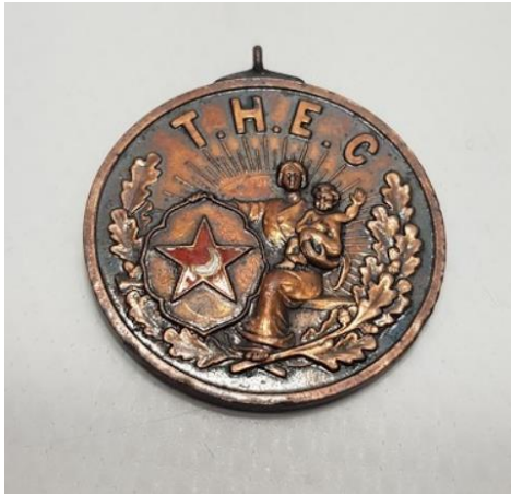
Resim 3: Bronz Madalya Ön Yüzü

Himayet-i Etfal Cemiyet'ine ait kartpostal, kişilerin satın alıp kullanacakları bir biçimde hazırlanmıştır. Cemiyet'in sembolünde kırmızı yıldız ve ay görülmektedir. Kartpostalın arka yüzünde ise sevgi ile kollarını açmış bakım görevlisi gülümseyerek çocuklara şefkat göstermektedir. Çocuklardan bazıları, heyecanla bazıları şaşkınlıkla çoğu görevliye yönelik bir vücut pozisyonu almışlardır. Modern giyimli çocukların kızılı oğlanlı bir arada olması da dönemin şartları düşünüldüğünde dikkat çekmektedir. Bazılarının çıplak ayaklı olduğu görülür bu durum yardıma muhtaç ve kimsesiz olduklarını temsil ediyor olabilir. Altında yer alan notta ise yapılan yardımlar sayesinde yetim çocukların artık ağlamayacağı ve yüzlerinin güleceği ifade edilerek yardımların yapılması teşvik edilmektedir.