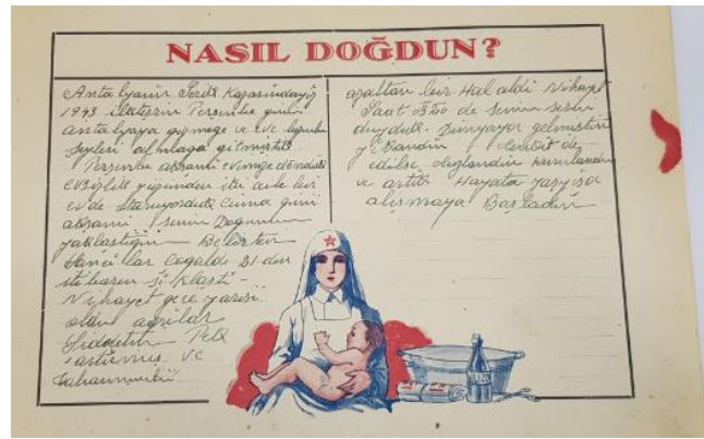
Resim 9: Annemin Kitabı "Nasıl Doğdun?" Bölümü

Bu metinde de kitabın amacından kısaca bahsedilir. İfadelerden anlaşılacağı üzere on beş yaşına kadar kullanılacak olan bu kitap, o yaşlara kadar çocuğun annesiyle güçlü bir bağı olacağı ve onun bakımından sorumlu olacağı anlamını ortaya koymaktadır. İkinci paragrafta da yine Büyük Gazi'nin öğütlerine yer verilmiş ve üzerine düşen görevi yerine getireceğine dair söz vermiş olan annenin, sözünü yerine getirdiği şimdi sıranın çocukta olduğunu anlatan vefa ifadeleri yer alır. Vatana hayırlı bir evlat olması öğütleri verilir. Son kısımda ise bu görevleri yerine getirdiği takdirde annesinin çektiği zahmetleri ona helal edeceği eklenmiş, yine bir ahlak beklentisi içinde çocuğun annesi ve vatana karşı borçlu olduğu algısına vurgu yapılmıştır. Kitabın on beş yaşına kadar kullanılacak olması çocuk gelişim evreleri açısından dönemin modern bilimine yönelik bir bakışı olduğu söylenebilir. Bunun yanı sıra kitabın çocuk hakkında olmasına rağmen adının anne kitabı olması yine çocuğun anneye ait bir esermiş gibi metalaştırdığı söylenebilir. Bunun kanıtı olarak da on beş yaşında çocuğa hediye edilmiş tüm gelişim evrelerinin notları olarak bu defter ortaya konmuştur.