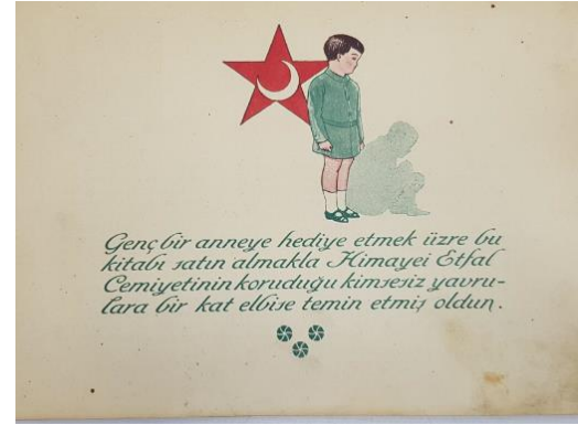
Resim 6: Annenin Kitabı İlk Sayfa

Yeni anne olacak kadınlar için çocuklarını takip etmek amacıyla basılmış olan “Anne Kitabı”nın satın alındığı bağış ile kimsesiz çocuklara kıyafet desteğinde bulunulmaktaydı. Kitabın adının anne kitabı oluşundan kapak fotoğrafında bebeğini emziren anne görseline kadar her detayıyla anneliğin kıymeti vurgulanmıştır. Himaye-i Etfal sembolü burada da vurgulanmaktadır. Bir kız ve bir oğlan silueti oynarken görülür. Çocuklar giyimleriyle ve duruşlarıyla dönemin etkilerine uyumlu modern yaşamın göstergesi olmuşlardır. İlk sayfada ise Himaye-i Etfal Cemiyeti'nin yıldızının önünde resmedilmiş olan bir oğlan diz çökmüş gölgesine bakmaktadır. Verilmek istenen ifade bağışlar sayesinde bir çocuğun daha mutlu olduğu ve gelişimine katkıda bulunulduğudur. Sırtını yıldız sembolüne dayamış ayağa kalkmış olsa da küskün bakışları ve güvensiz duruşu ile görenler için aslında bir acıma hissi uyandırmak amaçlanır. Önceki bölümlerde de ifade edildiği gibi bu süreçte “düşkün” olarak görülen yetimler ve ihtiyaç sahibi çocuklara sanki birer lütuf veriliyormuş gibi bir algı oluşturularak görselleştirilmiştir. Gün geçtikçe devletlerin bu politikaları yerini daha sistematik vakanunlarla desteklenen bir hak temelli politika anlayışa bırakmıştır.