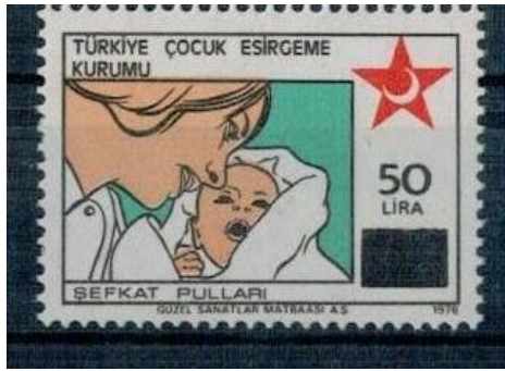
Resim 10: Şefkat Pulları

kendisine ait bir borç olduğunu, yardımlarını esirgememesi gerektiğini öğütler. Bahsedilen kitap özelinde konu çocuk gelişimi ve aile olmasına rağmen görünmez bir aile bireyi olan “baba”dan ne çocuk bakımı ne de yetiştirilmesi konusunda katkıları olup olmadığından bahsedilmemektedir. İdeoloji tarafından bu içerikler ele alındığında babaya böyle bir görev dahi yüklememektedir. Dönem şartlarına göre anne evlatlarıyla ilgilenmeli, baba ise kamusal alanda onları geçindirecek parayı kazanmalıdır. Karşılıklı emeklerin verildiği ailede, kadın çocuğuna ve vatanına ahlaklı ve vefalı bir evlat yetiştirmek için borçlu iken bu sorumlulukta tek başına olduğu algısı oluşmaktadır. Her ne kadar eşitlikçi bir döneme girilmiş, kadın hakları alanında çokça gelişimler kaydedilmiş olsa da kadının uygulamada yeri yine ev içinde konumlandırılmıştır.