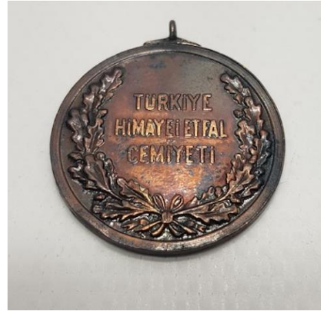
Resim 4: Bronz Madalya Arka Yüzü