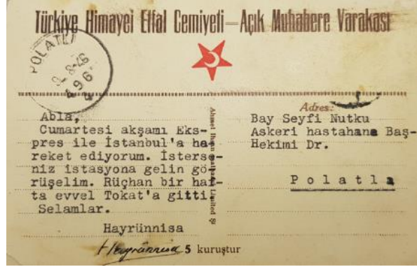
Resim 2: Kartpostal Arka Yüzü

Himayet-i Etfal Cemiyet'ine ait kartpostal, kişilerin satın alıp kullanacakları bir biçimde hazırlanmıştır. Cemiyet'in sembolünde kırmızı yıldız ve ay görülmektedir. Kartpostalın arka yüzünde ise sevgi ile kollarını açmış bakım görevlisi gülümseyerek çocuklara şefkat göstermektedir. Çocuklardan bazıları, heyecanla bazıları şaşkınlıkla çoğu görevliye yönelik bir vücut pozisyonu almışlardır. Modern giyimli çocukların kızılı oğlanlı bir arada olması da dönemin şartları düşünüldüğünde dikkat çekmektedir. Bazılarının çıplak ayaklı olduğu görülür bu durum yardıma muhtaç ve kimsesiz olduklarını temsil ediyor olabilir. Altında yer alan notta ise yapılan yardımlar sayesinde yetim çocukların artık ağlamayacağı ve yüzlerinin güleceği ifade edilerek yardımların yapılması teşvik edilmektedir.