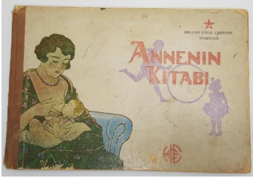
Resim 5: Annenin Kitabı Kapak

Bağışlar için hazırlanmış bronz madalyanın bir yüzünde Türkiye Himaye-i Etfal Cemiyeti'nin adı bitkisel bir motif ile birlikte görülür. Diğer yüzünde ise kucağında çıplak bir bebek ile arkasından güneş doğan kadın tasvir edilmiştir. Kadın figürü, tam karşıya büyük bir gururla bakmaktadır ve üzerinde uzun bir elbise vardır. Ayakları çıplaktır ve diğer elinde de Türkiye Himaye-i Etfal Cemiyeti'nin sembolünün bulunduğu bir görsel tutar. En üstte ise yine cemiyetin isminin kısaltması vardır. Madalyadaki görselin genel kompozisyonuna bakılacak olursa bir sembol olarak kurtarıcı, koruyucu ve güçlü kadın Cumhuriyet'e doğan bir güneş gibidir, bu güneş cemiyeti temsil etmektedir.