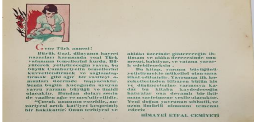
Resim 7: Annenin Kitabı Önsöz