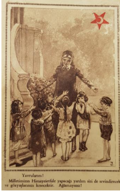
Resim 1: Kartpostal Ön Yüzü