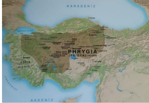
Fotoğraf 1. Phryg Krallığı Sınırları