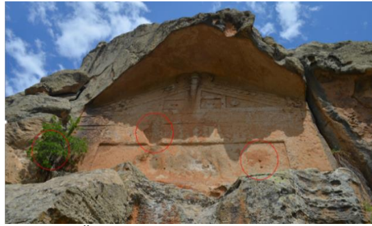
Fotoğraf 4. Bitmemiş Anıt Üzerinde Görülen Çatlaklar, Oyuklar ve Bitki Oluşumu

Bölgedeki kayaç yapısı yumuşak tüflerden oluştuğu için rüzgârlardan etkilenen anıtların bazılarının yüzeyinde aşınmalar ve bu aşınmalar neticesinde bünyesel zayıflamalar meydana gelmektedir. Genellikle yumuşak bir yapıya sahip olan tuf kayaçlar üzerine işlenen anıtlar, yağışlar sebebiyle çatlaklardan sızan yağmur ve kar suyunun ana kaya ile bağlantısı kalmayan taşları düşürmesi sonucunda tahrip olmaktadır. Bu bozulmanın örneği Yazılıkaya/Midas Anıtı'nın 200 m. güneybatısında yer alan Bitmemiş Anıt'ta da görülebilmektedir. Bu nedenlerle anıtlar rüzgâr, yağmur ve kar sularından doğrudan etkilenmektedir (Polat ve Avşar 2020, s.110).