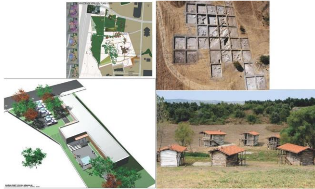
Fotoğraf 8. Aktopraklık Arkeopark Projesi ve Yerleşim Planı ve Canlandırmaları