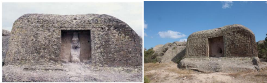
Fotoğraf 6. Büyük Kapı Kaya Anıtı Tahribat Öncesi ve Sonrası Fotoğraf

Birçok anıtın yerleşim yeri dışında bulunması, bu kültürel değerlerin definecilerin hedefi haline gelmesine neden olmaktadır. Bunun en iyi örneği olan Yazılıkaya/Midas Vadisi'nde Yazılıkaya Köyü'nün yaklaşık 1,5 km kuzeyinde konumlanan Areyastin/Areyastis Anıtı'nın yüzeyi kazma benzeri aletlerle, anıtın işlendiği kayalığın yan tarafı ise dinamit ile tahrip edilmiştir. Dağlık Phrygia Bölgesi sınırları içerisinde bulunan ve etrafında bir yerleşim birimi olmayan Afyonkarahisar il sınırları içerisinde bulunan Köhnüş Vadisi'nde bu durum oldukça açık bir şekilde görülmektedir. Vadide bulunan Büyük Kapı Kaya, Küçük Kapı Kaya, Aslankaya Anıtı ile Yılantaş Kaya Mezarı defineciler tarafından yoğun tahribata uğrayan önemli anıt gruplarıdır (Polat, 2007, s.523). Büyük Kapı Kaya Anıtı'nda 1996 yılı öncesinde niş içerisinde yer alan ana tanrıça kabartmasının bu tarihten sonra defineciler tarafından tahribata uğratıldığı ve ana kayada boydan boya derin çatlaklar meydana geldiği görülmektedir (Polat, 2007, s.523) Ayrıca bazı anıtlar üzerinde sprey boya ile tahribat da görülmektedir. Bu tahribatlar kayaç yapısına oldukça zarar vermektedir.