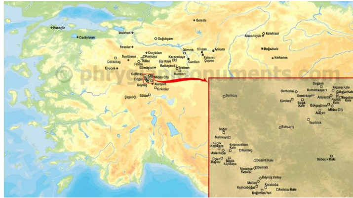
Fotoğraf 2. Phryg Vadisi'ndeki Yerleşimler

Phrygia'da gerçekleştirilen çalışmaların tarihçesi iki döneme ayrılabilir. İlk dönem, 16. yy'dan başlayarak 20. yy'ın ilk yarısına kadar gelen çalışmalardır. 18. yy'da yapılan araştırmalar, daha sonraki dönemlerde yapılacak olan bilimsel çalışmalara da zemin hazırlamıştır. Dolayısıyla bölgede gerçekleştirilen araştırmalar tarihçesinde son bölümü 1950'lardan sonraki araştırmalar oluşturmaktadır. Bu araştırmalarda Phryg kaya anıtlarının lokasyon bilgileri, gravürleri, belgelemeleri ve tanımlamaları yapılarak bilim dünyasına tanıtılmıştır.