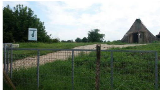
Fotoğraf 7. Yazılıkaya/Midas Anıtı Etrafındaki Değiştirilmesi Önerilen Tel Çit ve Kırklareli Aşağıpınar Höyüğü'nden Örnek Tel Çit Önerisi