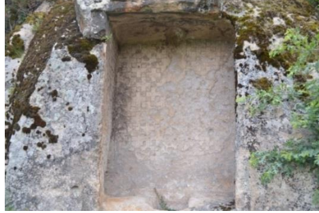
Fotoğraf 5. Midas Şehri Sümbüllü Anıt Yüzeyinde Görülen Yosun ve Bitkiler

diğer anıtlara göre daha net bir biçimde görülebilmektedir. Özellikle bu kaya anıtında alınlığın üst kısmının, kayanın doğal bir şemsiye olarak anıtı koruması ve korunaklı bir alanda bulunması, anıtı diğer anıtlara göre dış etkenlerden korumaktadır. Bu anıt üzerinde, kırlangıç yuvaları ve bıraktıkları atıkların izleri de görülmektedir. Bu atıklar anıt yüzeyinde aşınmaya ve renk değişimine neden olmaktadır.