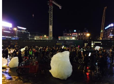
Görsel 3-4: Olafur Eliasson ve Minik Rosing, (2014), Buz Nöbeti (icewatch), yerleştirme, değişik ölçüler, Kopenhag.

Buz Nöbeti adlı çalışmaya bakıldığında bir ağırlık ve hafiflik meselesi doğrudan açığa çıkmaktadır. Daha doğrusu kendi ağırlığını kaybeden bir doğa parçası görülmektedir. Buzulların erimesi uzun zamandır başta iklimbilimciler, jeologlar ve coğrafya gibi çeşitli bilim alanlarından bilim insanları tarafından