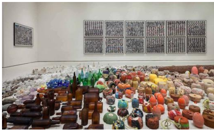
Görsel 10 ve 11: Gabriel Orozco, 2012, Asterizm, Enstalasyon, Guggenheim Müzesi, ABD.

Orozco’nun çalışmasında yer alan atıkların içerisinde plastik malzeme ve eşya atıkları, cam şişeler, ampuller, çeşitli metal eşya atıkları, halatlar, ipler gibi günlük hayatta insanın kullandığı her türden malzemenin bulunduğu görülmektedir.