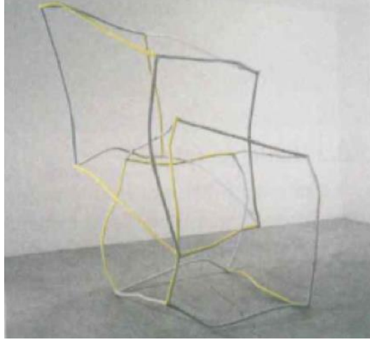
Şekil 2. Liz Larner, Küp, 1997. Çağdaş Sanat Müzesi, Los Angeles.

ve merak dolu bakışları kendine çekebilmek için kitle kültürüne sırtını dönerek çok radikal çalışmalara imza attılar.