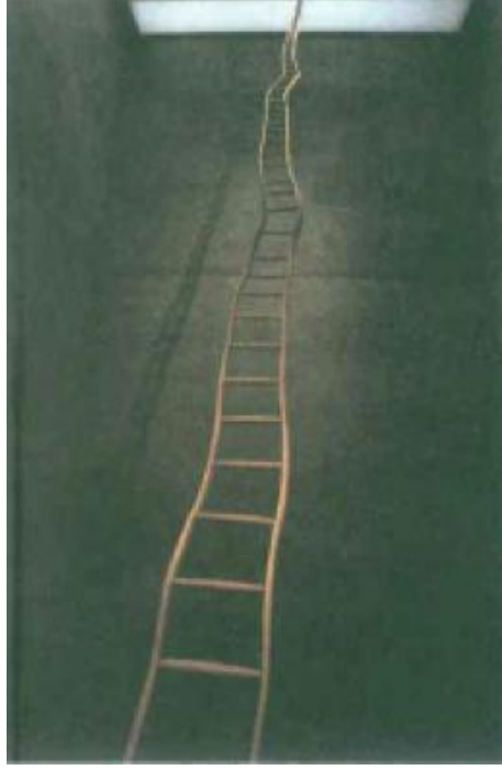
Şekil 1. Martin Puryear, Booker T. Washington için Merdiven, 1996. Fort Worth Modern Sanat Müzesi, Teksas