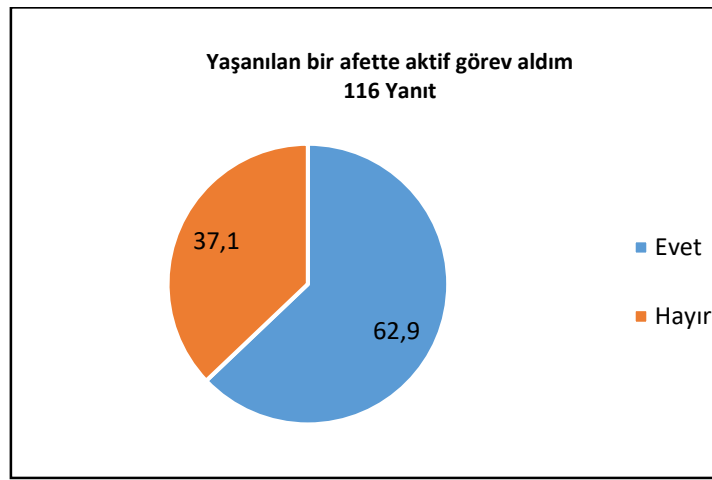
Şekil 2. Katılımcıların Yaşanılan Bir Afette Aktif Görev Alması

Şekil 2’de gösterildiği gibi araştırmaya katılanların %62,9’unun afet deneyimine sahip olduğu ve % 37,1’inin ise sahip olmadığı tespit edilmiştir. Sivil savunma alanında çalışan personelin afet deneyimine sahip olduğu ve bu deneyimin de çoğunlukla depreme ilişkin olduğu belirlenmiştir. Dolayısıyla, “sivil savunma birimlerinde çalışan personelin afet deneyimi yetersizdir” şeklindeki dördüncü hipotez reddedilmiştir.