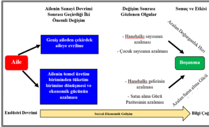
Şekil 1. Araştırmanın Modeline Yönelik Temel Yaklaşım

İkinci olarak satınalma gücü paritesi irdelenmiştir. Erdoğan ve Aslan (2021)'a göre satınalma gücü paritesi yüksek olan yerlerde boşanma oranları da yüksektir. Aslan (2020) tarafından pandemi döneminde yapılan çalışmada benzer şekilde boşanma oranlarının satınalma gücü paritesi yüksek olan çevrelerde fazla olduğu sonucuna ulaşılmıştır. Van (2022) boşanan bireylerin yoksullaştığını ve satınalma güçlerinin düştüğünü belirlemiştir. Guveli ve diğerleri (2022) Avrupa ülkelerine göç eden Türkler üzerinde yaptıkları araştırmada benzer bulgulara ulaşmışlardır. Sonuç olarak kavramsal çerçeve ile literatür taraması neticesinde oluşturulan araştırmanın modeline yönelik temel yaklaşım Şekil 1'de sunulmuştur.