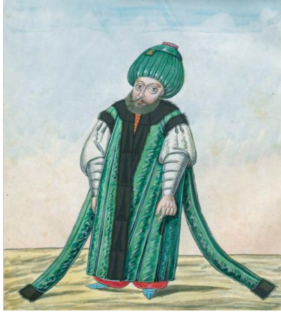
Şekil 2: Rumeli Kazaskeri 40