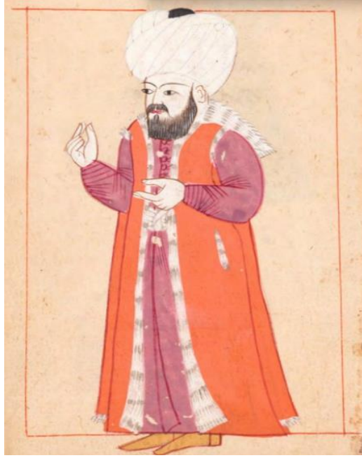
Şekil 1: Kazasker 35