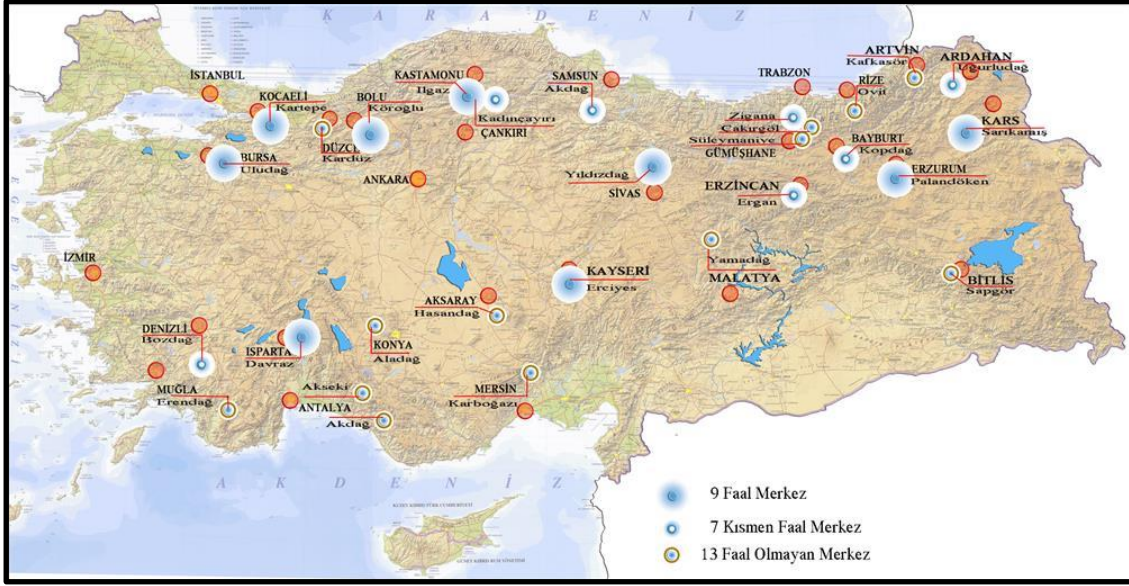
Görsel 1: Türkiye’de Faaliyet Gösteren Kış Sporları Turizm Merkezleri &KTKGB*