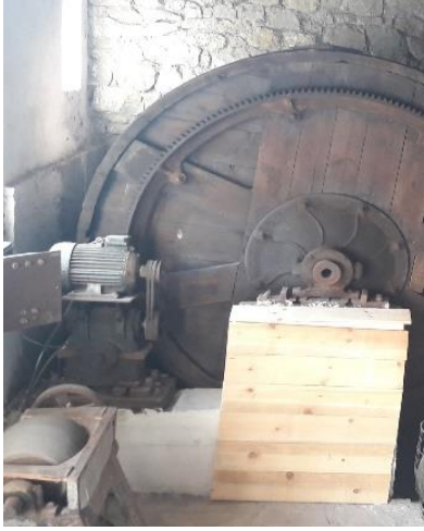
Şekil 7: Deri dolab çarkı