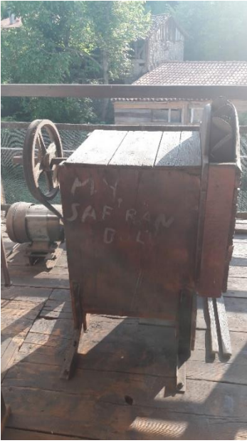
Şekil 22: İskefe makinası derilerin yumuşatılması