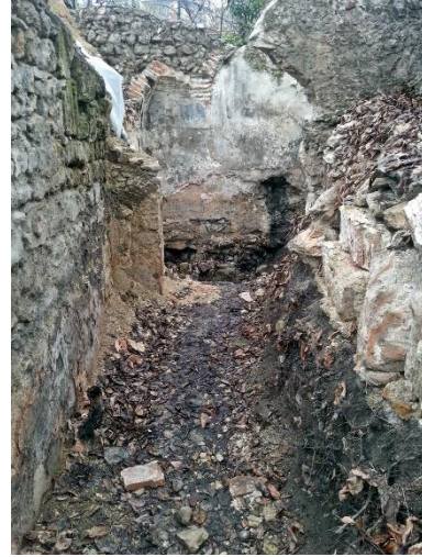
Şekil 32: Tabakhane hamamı