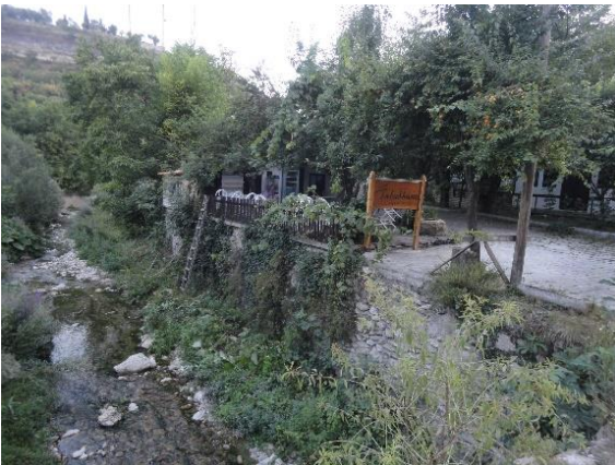
Şekil 15: Tabakhane deresi