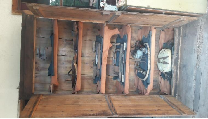
Şekil 27: Dericilikte kullanılan aletler