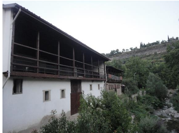
Şekil 16: Tabakhane üst kat müze olmadan önce