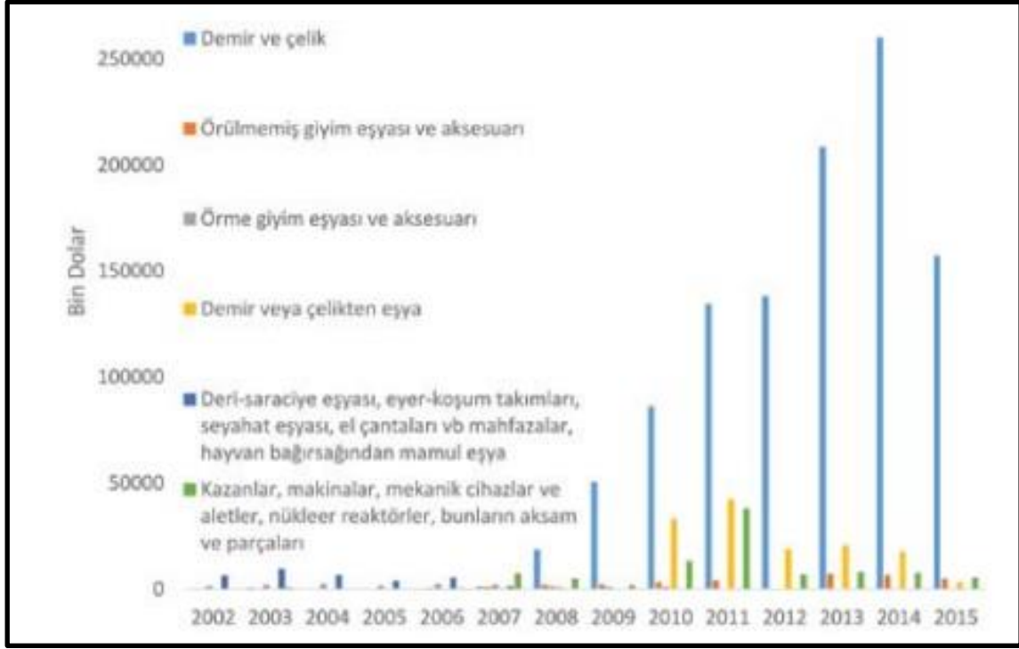
Tablo 1: Karabük ili 2002-2015 yılları arası ihracat raporu

(Kaynak: https://www.safranbolutso.org.tr/wp-content/uploads/2016/10/KARAB%C3%9CK-%C4%B0HRACAT-RAPORU.pdf , 10.04.2023)