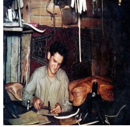
Şekil 4: Dericilikle birlikte gelişen meslekler (semercilik, yemenicilik saraçlık)

Cumhuriyet döneminde gerilemeye başlayan bölge ekonomisi, 1937'de Karabük'e Demir Çelik Fabrikası kurulana kadar tarım ve hayvancılıktan ibaretken, bu yıldan itibaren iş alanı olarak fabrika ön plana çıkmıştır. Karabük'ün gelişen ekonomik imkânlarının sonucu olarak Safranbolu'da ticaret ve tarımda gelişme olmuştur (Akman, 2000: 23).