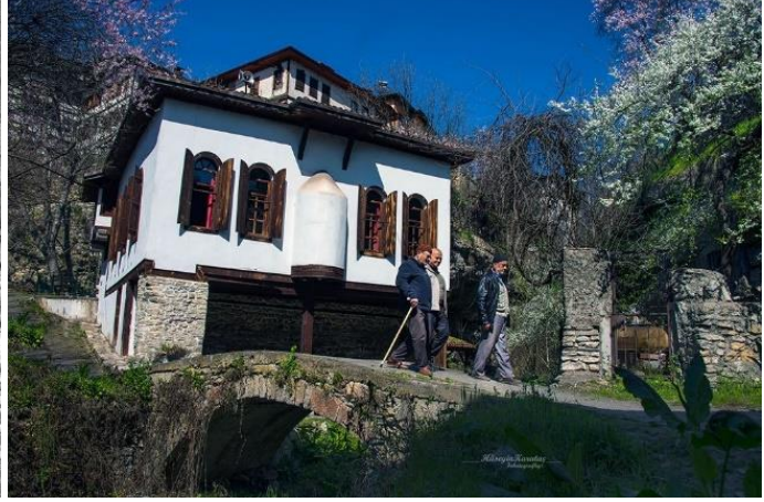
Şekil 6: Derenin üzerine inşa edilen tabakhane cami ve namazdan çıkan mahalle eşrafı