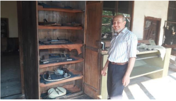
Şekil 19: Dericilikle ilgili el aletleri