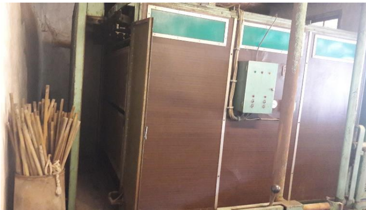
Şekil 29: Dolap