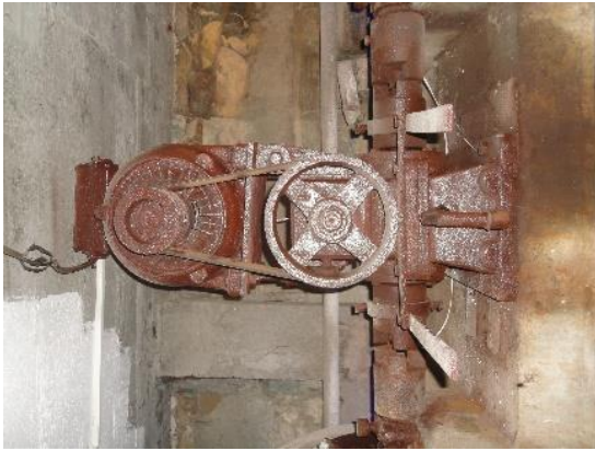
Şekil 9: Motor