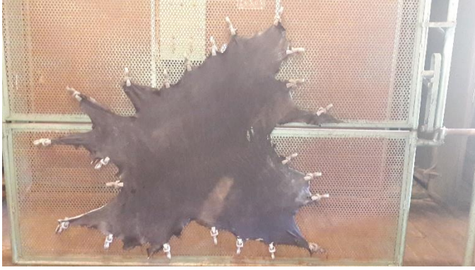
Şekil 30: Gergi