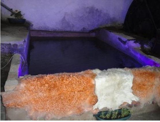
Şekil 13: Islatma havuzu