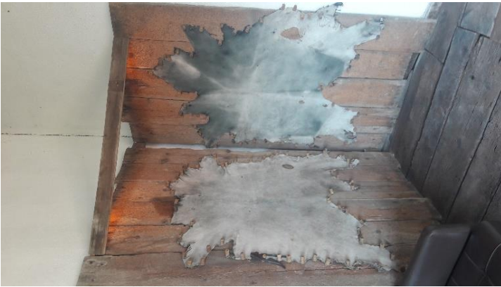
Şekil 28: Gergideki deriler