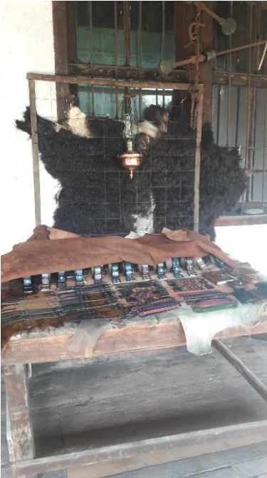
Şekil 24: Gergef tahtası boy ölçme