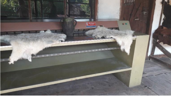
Şekil 26: Desi makinası