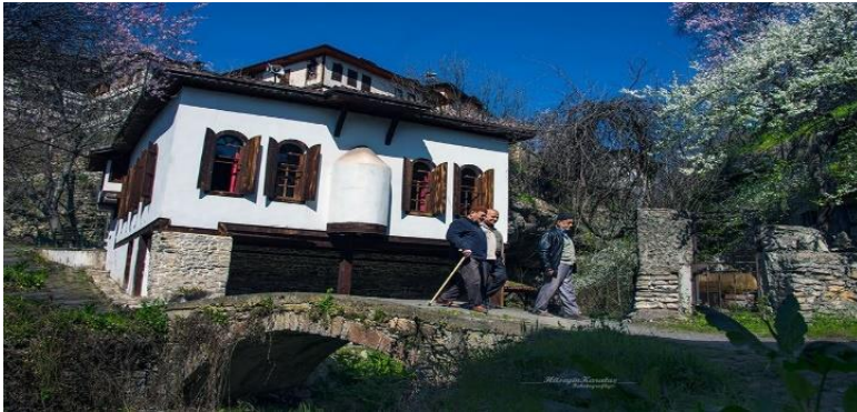
Şekil 33: Derenin üzerine inşa edilmiş olan Tabakhane cami ve namazdan çıkan mahalle eşrafı