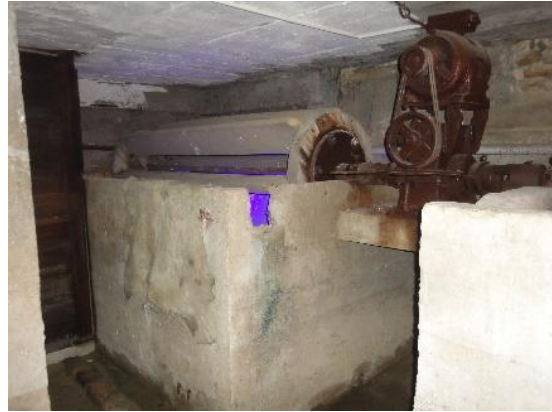
Şekil 10: Kireçlik pervaneleri derilerin tüylerini dökmek için