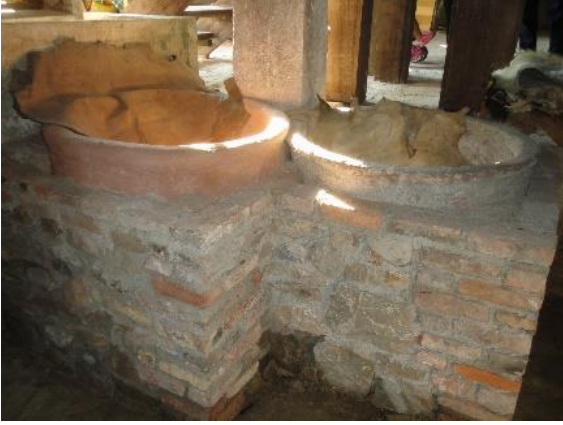
Şekil 11: Tabaklama küpleri