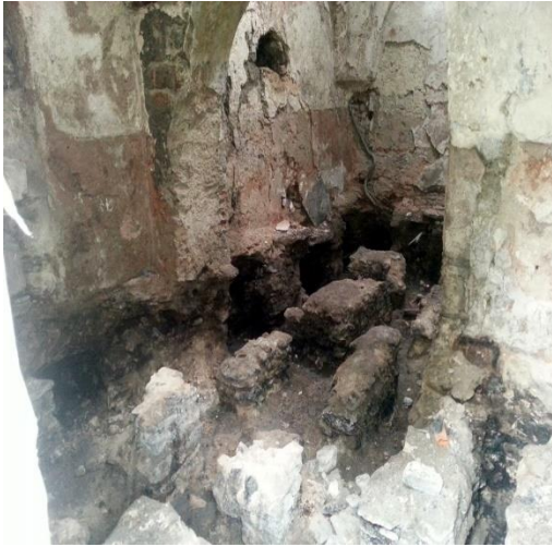
Şekil 31: Tabakhane hamamı