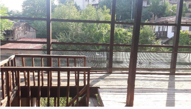
Şekil 21: Tabakhane üst kat