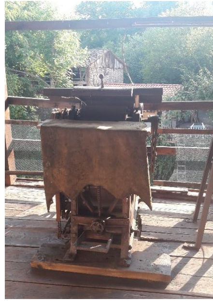
Şekil 23: Zımpara