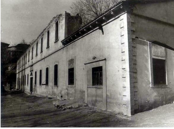
Şekil 3: Eski tabakhane binası

Dericilik 18. yüzyıl sonuna kadar rakipsiz olarak yakın ve Ortadoğu'nun tekelinde iken, 19. yüzyılda Fransızlar dericiliği Türklerden öğrenerek Avrupa'ya yaydılar. Özellikle, Fransa'da bir devlet kuruluşu olan Tannerie de France'in kuyu sepisi ile elde ettiği köseleler dünyanın her yerinde aranır olmuştur. 19. yüzyılın sonunda laboratuvarlarda geliştirilen yeni dericilik metotlarının, o tarihe kadar yalnız tanen, yağ ve şapla yapılan sepilemeden daha hızlı sonuç veren krom sepsinin, derilerin anilin boya ile boyanması ve dolapların yağlanması gibi teknolojik gelişmelerin sanayiye girmesi, geleneksel yöntemlerle çalışan Anadolu'daki dericiliğin pazar bulamamak yüzünden gerilemesine yol açmıştır. 19. yüzyıl sonunda deri sanayiine makineleşme de girdi 1850 Yılına kadar Safranbolu gibi Anadolu'nun diğer kentlerinde imal edilen kırmızı kösele İstanbul piyasasında iyi bir yer tutmuştu. Bu tarihte Kazlıçeşme'de ilk özel şahsa ait deri fabrikası kuruldu ve havuzlarda Fransız sistemine göre kösele pişirilmeye başlandı. Bu fabrikayı Zeytinburnu'nda, Yedikule'de ve diğer Anadolu kentlerindeki fabrikalar izledi. Şekil 3'te Safranbolu'daki eski tabakhane binası görülmektedir.