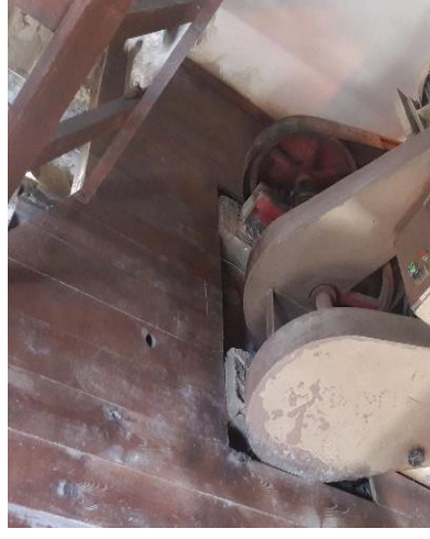
Şekil 8: Tıraş makinesi