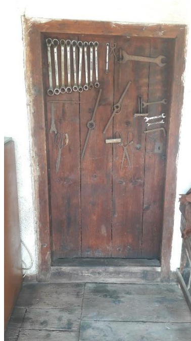
Şekil 25: El aletleri