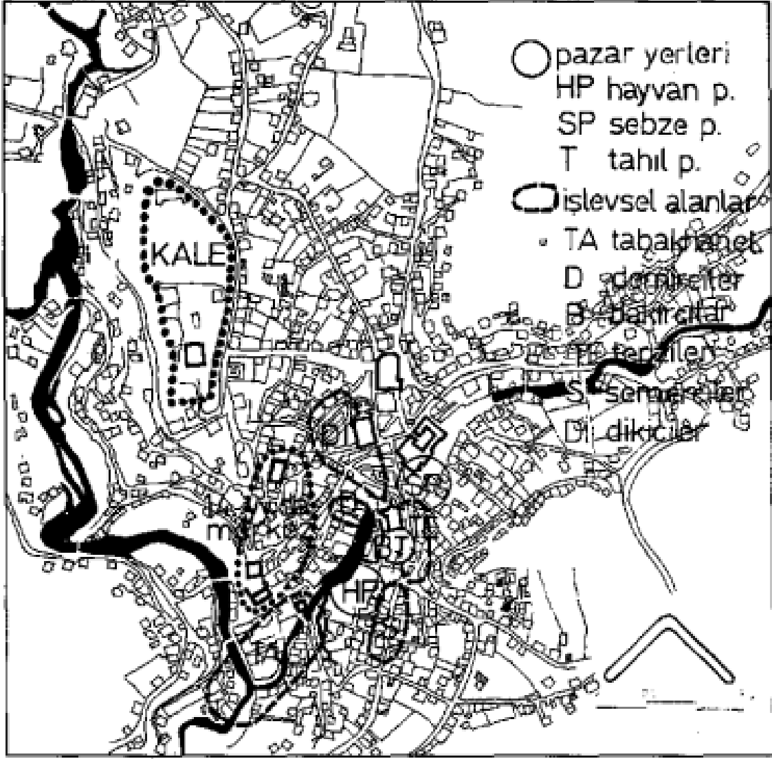
Şekil 1: Çukur (Eski çarşıdaki) işlevsel yapıların haritası (Türe& Şenyapılı, 1976: 66)

19. yüzyıl, Safranbolu’nun sancak merkezi olması nedeniyle ticaret ve ekonominin en hareketli olduğuasırdır. El sanatları debbağlık (dericilik) bu asırda ileri düzeylere ulaşmıştır (Tunçözgür, 1999: 23-24). 16. asırda Safranbolu’da ekonominin merkezi bugünkü sığır pazarının bulunduğu yerdeki Tuzcu Hanı’dır. Bu hanın diğer bir adı da Hidayetullah Ağa Hanı’dır (Safranbolu Kaymakamlığı Hizmet İçi Briefing Dosyası, 2007: 14). Cinci Hanı’nın yapımıyla (17. yüzyıl) birlikte ekonomik hareketlilik epey ivme kazanmıştır (Tunçözgür, 1999: 24).