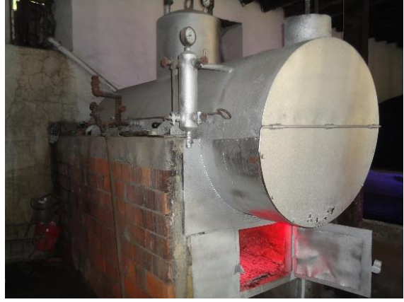
Şekil 14: Buhar kazanı