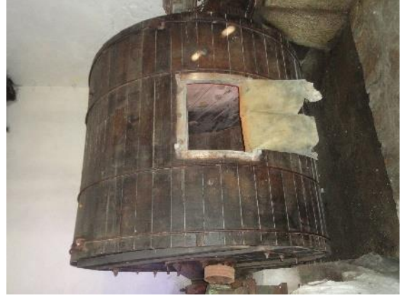
Şekil 12: Tabaklama dolapları