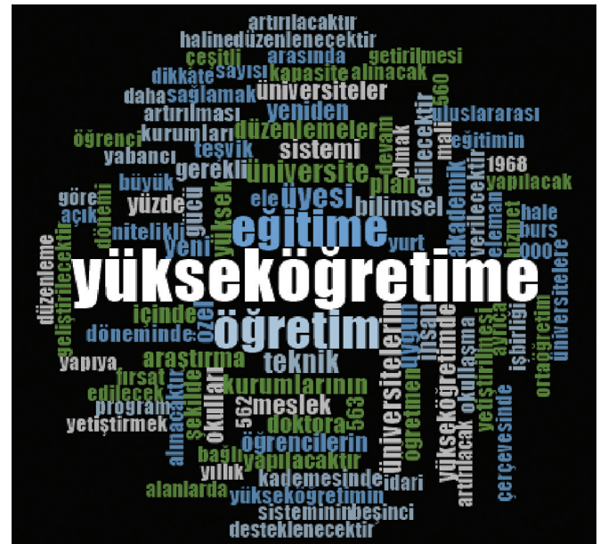
Şekil 1. Kalkınma planlarından elde edilen sözcük bulutu.

Yıldız ve Karakütük (2017) tarafından yapılan bir çalışmada; planlı kalkınma dönemlerinin ilk yıllarında üniversite sayısının az olması dolayısıyla insan gücü planlamasının rahatlıkla yapıldığı, ilerleyen yıllarda, üniversite sayısının artması ile insan gü-