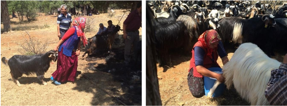
Görsel 2. Sarıkeçililerde Hayvancılık ve Süt Sağma İşlemi (Eroğlu, 2016)

Yaylalarda ürettikleri süt ürünlerinin bir kısmı kendi ihtiyaçları için ayrılırken, bir kısmı da günün belli saatlerinde o bölgelerden geçen süt toplayıcıları tarafından satın alınmaktadır. Bazen de takas yöntemi ile süt, peynir ve tereyağı süt toplayıcısına verilir, karşılığında da ihtiyaçları olan ve siparişleri daha önceden verilmiş olan ürünler alınır (Yağal, İ., 2017).