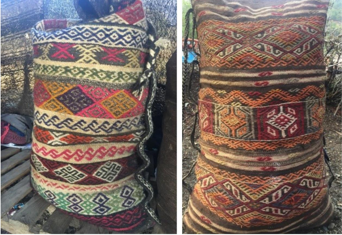
Görsel 10. Emine Karadayı Çuval Dokuma Örneği 7 ve 8 (Eroğlu, 2016)