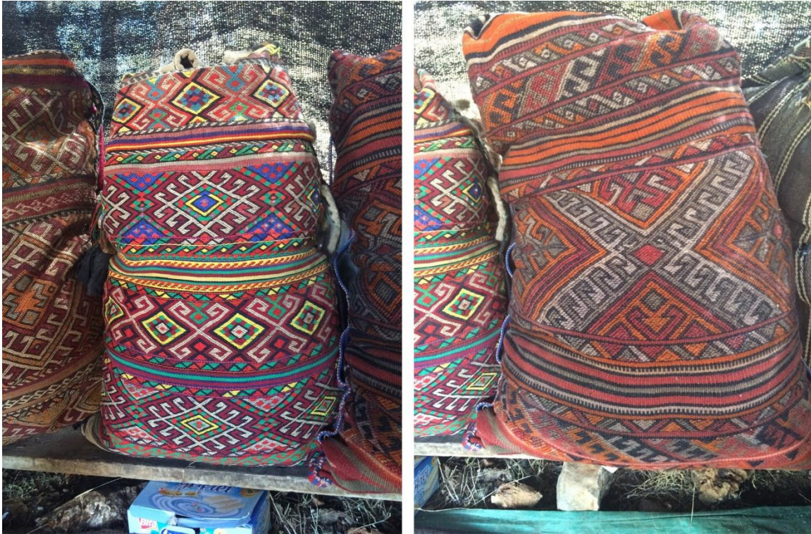
Görsel 7. Emine Karadayı Çuval Dokuma Örneği 1 ve 2 (Eroğlu, 2016)