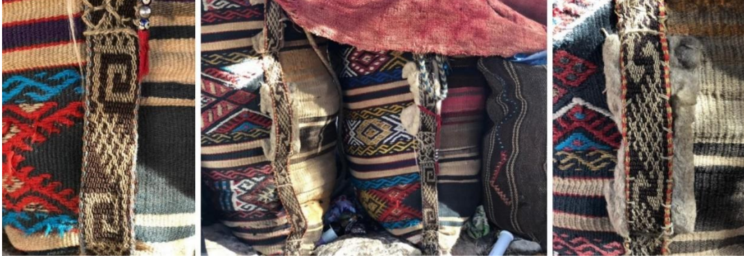
Görsel 5. Çuvallardaki Kolon Dokuma (Kâtibi) Örnekleri (Eroğlu, 2016)

Emine Karadayı dokumalarını ıstar adı verilen ve diğer Sarıkeçili Yörük grupları tarafından da kullanılan sarma tip dokuma tezgahında dokumaktadır. Dokumalarını genellikle kış aylarında yaptığını belirtmiştir (Karadayı, 2017).