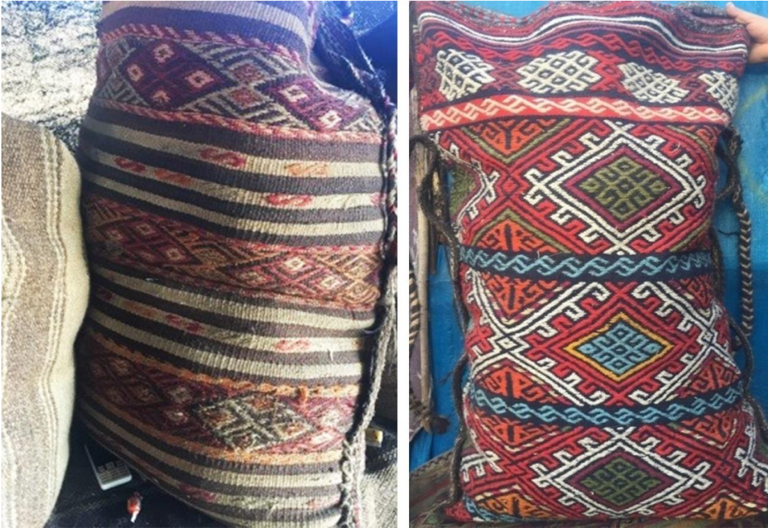
Görsel 9. Emine Karadayı Çuval Dokuma Örneği 5 ve 6 (Eroğlu, 2016)