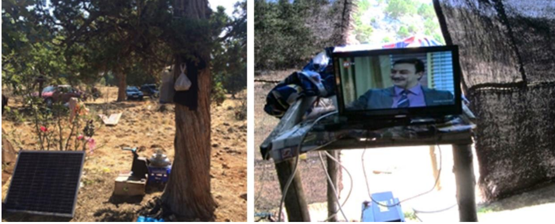
Görsel 4. Çadır Dışında Kurulan Güneş Paneli ve Çadır İçinde Elektrikli Cihaz Kullanımı (Eroğlu, 2016)

Yörük çadırlarının büyük bir bölümünde aydınlatmalar akü ile çalışan lambalarla ve gaz lambaları ile sağlanmaktadır. Aydınlatma için güneş paneli ve traktörlerinin akülerinden de yararlanılmaktadır. Aydınlatma panelleri ile çadırlara elektrik sağlayarak güncel teknolojik aletleri çalıştırmaktadırlar (Bkz. Görsel 4).