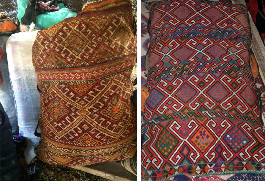
Görsel 8. Emine Karadayı Çuval Dokuma Örneği 3 ve 4 (Eroğlu, 2016)