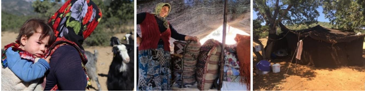
Görsel 1. Sarıkeçili Yörük Yaşamı ve Yörük Çadırı (Eroğlu, 2016)

Sarıkeçili Yörüklerinin temel geçim kaynakları hayvancılıktır. Hayvancılık, Sarıkeçililer için hem bir uğraştır hem de yaşam ve geçim kaynağıdır. Günlük yaşamlarının büyük bir bölümünü hayvan otlatma, hayvanların sağılması ve sağılan sütlerin peynir, yoğurt ya da yağ üretimiyle uğraşarak geçirirler.