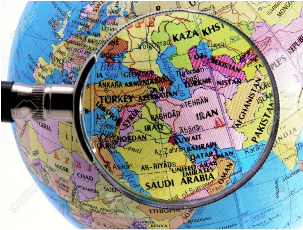
Harita 2: Küresel Mercekten Ortadoğu