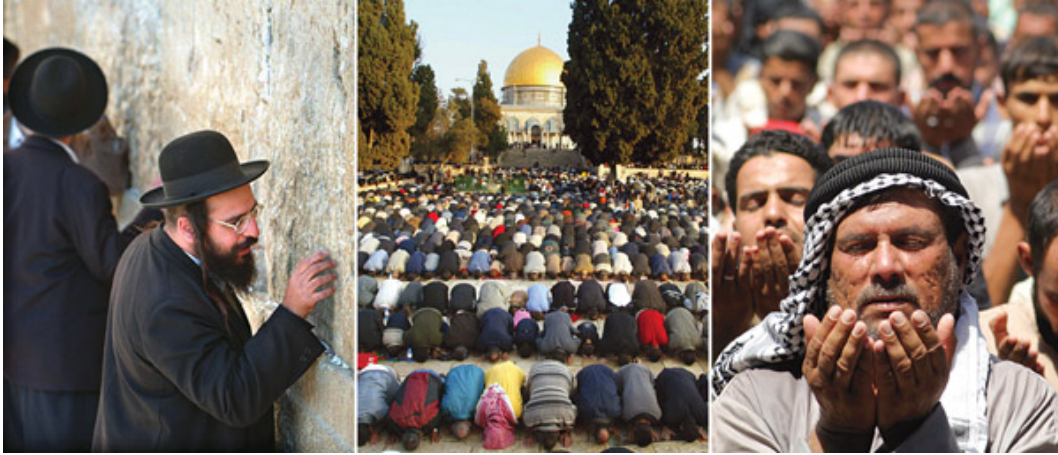
Görsel 1: Dinsel Ritüellerden Bir Görünüm