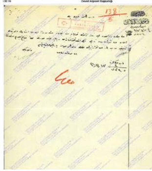
Tablo-3: Darülfünun öğrencilerinin tramvay ücretlerini protestosu/ 16.11.1924.