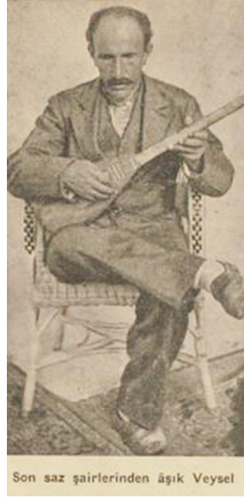
Son saz şairlerinden âşık Veyssel

— Geçen sene bu evde bir sabunla elimi yıkamıştım... Kokuyordu... Bu koku güzeldi... Bu güzel kokan şey çirkin olamazdı... Şüphesiz o da güzeldi. Ne yapayım ki yalnız koklayabiliyordum, göremezdim ki... Dayanamadım, bu sabunlardan istedim. Sağ olsunlar verdiler... Bütün sene kokladım ve bu kokudan duyulanarak burasını hatırladım.