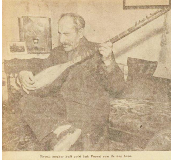
Sivaslı meşhur halk şairi Âşık Veysel sazı ile bu hâle.

şarkısını plaktan, Ankara Radyosu’nda verdiği konserlerden her hâlde dinlemiş olacaksınız. Bundan daha güzellerini söyleyen ve bunlara güzel besteler bağlayarak okuyan iki gözü kör Âşık Veysel hayatını anlatıyor. Ağır ağır, düşünerek, sözlerini tartarak konuşuyor. Gözleri görmüyor ama, her şeyi görüyor ve biliyormuş gibi bir hâli var. Nükteyi seviyor. Sözü ile, sazı ile kendisini dinlemek isteyenlere hoşça vakitler geçiriyor. Zeki bir adam olduğu her hâlden ve hareketinden belli. Anlatmaya başladı: