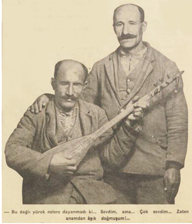
— Bu dağlı yürek nelere dayanmadı ki... Sevdim, ama... Çok sevdim... Zaten anamdan âşık doğmuştum!...

— Evet olduktan sonra çaresiz... Bu dağlı yürek nelere dayanmadı ki... Evlendim yine dirlik görmedim... Sevdim... Çok... Esasen âşık doğmuştum... Karımın güzel olduğunu söylerlerdi... Fakat (âdemoğlu namert olur) derler, ya âdemkızı ne olur? Onu dememişler... Bir oğlum oldu... Bir gece anası emzirirken üstünde uyuyakalmış... O uğursuz günün seherinde beni telaşla uyandırdılar “Çocuk solumuyor” dediler. Yatağımdan fırladım, elimi ağzına tutarak