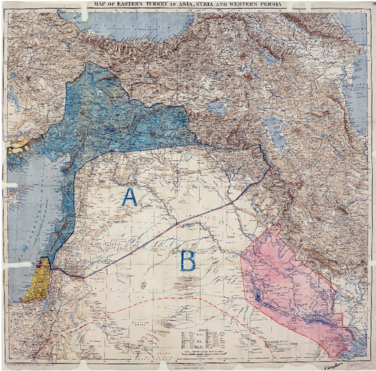
Sykes-Picot Anlaşması ile İngiltere ve Fransa arasındaki paylaşımı gösterir harita - The National Archives, FO-Foreign Office, MPK 1/426.

İngilizler bu paylaşım planlarını, Fransa'nın bölgeye ilişkin (Filistin, Irak gibi) beklentileri şeklinde yansıtarak, ancak -Sykes-Picot Anlaşması'ndan bahsetmeden- kısmi olarak Şerif ile paylaşmıştı. Bu bağlamda Fransa'nın kontrolünde olacak Akdeniz kıyıları (Trablusşam, Beyrut, İskenderun gibi) hariç diğer yerlerde Arap devletinin kurulmasının destekleneceği; 29 bunun yanı sıra Şeriflerin ve Hicaz bölgesinin korunması dâhil devlet kurmak için ihtiyaç duydukları alanlarda her türlü desteğin verileceği bildirilmişti. 30