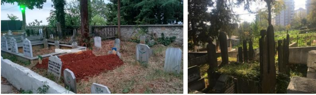
Foto. 4-5. Âhî Evren Dede Camii ve Türbesi Haziresinin doğu ve güney bölümü