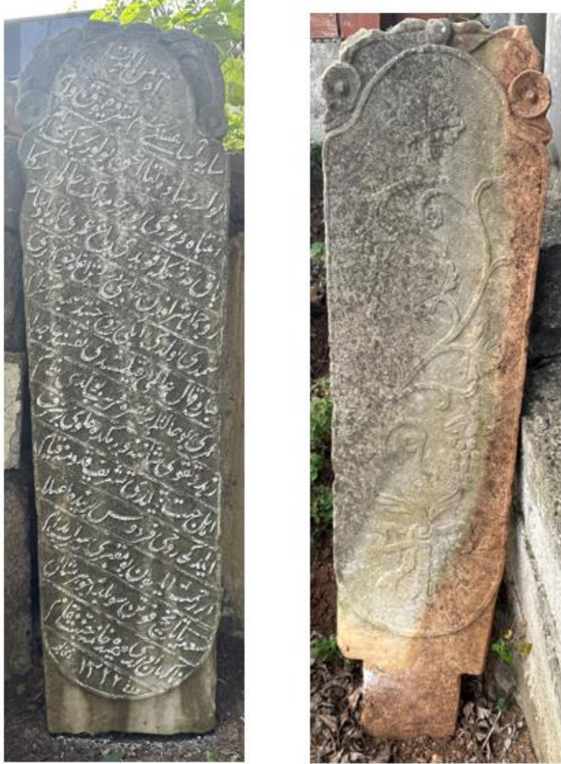
Foto. 41-42. Başucu Şâhîdesi / Ayakucu Şâhîdesi

Ayakucu şâhîdesi (9b) ; 35 x 150 cm ölçülere sâhîp düşey dikdörtgen plaka şeklindeki mermer şâhîdenin gövdesi bitkisel bezemelidir. Alt kısımda birbirine fiyonk ile bağlanan dalları donatan asma yaprağı ve üzüm salkımları ile tezyin edilmiştir. Başlık kısmı kırılmıştır (Foto. 42).