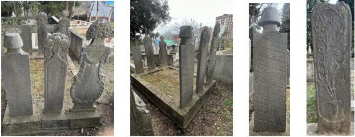
Foto. 19-22. Genel Görünüm / Başucu Şâhîdesi / Ayakucu Şâhîdesi

Ayakucu şâhîdesi (3b) ; yuvarlak kemerle sonlandırılan şâhîde, 40 x 110 cm ölçülere sâhîp düşey dikdörtgen formludur fakat üst kısmı kırılmıştır. Gövde üzerinde bereket boynuzundan fıskıran dallar ve yürek formlu yapraklar bulunmaktadır. Malzemesi mermerdir (Foto. 22).