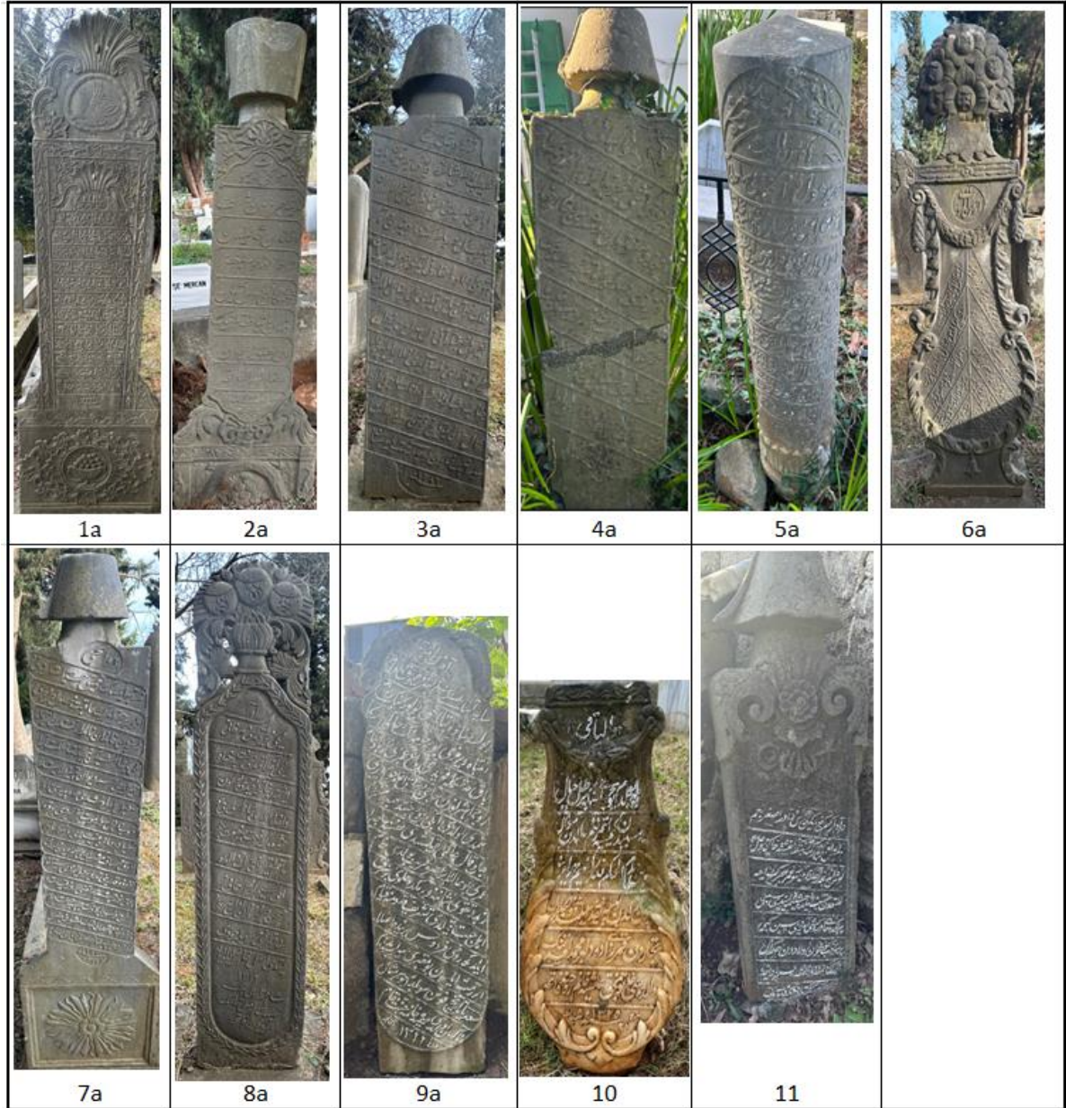
Tablo 1. Başucu Şâhîdeleri

Mezar taşlarının ait olduğu mezarlardan 6'sı (2, 3, 4, 5, 7, 11 16 ) erkek, 5'i (1, 6, 8, 9, 10) kadınlara aittir. 12 numaralı şâhîde ayakucu şâhîdesi olduğu için cinsiyet ve kimlik bilgisi tespit edilememiştir. Bu taşlardan 11'i (1a, 2a, 3a, 4a, 5a, 6a, 7a, 8a, 9a, 10, 11) başucu (Tablo 1), 10'u (1b, 2b, 3b, 4b, 5b, 6b, 7b, 8b, 9b, 12) ayakucu şâhîdesidir (Tablo 2). Kataloglanan ilk 9 mezar hem başucu hem ayakucu taşına şâhîptir. 10 ve 11 numaralı mezarın ayakucu taşı bulunmazken 12 numaralı mezarın başucu şâhîdesi bulunmamaktadır.