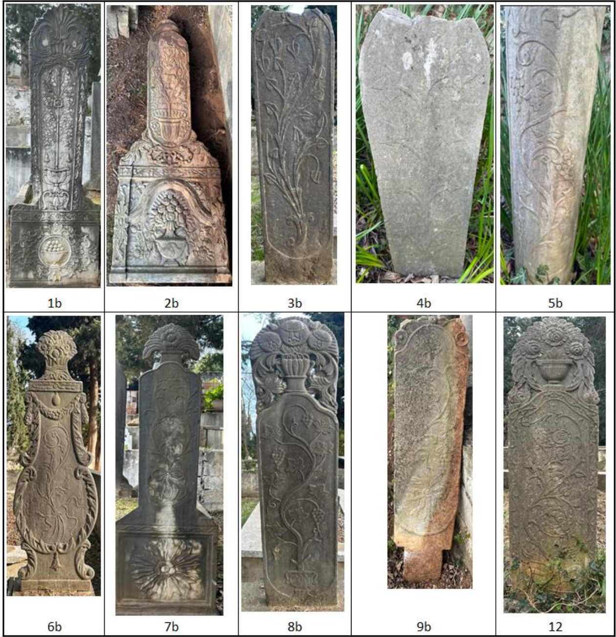
Tablo 2. Ayakucu Şâhîdeleri

Çalışma kapsamındaki şâhîdelerde 3 farklı tip tespit edilmiştir. Bunlardan ilki sandık tipli mezarların başucu ve ayakucu şâhîdelerinde görülen dikdörtgen kesitli lahdin kısa kenarları üzerinde yükselen yekpare blok şeklindeki (1a, 1b, 2a, 2b, 7a, 7b) taşlardır. Bu tipte lâhît kenarının üzerinde yükselen gövde ve başlıklar bulunmaktadır. İkinci tip, düşey dikdörtgen plaka şeklinde uzanan gövde ve başlıklardan ibaret şâhîdelerdir (3a, 3b, 4a, 4b, 8a, 8b, 9a, 9b, 11, 12) ve bu tipte yere gömülen uzantının olduğu uygulamalarla beraber kaide üzerinde yükselen gövdelere de yer verilmiştir. Bu grubun bir alt türü olan şişe görümlü ya da kontrabas adı verilen (Çal, 2015: 308; Grammont & Laqueur & Vatin,