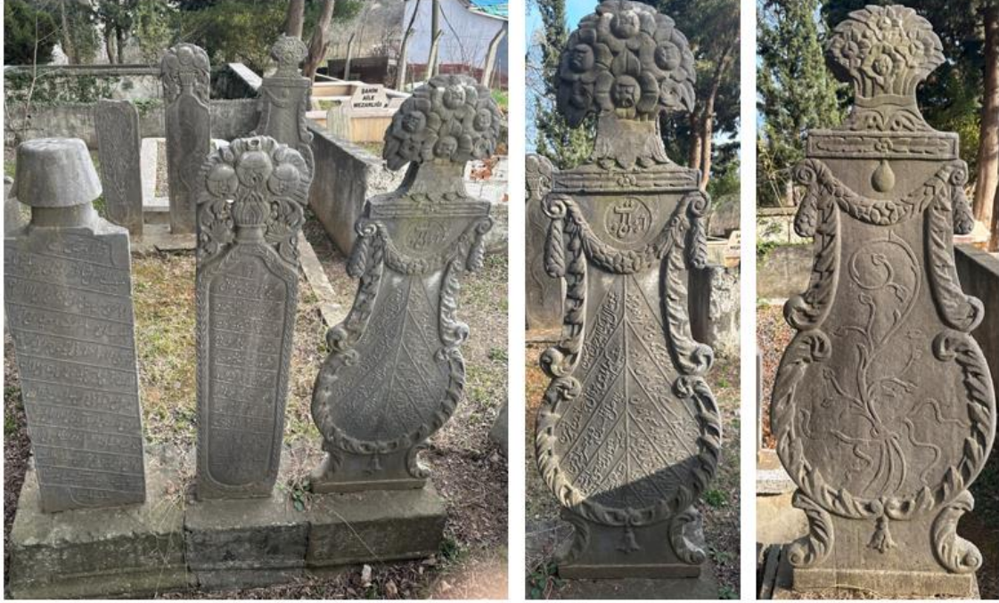
Foto. 29-31. Genel Görünüm / Başucu Şâhîdesi / Ayakucu Şâhîdesi

Ayakucu şâhîdesi (6b) ; mimari form, süsleme ve malzeme açısından diğer şâhîde ile birebir aynıdır. Değişen tek unsur gövdede kullanılan süsleme ayrıntısındadır. Yapraklarla zenginleştirilmiş üç kıvrım dal fiyonk ile birbirine bağlanmıştır ve tüm yüzeye dağılmıştır. (Foto. 31). Gövde üzerine sarkan girland oylumuna gerdanlık hissi uyandıran armutvari bir kabara işlenmiştir (Foto. 33).