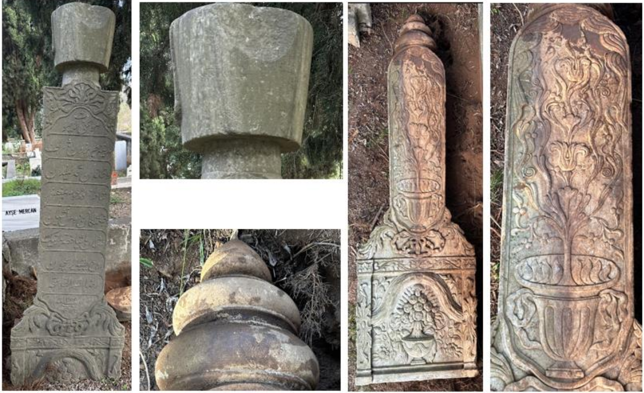
Foto. 14-18. Başucu Şâhîdesi / Başlıklar / Ayakucu Şâhîdesi / Gövde

perde motifi ve püskül ile tezyin edilmiştir. Gövde üzerine aşağıdan yukarıya doğru daralır formda üç boğumlu topuz başlık yerleştirilmiştir (Foto. 16-18).