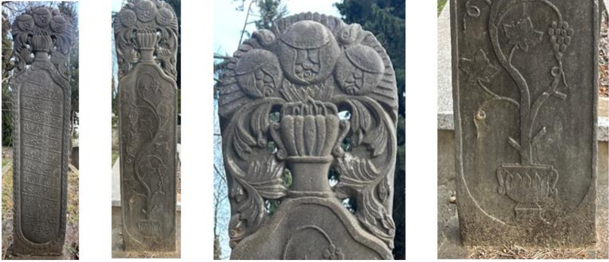
Foto. 37-40. Başucu Şâhîdesi / Ayakucu Şâhîdesi / Başlık / Süslemeden ayrıntı