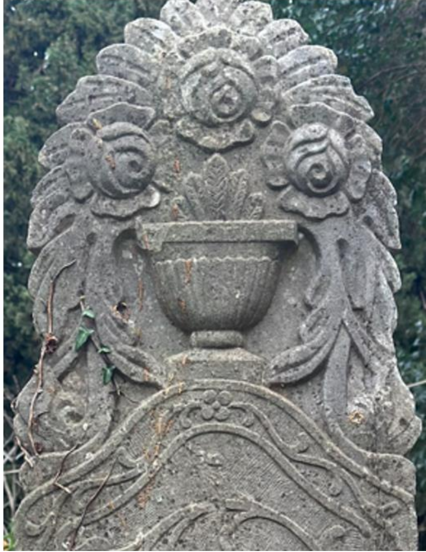
Foto. 47-48. Ayakucu Şâhîdesi / Bitkisel süslemeli başlık