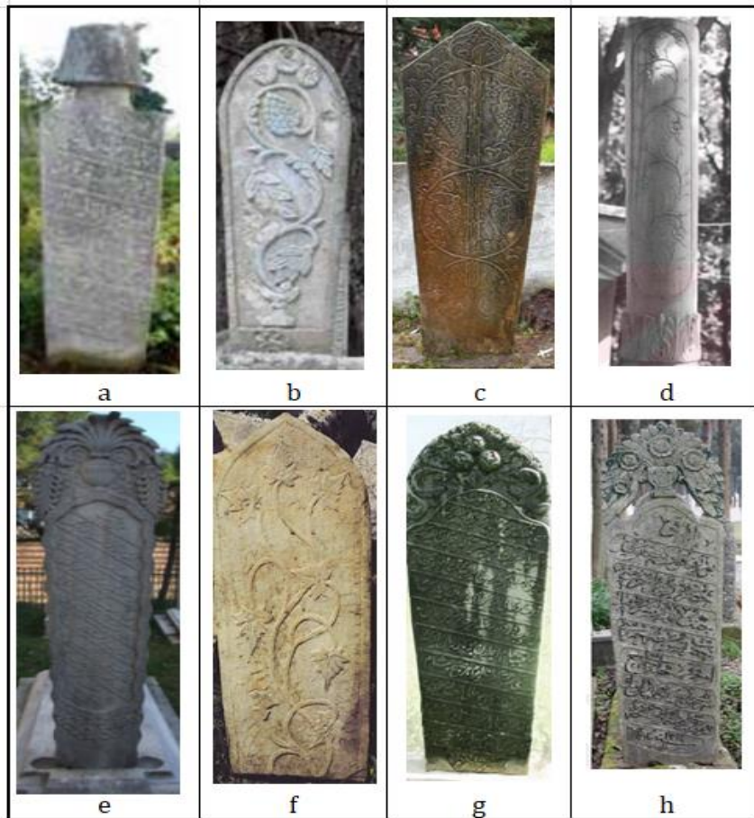
Tablo 3. Anadolu Mezar Taşlarına Örnek 18

Detayları verilen mezar taşları, başta Trabzon'daki diğer hazire ve mezarlıklarda bulunan mezar taşları (Ölçay, 2004; Yer, 2004; Gedikli, 2010; Eren, 2011) olmak üzere Rize (Hanoğlu, 2015), Ordu (Çelik, 2012; Tali 2018: 371-408), Giresun (İltar, 2005), Samsun (Nefes, 2002), Sinop (Yeni, 2009), ve Safranbolu (Biçici, 2008: 297-324) gibi Karadeniz Bölgesi illerindeki mezar taşları ile yakın benzerlikler göstermektedir. Hem form hem de tezyini unsurlarıyla, işleniş tekniği ve motif dağarcığıyla Batılı unsurlarının en kaliteli örneklerinin bulunduğu başkent İstanbul'un (Laqueur, 1997) ve başkent sanatının sıkı takipçileri olan İzmir (Yılmaz, 2013), Aydın (Varol, 2019), Bursa (Çetinaslan, 2014), Antalya (Gedik, 2015), Balıkesir (Gökler, 2017), Konya (Kara & Danışık, 2005) gibi kentlerde olduğu gibi pek çok ilin mezar taşlarıyla da paralellik göstermektedir (Tablo 3).