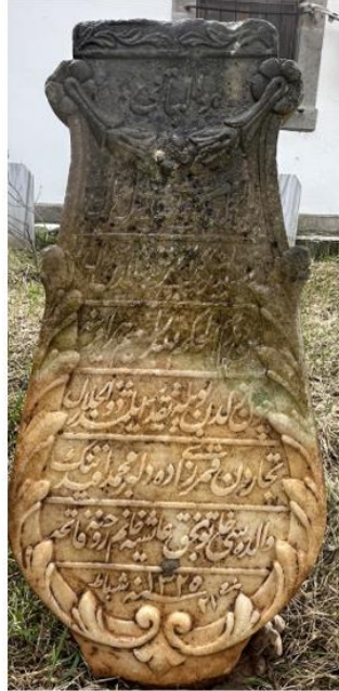
Foto. 43. Başucu Şâhîdesi

Başucu şâhîdesi (10): 35 x 78 cm boyutlara sâhîp mermer şâhîde, yukarıdan aşağıya doğru genişleyen kontrabas formlu tipe uygundur ve günümüzde sadece gövde kısmı bulunmaktadır. Şâhîdenin gövdesi, serlevha ve tarih dışında altı satırlık sülüs kitabeye sâhîptir. Yukarıya doğru daralarak dikdörtgene dönüşen kontrabas hatlı gövdenin etrafı, plastik etkisi yüksek akantlarla sarmalanmıştır. Tam alt kısmında ise kaidenin üzerine sarkar pozisyonda palmet kabartılmıştır. Gövdenin üst kısmına doğru devam eden kabarık akant sarmalı, gövde bitiminde kullanılan gırlanda kadar devam ettirilmiştir. Cepheden kabarık şekilde yansıtılan gırlan, kalın dolgusu ile derin bir etki bırakmaktadır. Gırlanın oylumu, serlevha olarak işlevlendirilmiştir ve "Hüve'l Bâkî" ibaresi hakkedilmiştir. Gövde ile başlık arasında kullanılan yatay bordürü akant yaprakları ile tezyin edilen taş, plastik etkisi yüksek bir işçilik göstermektedir (Foto. 43).