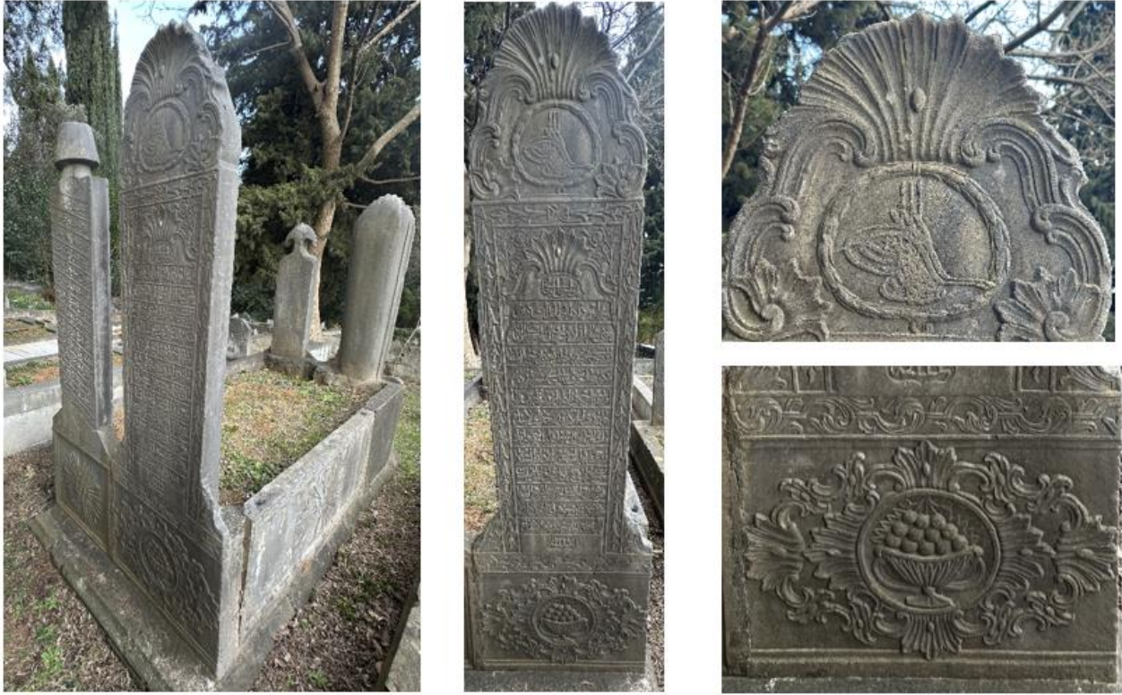
Foto. 6-9. Genel görünüm / Başucu Şâhîdesi / Tepelik / Kaide