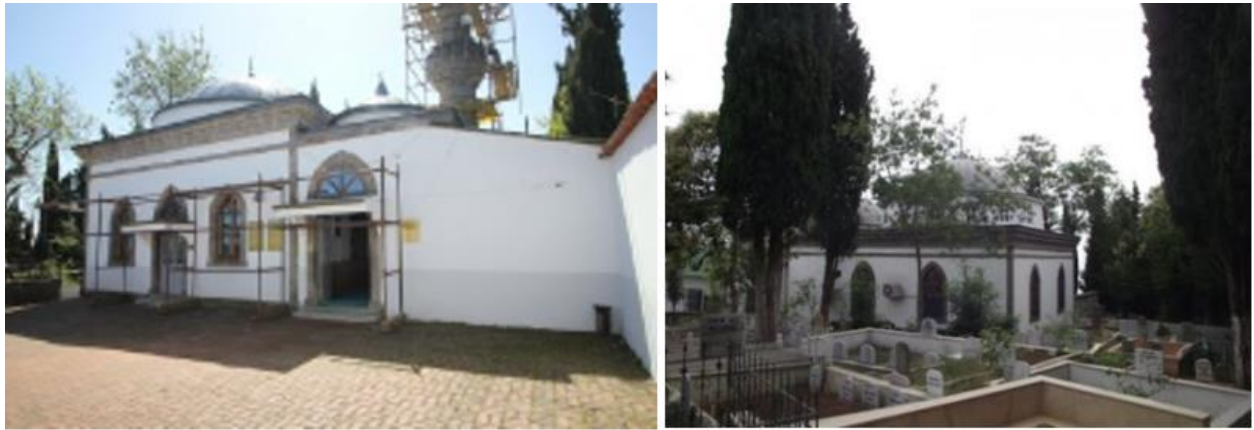
Foto. 2-3. Âhî Evren Dede Camii ve Türbesi

Hazirede bulunan Osmanlı dönemi mezar taşları ile ilgili önceden belirtilmesi gereken en önemli husus, tarih aralığı 1812 ile 1910 arasında değişen taşların bazılarının farklı mezarlıklardan getirilmiş olması ihtimalinin yüksek olmasıdır. Buna dayanak olarak gösterilecek durumlardan birisi hazirenin tarihinin en erken 1860'lı yıllara kadar götürülebilmesi, diğeri ise tarihleri farklı olan mezarların aynı çerçeve içine alınarak mezar taşlarının bu betonarme dolguların üzerine konumlandırılmasıdır. Zira Trabzon