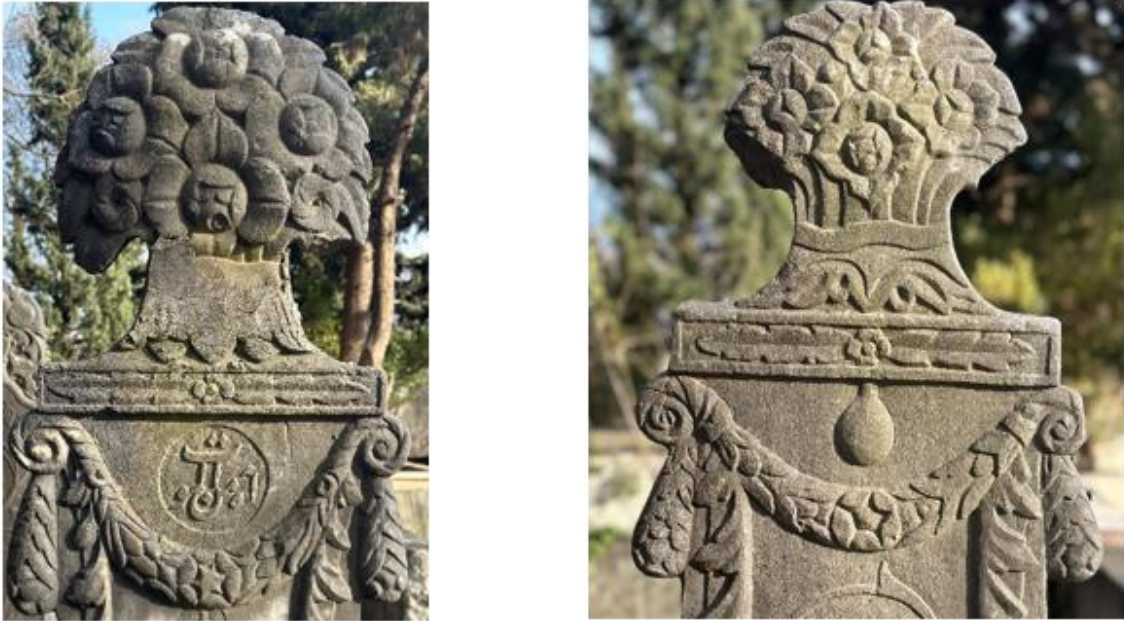
Foto. 32-33. Başucu Şâhîdesi Başlığı/ Ayakucu Şâhîdesi Başlığı