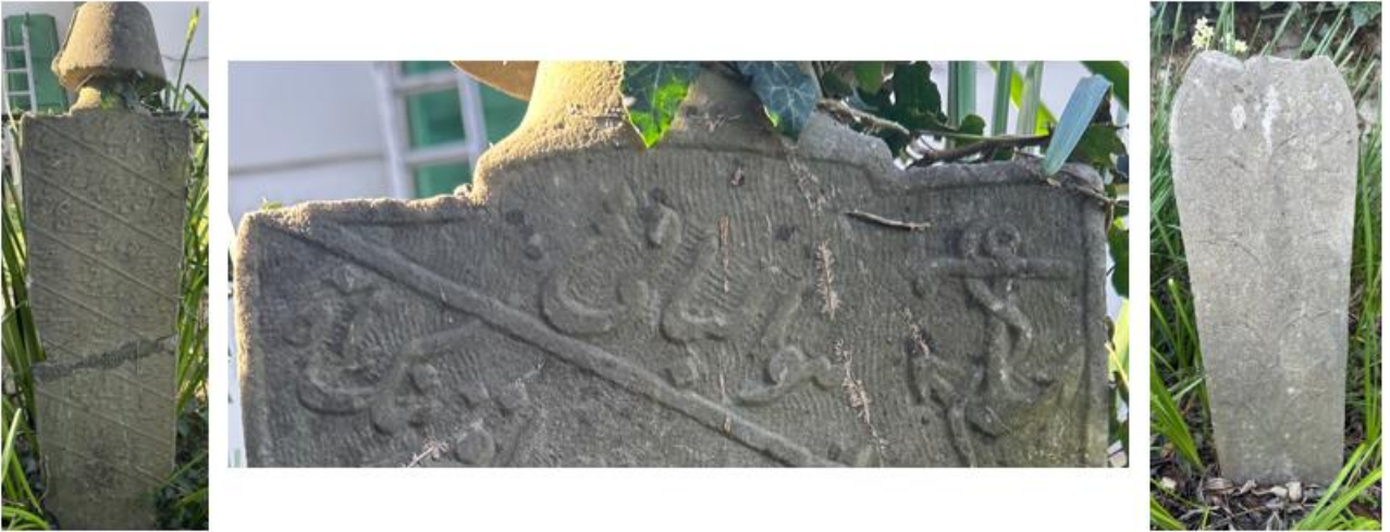
Foto. 23-25. Genel Görünüm / Başucu Şâhîdesi / Ayakucu Şâhîdesi

Ayakucu şâhîdesi (4b) ; 25 x 100 cm ölçülere sâhîp olan mermer taş yuvarlak kemer formudur fakat üst kısmı kırılmıştır. Üzerinde zeminden yukarıya doğru uzanan dallar üzerinde asma yaprakları kabartılmıştır (Foto. 25).