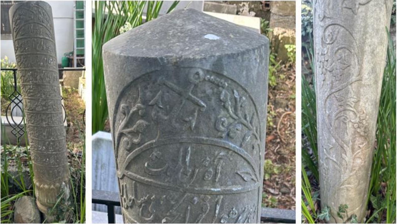
Foto. 26-28. Başucu Şâhîdesi / Ayakucu Şâhîdesi

Ayakucu şâhîdesi (5b); 110 cm uzunluk, 70 cm çapa sâhîp silindirik formlu olan şâhîdenin gövdesinde zeminden yukarıya doğru uzanan dallardan sarkan üzüm salkımları ve asma yaprakları motif olarak tercih edilmiştir (Foto. 28).