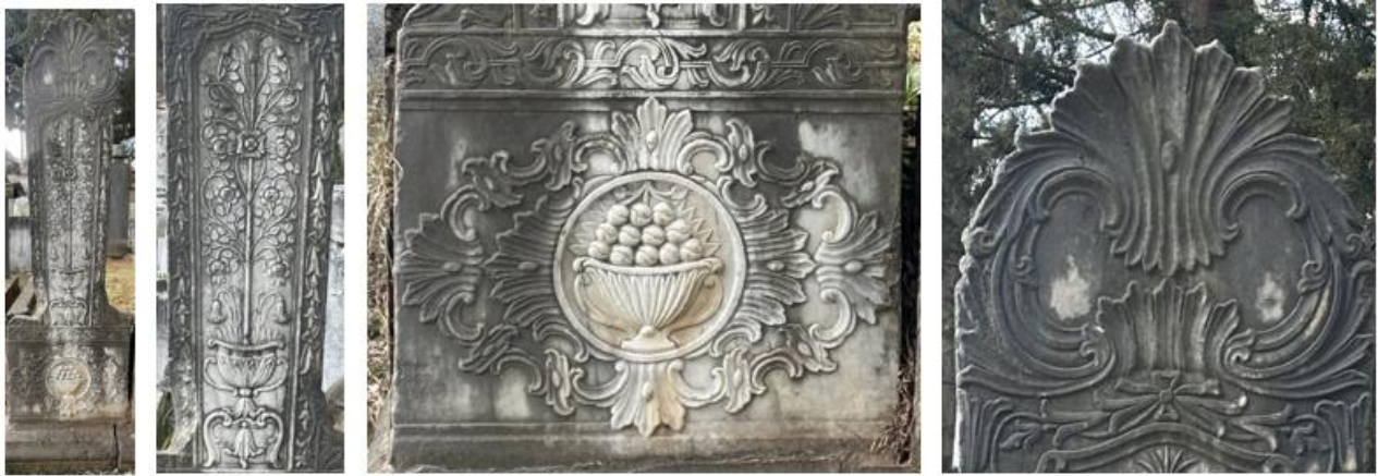
Foto. 10-13. Ayakucu Şâhîdesi / Gövde / Kaide /Tepelik

Ayakucu şâhîdesi (1b) ; 49 x 228 cm boyutlara sâhîp mermer malzemeli taş, kareye yakın dikdörtgen bir kaide (lahdin kısa kenarı) üzerinde yükselen düşey dikdörtgen plaka şeklindedir. Kaidesindeki süsleme başucu şâhîdesinin kaidesindeki süsleme ile birebir aynıdır. Gövdesinde bulunan tezyinat oldukça ince işçiliğin ürünüdür. C kıvrımı şeklinde kıvrılan akant yapraklarının ortasından aşağıya doğru asılan palmet, gövdeyi bütünüyle süsleyen bitkisel tezyinatın başlangıç noktasıdır. Gövdesi yivli, iki yandan kulpları olan vazodan çıkan dal, karanfil, gül ve laleler ile bezenmiş, çiçekler dışında kalan alanlarda ise yapraklara yer verilmiştir. Şâhîdenin tepeliği, başucu şâhîdesi tepeliği ile bütünlük oluşturacak şekilde ortası inci istiridye kabukları, akant yaprakları ve C kıvrımları ile bezenmiştir (Foto. 10-13).