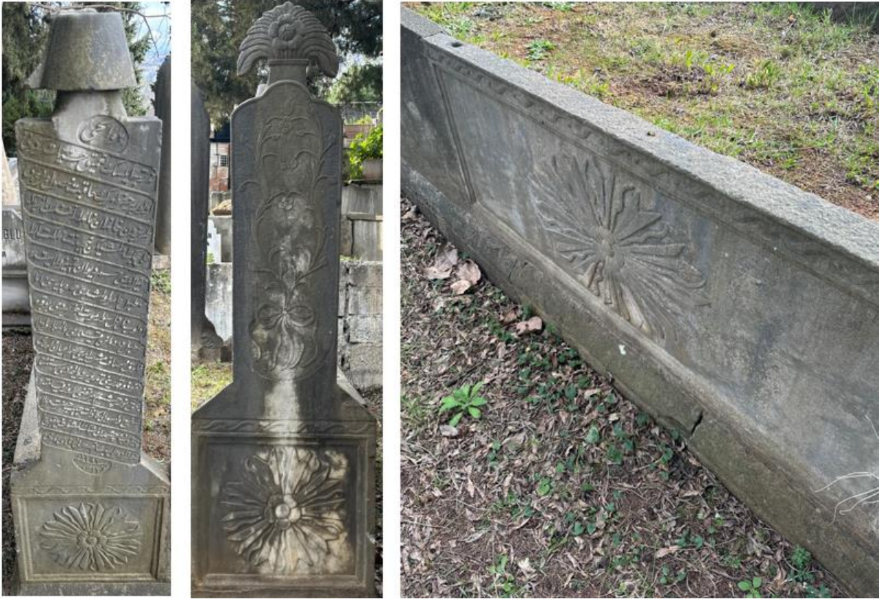
Foto. 34-36. Başucu Şâhîdesi / Ayakucu Şâhîdesi / Lâhît Kenar Bloğu

Lâhît kenar taşları (7c-d) ; yatay dikdörtgen yekpare bloklar, şâhîde kaidelerinin merkezinde bulunan madalyon ve çerçeve oluşturan bordür ile tezyin edilmiştir (Foto. 36).