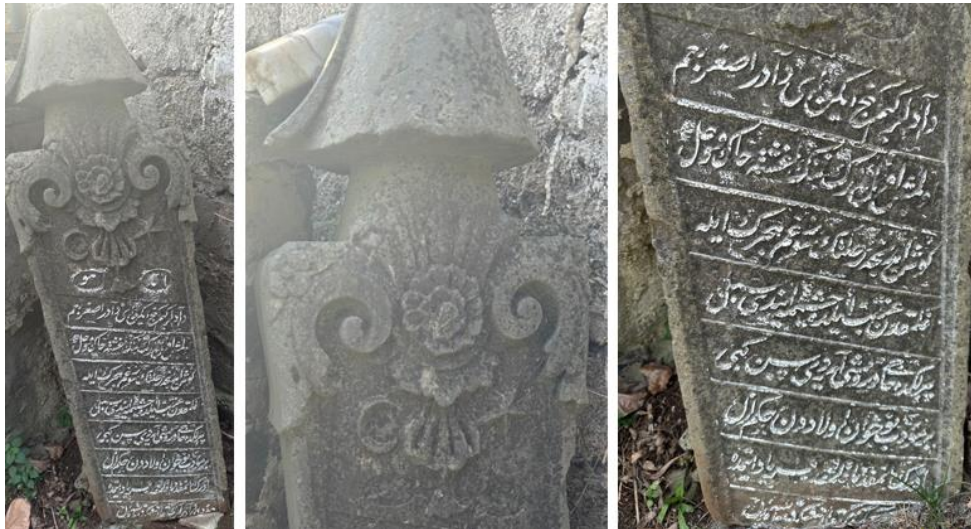
Foto. 44-46. Başucu Şâhîdesi

Başucu şâhîdesi (11); dikdörtgen plaka şeklindeki 35 x 125 cm mermer şâhîdenin gövdesi, serlevha dışında altı satırlık sülüs kitabeye şâhîptir, fakat alt satırda tarihin görülmemesi kırık olan kısımda kitabenin devam ettiği izlenimini vermektedir. Şâhîdenin gövdesinin kitabe üstündeki bölümü süsleme zemini olarak kullanılmıştır. Katmerli çiçek ve çiçeğin altından sarkan püskül ile ay-yıldız motifine yer verilmiştir. Süslemenin kenarları, yaprak sırtlı C kıvrımlarıyla sınırlandırılmıştır. Kısa bir boyun üzerine azizi kalıplı fes başlık yerleştirilmiştir (Foto. 44-46) .