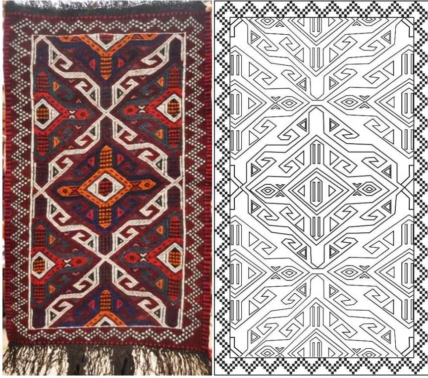
Görsel 5. Seccade Örneği 4 Görseli (Eroğlu, 2013c). Çizim 4. Örnek 4 Yüzey Alan Şeması (Eroğlu, 2014b).