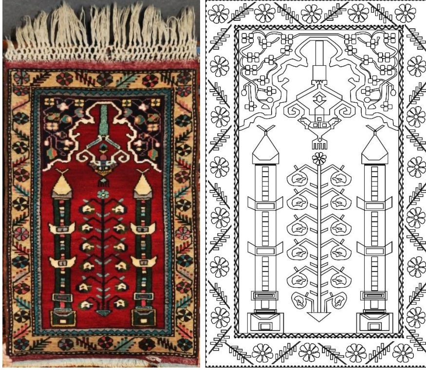
Görsel 10. Seccade Örneği 9 Görseli (Eroğlu, 2014a). Çizim 9. Örnek 9 Yüzey Alan Şeması (Eroğlu, 2014b).