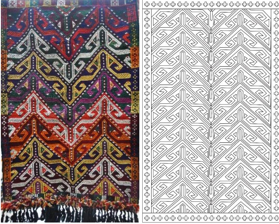
Görsel 4. Seccade Örneği 3 Görseli (Eroğlu, 2013c).