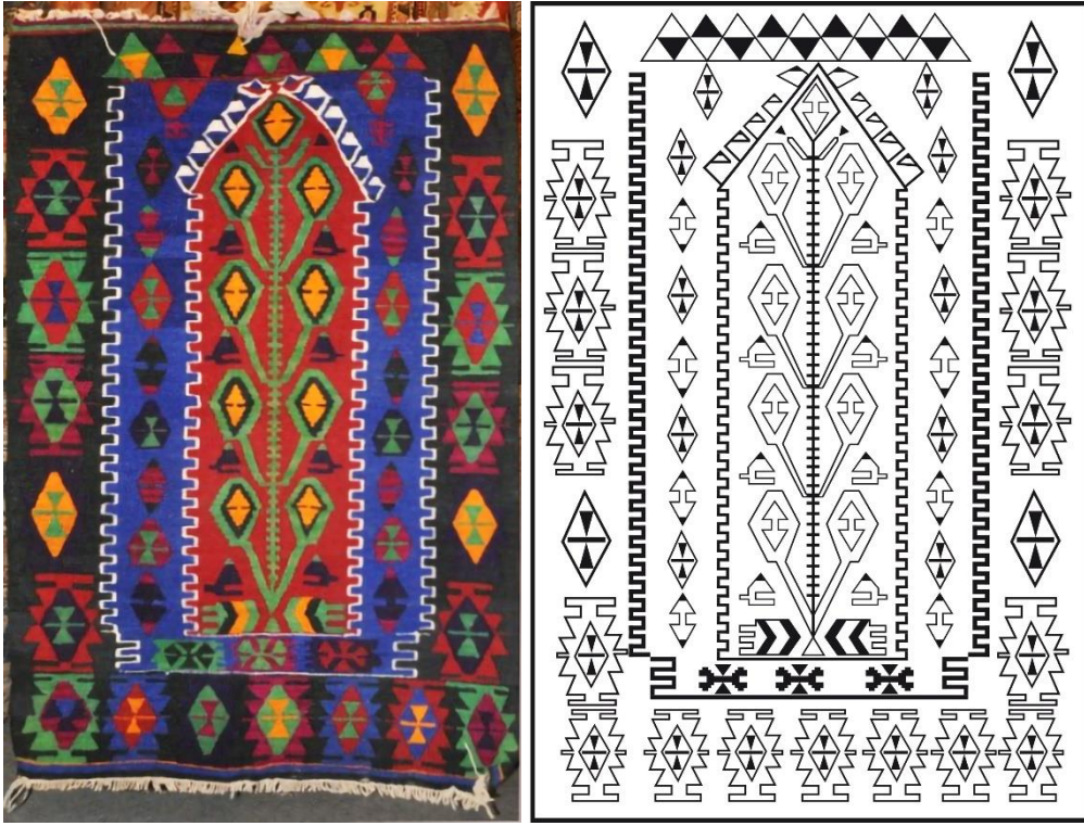
Görsel 9. Seccade Örneği 8 Görseli (Eroğlu, 2014a). Çizim 8. Örnek 8 Yüzey Alan Şeması (Eroğlu, 2014b).