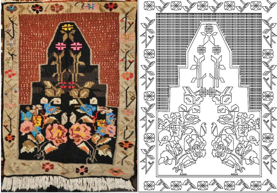
Görsel 8. Seccade Örneği 7 Görseli (Eroğlu, 2013b). Çizim 7. Örnek 7 Yüzey Alan Şeması (Eroğlu, 2014b).