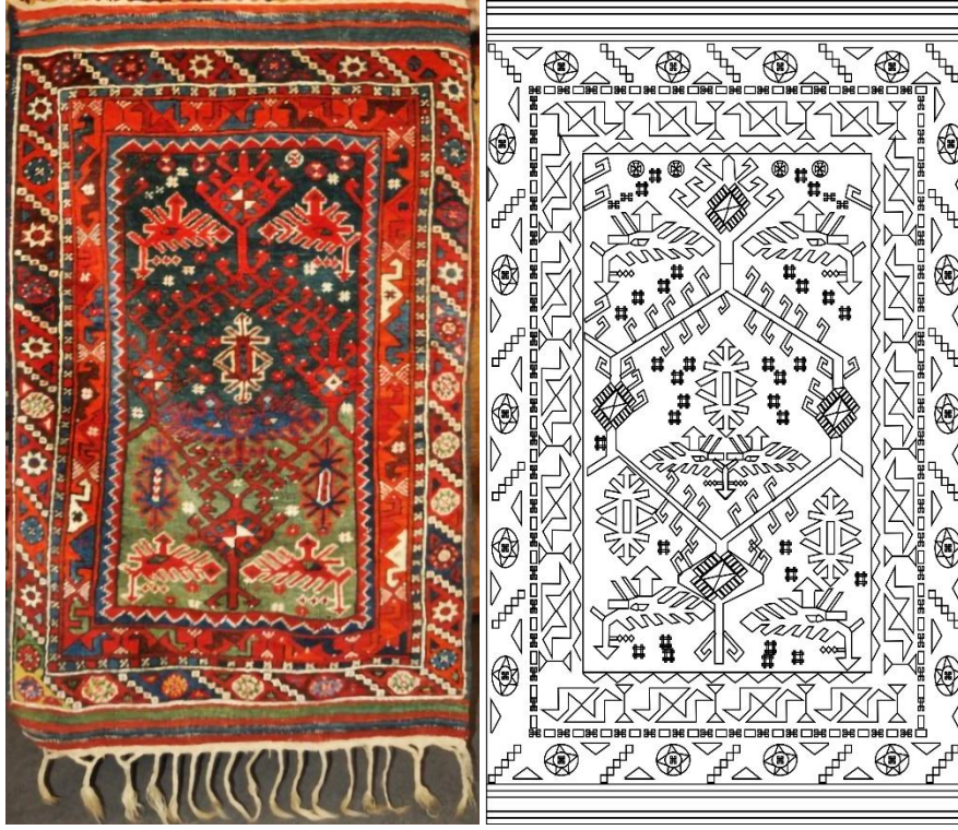
Görsel 7. Seccade Örneği 6 Görseli (Eroğlu, 2013b). Çizim 6. Örnek 6 Yüzey Alan Şeması (Eroğlu, 2014b).