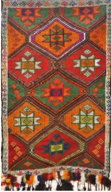
Görsel 2. Seccade Örneği 1 Görseli (Eroğlu, 2013c) .