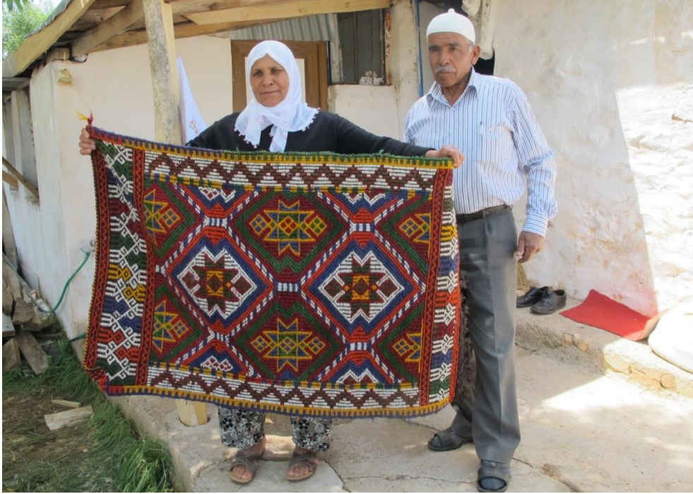
Görsel 1. Tüm Yüzeyin Desenlerle Kaplı Olduğu Seccade Örneği, Sülek/Manavgat (Eroğlu, 2012).

Seccade dokumalarıyla ilgili farklı bölgelerde farklı tarihlerde yapılan alan araştırmaları sonucunda elde edilen görsellerin tümüne bu çalışmada yer verilmemiştir. Yapılan bu araştırmalar içerisinde özellikle Antalya/Kaleiçi bölgesinde, şahısların koleksiyonlarında bulunan seccade dokuma örneklerine yer verilmektedir. Araştırmanın yapıldığı tarihte, koleksiyonda olduğu belirtilen bu seccade örnekleri, kaynak kişilerinde belirttiği üzere; yurtdışına her an satılabilir. Satılma ihtimali olan bu seccade dokuma örneklerinin kataloglanarak gelecek kuşaklara aktarılması amaçlanmıştır.