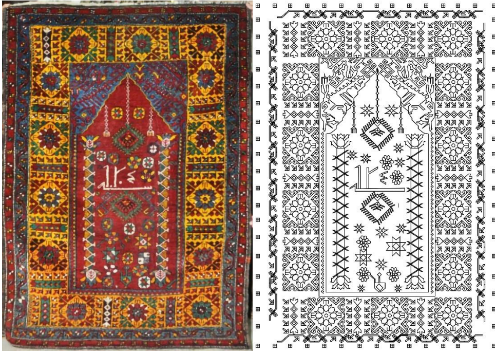
Görsel 6. Seccade Örneği 5 Görseli (Eroğlu, 2013b). Çizim 5. Örnek 5 Yüzey Alan Şeması (Eroğlu, 2014b).