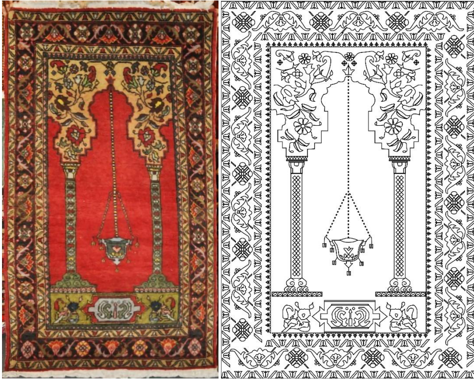
Görsel 11. Seccade Örneği 10 Görseli (Eroğlu, 2014a). Çizim 10. Örnek 10 Yüzey Alan Şeması (Eroğlu, 2014b).