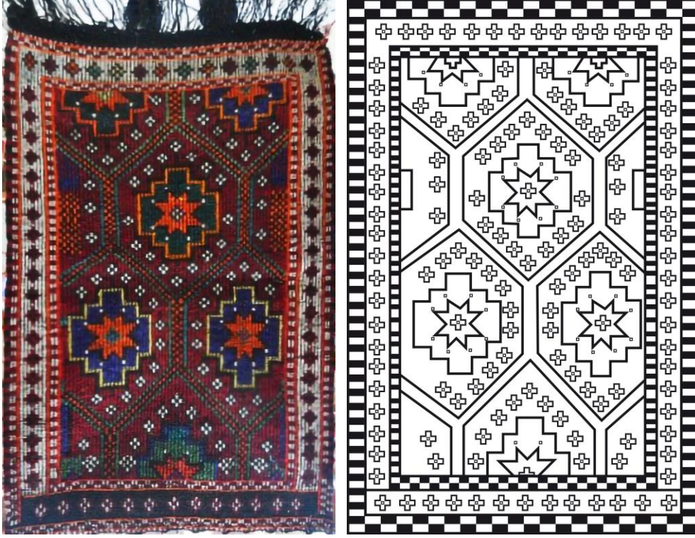
Görsel 3. Seccade Örneği 2 Görseli (Eroğlu, 2013c) .