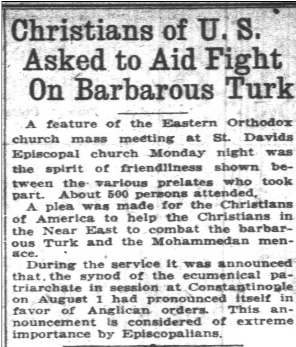
EK-3: “Barbar Türklerle Mücadele için ABD’li Hristiyanlardan Yardım İstediler” başlıklı haber ( The Oregon Daily Journal , 13 Eylül 1922, s. 6.)