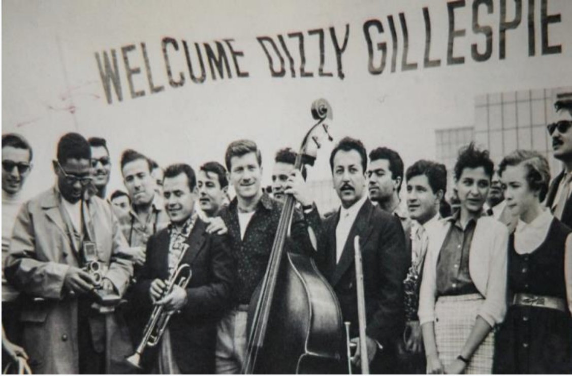
Şekil 1. Ankara Esenboğa Havalimanı'nda Dizzy Gillespie Karşılansması (Seymen, 2016).

informal caz eğitimi almalarının bir yolu da böylece açılmıştır (Uyar, 2016: 57-58). Kıbrıs'tan gelen Dizzy Gillespie Orkestrası Esenboğa Havaalanı'nda Amerikan kolonisi ve caz meraklısı gençlerin taşıdığı Welcome Dizzy Gillespie yazılı pankartla karşılanmış, Gillespie ve arkadaşları, turneleri esnasında ziyaret ettikleri memleketler arasında caza en büyük yakınlık gösteren ülkenin Türkiye olduğunu da söylemiştir. Orkestrayı havaalanında karşılayan bandonun şefi olan trompetist Muvaffak Falay sahneye davet edilmiş ve kendisine Dizzy tarafından gümüş bir tabaka taktim edilmiştir (Dizzy Ankara'da, 1956).