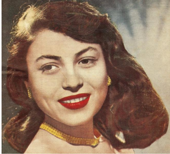
Şekil 4. Ayten Alpman (Ayten Alpman, 2012).

1930 yılında dünyaya gelen Ayten Alpman'nın profesyonel bir biçimde şarkı söylemeye başlaması 1949 yılında İstanbul Radyosu'nun açılışıyla birlikte olmuş, 1959 yılında ilk taş plağı çıkmış, 2012 yılında ise vefat etmiştir.