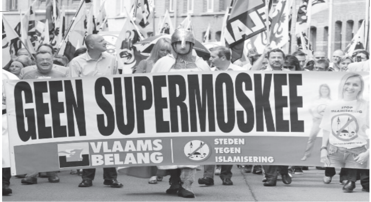
Şekil 1 Vlaams Belang Sempatizanlarından İslam Karşıtı (Camiye İzin Yok) Bir Pankart (Parijs, 2022)

list partilerin aldıkları en yüksek oy oranlarının 2001 sonrasına denk düşmesiyle tutarlılık göstermektedir.