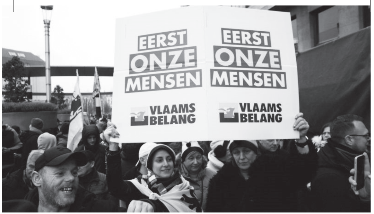
Photo: Sağcı ve aşırı sağ Flaman derneklerinin protestocuları, Belçika'nın Brüksel kentinde BM Göç Pakti'na karşı düzenlenen bir protesto sırasında yürüyor.