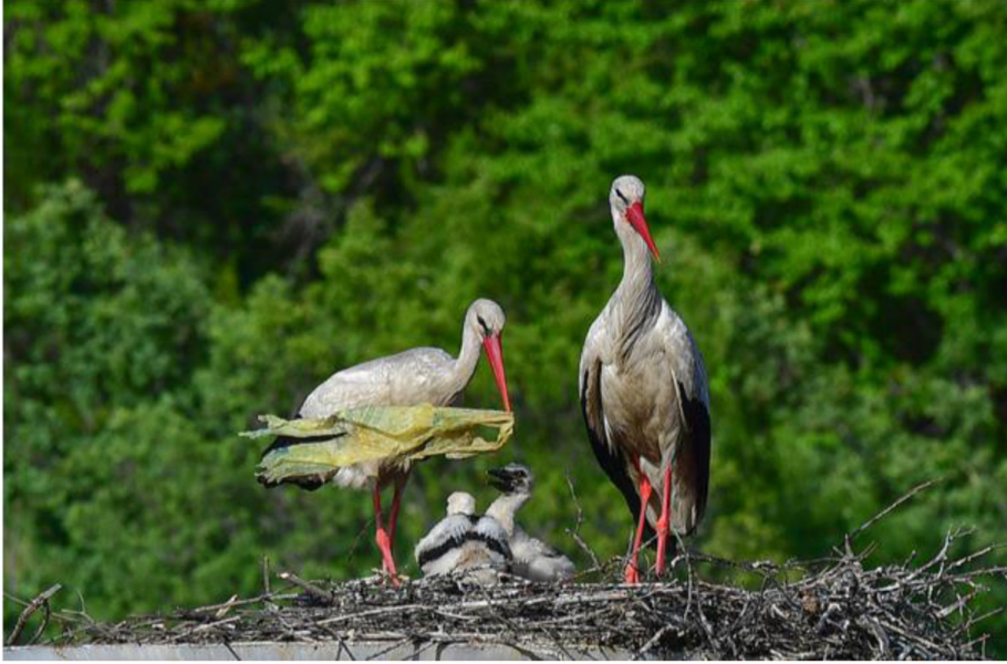
Tablo 5. Selahattin Sönmez-“Sıfır Atık Özel Ödülü”