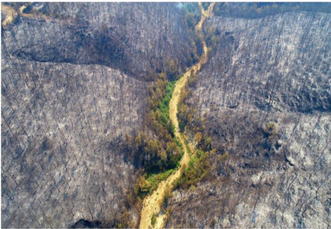
Tablo 4. Umutcan İşledici-“Yılın Çevre ve Doğa Fotoğrafi”

Sıfır atık özel ödülü alan Tablo 5’teki fotoğraf, çevreye atılan atıkların diğer canlıların hayatlarını nasıl etkilediğini açıkça belgelemektedir. Fotoğraf çerçevesinin tamamının konu ve konuyu destekleyen öge ve renklerle doldurulduğu görülmektedir. Her bir ögenin fotoğrafa bir katkı sunduğu görselde arka fondaki yeşil renk doğanın canlılığına, kuşların yuvalarında yer alan grilik, ölü dalların yeniden doğal kullanımına işaretler. Yeşil/canlı ile Gri/cansız arasında aile kuran leylekler doğanın dengesini göstermektedir.