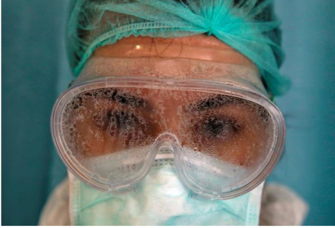
Tablo 3. Ümit Bektaş-“Yılın Pandemi Fotoğrafi Ödülü”