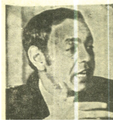
Yeniden Milli Mücadele

Dergide, Sovyetler Etiyopya'yı desteklerken ABD ise Eritreli isyancıları destekleyerek kıtada vekalet savaşı yürüttüğü kaydedilmiştir. Burada konu ile ilgili haberin "İslam Dünyası" başlığı altında verilmesi, Etiyopya rejimini Marksist olarak nitelendirilmesi ve Eritre'de 3,5 milyon insanın soykırım ile karşı karşıya olduğunun belirtilmesi dikkat çekmektedir (Yeniden Millî Mücadele, 1980:11).