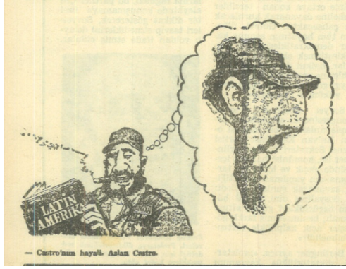
Milli Mücadele Dergisi