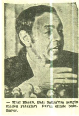
Yeniden Milli Mücadele - 10. Cilt 484. Sayı, s.2

Batı Sahra sorunun yanı sıra Cezayir ile Tunus arasında yaşanan kriz de dergi yayınına yansımıştır. Cezayir'den Tunus'a geçen yaklaşık 300 kişilik silahlı grubun 41 kişinin ölümüne ve 111 kişinin de yaralanmasına neden olduğu kaydedilerek saldırıdan önce Cezayir'i suçlayan Tunus yönetimi, saldırganların sorgulanmasından sonra saldırının arkasında Libya olduğu tespit etmiş ve iki ülke arasında siyasi gerginlik yaşanmıştır. Bu kriz üzerine Fransa'nın Tunus'a 2 helikopter, 2 nakliye uçağı ve paraşütçüler gönderdiği ve bu yolla Tunus karasularını güven altına almak bahanesiyle savaş gemilerini bölgede konuşlandırdığının altı çizilmiştir. Aynı şekilde Fas kralı 2. Hasan'ın da Tunus'a askeri yardım yaptığı yazılmıştır. Libya'ya ise Doğu Almanya'dan destek geldiği ve güneydeki kamplarda komşu ülkelerden gelenlerin Almanların gözetiminde eğitildiği kaydedilmiştir. Öte yandan Libya ve Cezayir'in Sovyetlerden de destek aldığı belirtilmiştir.