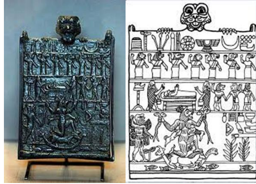
Resim 4: Pazuzu'nun tuttuğu Lamaštu'ya karşı korumayı tasvir eden levha. 36

Lamaštu'nun toplumsal düzeni sağlamadaki ironik rolü ise onun nüfus artışının neden olabileceği sistem bozukluklarına karşı yeni doğumlara engel olması için sistemin içine dâhil edilme ihtimalidir. Şeytani varlığa karşı tasarlanan büyülerde genellikle onun bebekleri kendi göğsünde emzirme arzusundan bahsedilir, ancak sütü zehir ve hastalık taşır. Özünde, Lamaštu annelik kavramının tersine çevrilmesini, doğal düzenin açık bir sapkınlığını temsil ediyor gibi algılansa da bu yansımanın nüfus kontrolü gibi farklı bir anlamı olduğu da düşünülebilir. Bunun en belirgin görüldüğü metin Mezopotamya'nın tufan hikâyelerinden biri olan MÖ 2. binyılın başlarına ait Akad miti Atrahasis'de karşımıza çıkmaktadır. Tanrıların Lamaštu'yu kontrolsüz nüfus artışına karşı yerleşik bir kontrol önlemi olarak nasıl kurduklarını anlatır Atrahasis mitine göre insanlar yaratıldıktan sonra gürültü o kadar artar ki, Enlil uykusunda rahatsız olur ve bu da onu, insanlığı kırbaçlayan bir tufan yaratmaya ve radikal önlemler almaya zorlar. Tufandan sonra insan kozmosu, tufana yol açan olayların tekrarlanmasını önlemek için daha az liberal bir temelde yeniden düzenlenir. Nüfus artışını kontrol altında tutmak için bazı kadın türlerinin çocuk doğurmasına izin verilmez ve yok edici Pāšittu (Lamaštu'nun diğer bir adı), "bebeği onu doğuran kadının kucağından almak" için çağrılır. Bu bağlamda Lamaštu'nun ilahi düzenin bir parçası olduğu çok açıktır ve masum varlıkları öldürür çünkü onlar fazladır. Bu da Lamaštu'nun