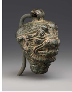
Resim 2: Pazuzu Kafası Tasvirli Kolye. 18

Pazuzu'nun temsilinin yer aldığı kötü güçlere karşı kullanıldığı düşünülen pek çok koruyucu muska ortaya çıkartılmıştır. Bu muskalar oldukça çeşitli boyutlarda ve yerlerde koruyucu niteliğiyle ön plana çıkmıştır (Resim 2). Hastalığın demonların sebep olduğu kötülükler olarak görüldüğü Antik Mezopotamya'da tedavi ritüellerinde dahi bu demonun tasvirlerine ve büyü metinlerindeki kullanımına rastlanmıştır. Bu muskaların bazıları takı olabilecek kadar küçük ve kişisel iken bazıları ise metal ya da taştan yapılmış ve belirli bir alanı korumak amaçlı duvara asılmış bir şekilde koruyucu güç olarak karşımıza çıkmaktadır 17 .