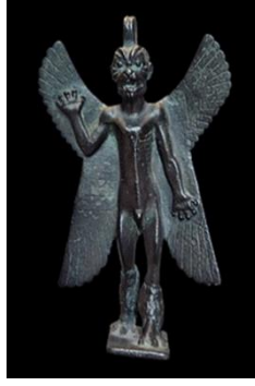
Resim 1: Pazuzu Heykelciği. 14

güçlerden ayıran en önemli özelliği olmuştur. Bu demona ait en eski görsel kanıtlar MÖ 8. yüzyılın sonlarına doğru Nimrud'daki kraliyet mezarlarından ortaya çıkarılmıştır, ancak onu betimleyen pek çok nesne 7. veya 6. yüzyıla aittir. 12 En iyi bilinen tasvirlerinden bir bronz heykelcikte Pazuzu köpek surati, çenesi ve dişleri, patlak gözleri, boynuzları, pullu gövdesi, kuş pençeleri, devasa kanatları, akrep kuyruğu ve dik yılan penisi ile tasvir edilmiştir. 13 Çok sayıda insan ve hayvan bedeni parçasının karmaşık bir aktarımını içeren bu heykelcik onun tam gelişmiş ikonografik profili olarak adlandırılabilen bir örnektir (Resim 1).