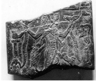
Resim 3: Lamaštu Levhası 24

Bu karşı önlemler arkeolojik kayıtlarda da izlerini bırakmış, yazılı ve figüratif kaynaklar sayesinde dişi şeytanın profili yeniden inşa edilebilmiştir (resim 3).