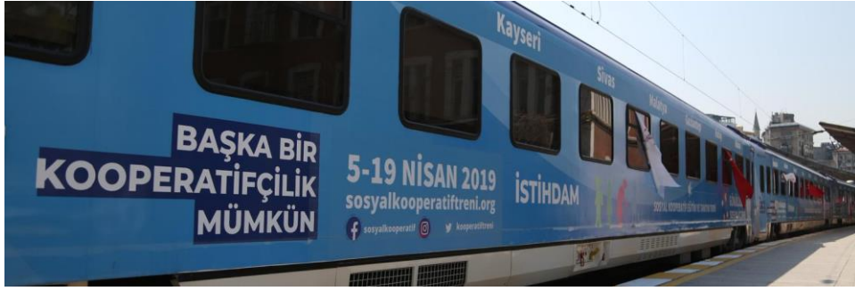
Resim 1: Sosyal Kooperatif Eğitim ve Tanıtım Treni