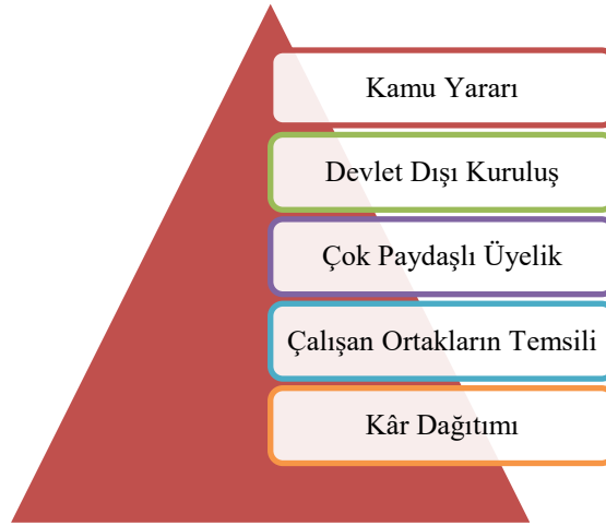
Şekil 2: Sosyal Kooperatiflerin Ayırt Edici Temel Özellikleri

Sosyal kooperatifler, kooperatif hareketinin insanların ortaya çıkan ihtiyaçlarına yanıt verdiği ana tepkilerden biridir (CICOPA, 2004: 1) ve diğer kooperatif türleri gibi demokrasi ve dayanışma ilkelerine uyan ortaklara ait kooperatiflerdir (Carini ve Costa, 2013: 4). Sosyal kooperatifler, kooperatiflerin uluslararası kabul görmüş tanımına, değerlerine ve ilkelerine sıkı sıkıya bağlı olmakla birlikte ayrıca kendine özgü ayırt edici kriterleri vardır (CICOPA, 2004: 1). Bu özelliklerin neler olduğu aşağıda açıklanmaktadır.