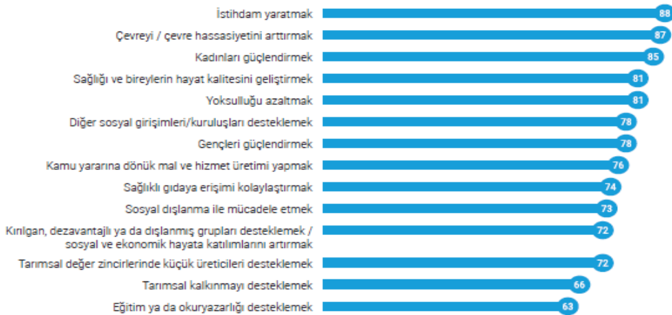
Resim 2: Sosyal Kooperatiflerin Kuruluş Amacı

Teorik çerçeveden hareketle Türkiye'deki sosyal kooperatifler, toplumsal olayların, ekonomik ve sosyal sorunların çözümünde ve değişiminde aktif rol oynayan alternatif bir modelidir. İhtiyaç Haritası (2020: 12)'nin sosyal kooperatif ihtiyaç analizi raporunda, 144 katılımcının sosyal kooperatiflerin kuruluş amaçlarını toplumsal bir ihtiyacı karşılamaya dönük şekilde yanıt verdiği görülmüştür. Dolayısıyla sosyal kooperatifler bulunduğu toplumun yaşamında hem sosyal hem de ekonomik açıdan katkıda bulunmakta ve aynı zamanda hedef kitlesinin iyileşmesi ve gelişmesinde önemli rol üstlendiği görülmektedir.