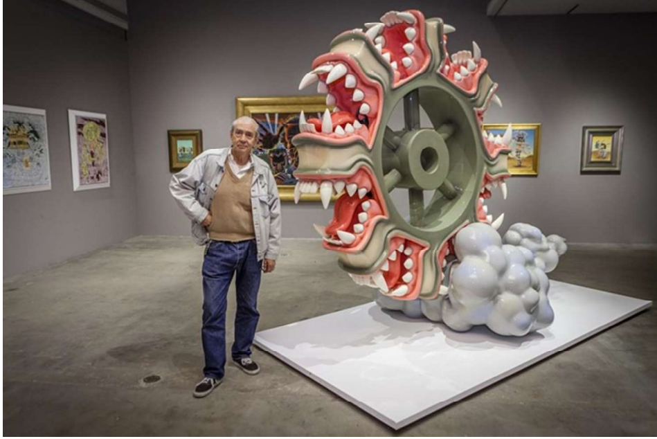
Görsel 3: Robert Williams L.A. Municipal Art Gallery'deki "Robt. Williams: Slang Aesthetics" adlı Sergisindeki eseri "Açgözlü Tekerlek" ile birlikte, 2015

Günümüzde Lowbrow sanatçılar artık en ünlü galeriler ve müzeler tarafından kabul edilmektedir. Bunun nedenlerinden biri artık bu sanat anlayışının tüm dünyada tanınıyor olmasıdır. Akım Amerika'dan Japonya'ya kadar sanatçı kitlesine erişmiştir. Robert Williams da artık bir zamanlar soyut resimleri sergileyen ve birçok açıdan eleştirdiği galeri ve müzelerde çalışmalarını sergilemeye başlamıştır. Williams, "Robt. Williams: Slang Aesthetics" adlı sergisini 2015'ten beri Amerika'daki farklı birçok galeri ve müzede sergilemiştir. Bu sergiler sanatçının bugüne kadar yaptığı eserlerin bir retrospektifi niteliğindedir.