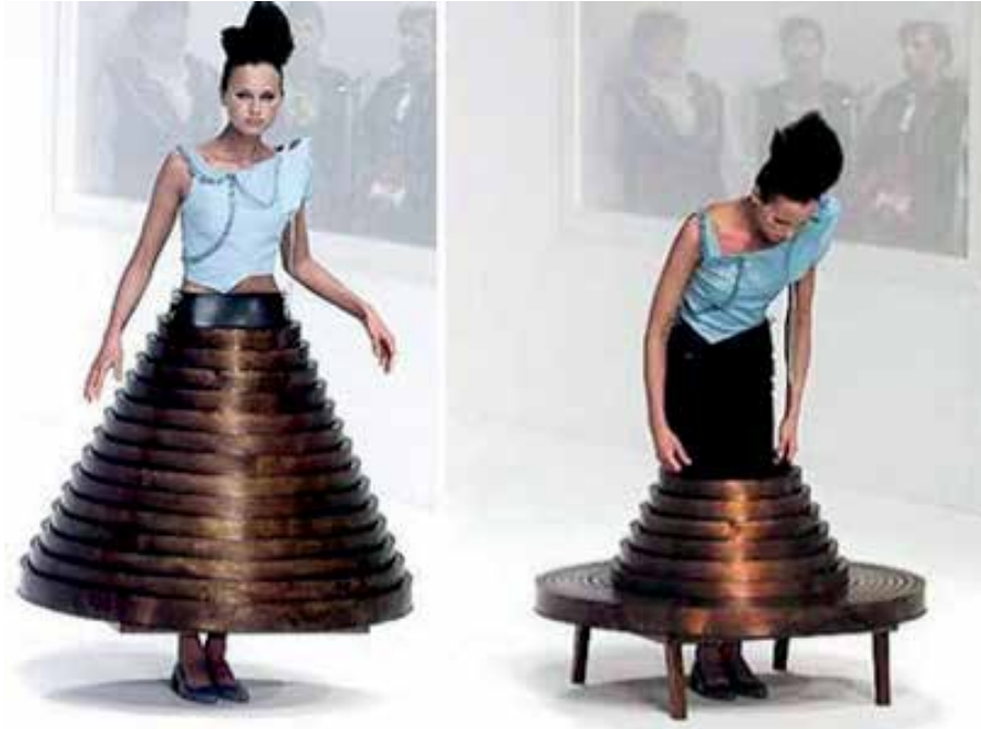
Resim 17. Tabure Etek, Hüseyin Çağlayan Koleksiyonu. ( www.huseinchalayan.com/ Erişim Tarihi: 28.10.2012)

Hüseyin Çağlayan’ın uçak elbise tasarımı ilk defa 2000 yılında fiberglas ve reçineden oluşturulan bir kompozit malzemeden kalıp döküm yöntemiyle imal edilmiştir (Resim 18).