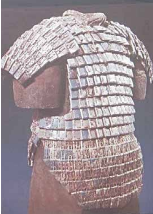
Resim 52. Çin İmparatoru Qin Shi Huangdi Zırhı, MÖ 210, 1999'da Rekonstrüksiyonu Yapılmış, (British Museum, Fotoğraf:Ezgi Martinez, 2012)