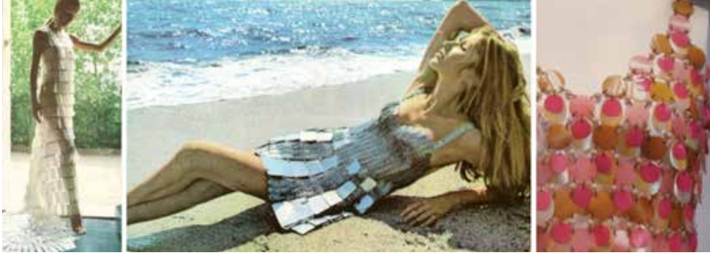
Resim 5. Paco Rabanne, Sedefli Plastik Elbise, 1967.