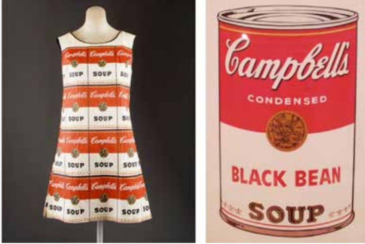
Resim 9. Atık çorba ambalajı ile yapılmış pop art elbise, siyah kırmızı varak 1966-67. ( http://www.metmuseum.org/toah/hd/cost/hd_cost.htm/ Erişim Tarihi: 28.07.2012)

bu reklam ikonu sayesinde günlük yaşam, sanat ve moda arasındaki bağı açığa çıkarmıştır ( http://www.metmuseum.org/toah/hd/cost/hd_cost.htm/ Erişim Tarihi: 28.07.2012) (Resim 9).