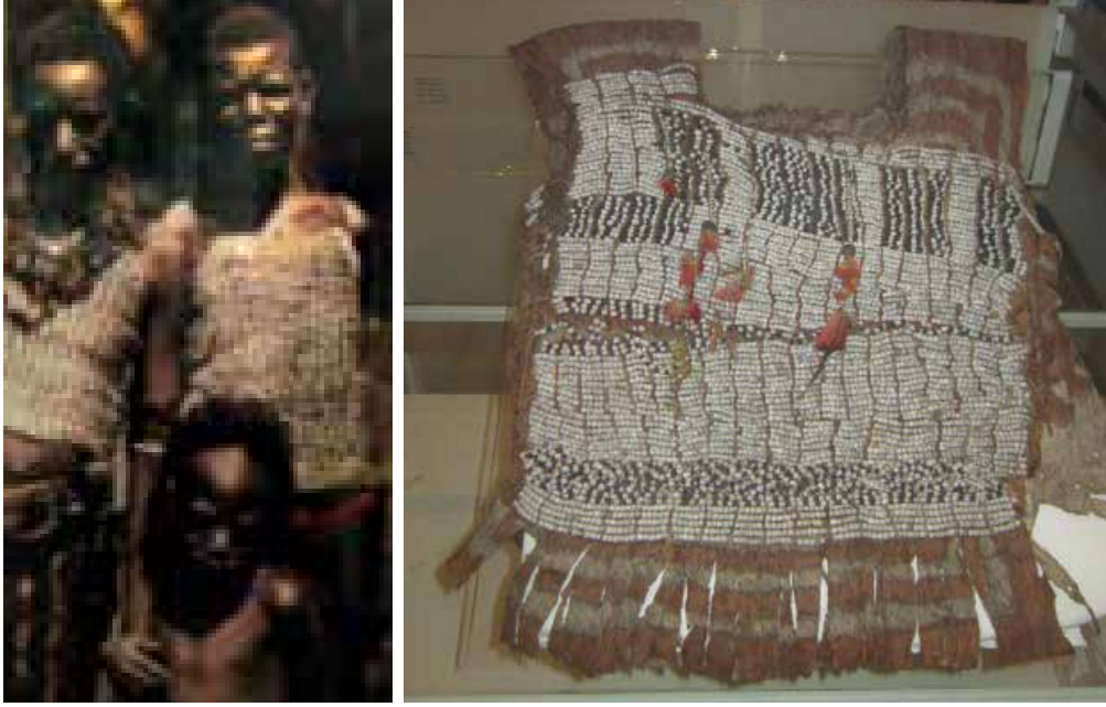
Resim 1-2. Papua Yeni Gine'de Kadınların Gri Kilden Yapılmış Matem Kıyafetleri. (British Museum, 2012 Ağustos, Fotoğraf: Ezgi Martinez)

tem elbiseleri de kullanılmıştır. Bu kil tabakası kurduğunda, eşinin yasını tutan kadın artık bir başkasıyla evlenebilmektedir.