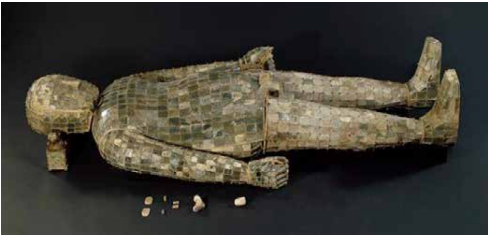
Resim 3. Prens Liu Sheng'in Gömü Kıyafeti, MÖ 113. (British Museum, 2012 Ağustos)

Toplumlar hakkında fikir edinilmesini sağlayan giyim kuşam objeleri bazı kültürlerde ölüm sonrası için de kullanılmaktadır. Çinde mezar için hazırlanan özel kostümler, toprak altında çürümeyi engelleme isteminin dışında, aynı zamanda kişinin ölmeden önceki yaşamı hakkında da bilgi vermektedir. Örneğin MÖ 113'te ölen ve yaşamında keyfine düşkün Prens Liu Sheng'in gömü kıyafeti, 2498 parça disk biçiminde yeşim taşından oluşturulmuştur. Altın gümüş ipliklerle dikilmiş ve yapımı 10 yıl sürmüş olan kıyafet bedeni tamamen kaplayacak biçimde dikilmiştir.