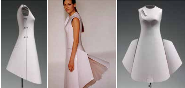
Resim 18-19-20. Hüseyin Çağlayan Uçak Elbise, 2000-06, fiberglas, metal ( http://www.metmuseum.org/toah/works-of-art/2006.251a-c/ Erişim Tarihi: 13.09.2012)