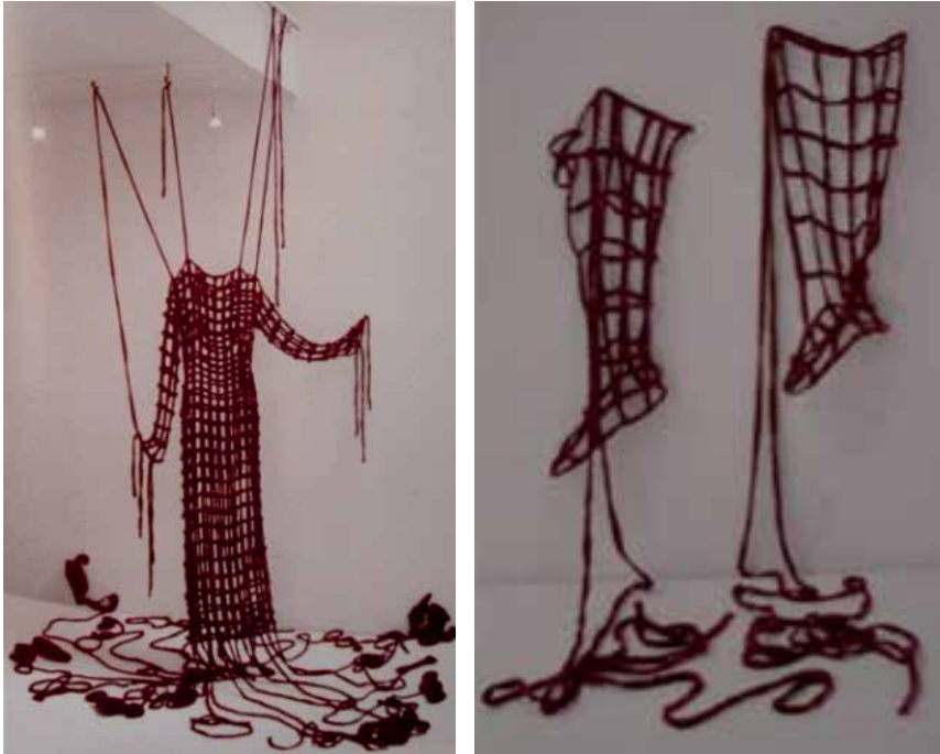
Resim 15-16. Gudrun Kamps, Enstelasyon, 1999. (Springer, 2009: 229)

Giyim görsel özelliği dışında aynı zamanda da dokunsal ve duyuşsal bir deneyimdir. Moda tasarımcısı da bunu göz önünde bulundurarak ortaya çıkacak koleksiyonun tüm duyuşsal etkilerini göz önünde bulundurarak hazırlamalıdır. Farklı malzemeler farklı duyuşsal etkilere ve algılara neden olduğundan verilmek istenen mesaj için seçilen malzeme önem arzeder. Örneğin ağ, hasır gibi geçmeli ya da birbirine takılarak örülen malzemeler kısmen saydam dokulara dönüş-