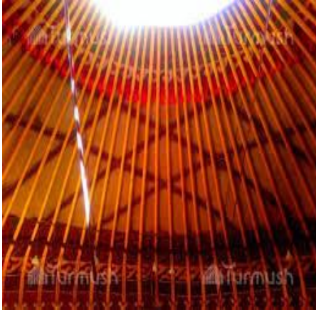
7. Boz üyün uuk kısmı.