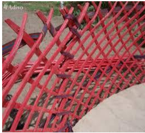
8. Boz üyün kerege kısmı.

“Çapanda bir acıdaar bilesinbi, canı çok kıymılđoogo denesinde, içinde sööktörü bakça-bakça, caltıldayt calgız közü töböşündö.” (Bozkırda bir ejderha bilir misin, canı yok vücudunda kıılmıdamaz, içinde kemikleri parça parça, parlıyor tek bir gözü tepesinde) diyerek bilmede de boz üye yer vermişler.