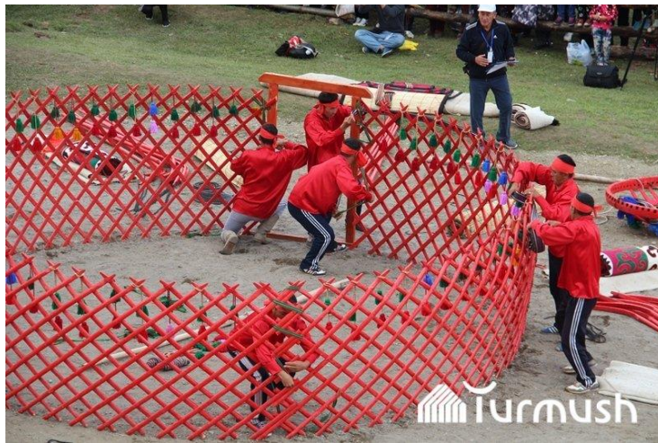
6. Boz üyün kerege kısmı

Kırgızlarda asla boz üyün keregesine 3 insan ayakları asılmaz, tündüğün ipine ağırlık verilerek çekilmez, eşğin üzerinde durulmaz, girerken ya da çıkarken eşğe basılmaz, atlayarak çıkmak gerekir, kapı ayakla açılmaz. Bütün bunlar evin koruyucu ruhu ile ilgilidir. Evin koruyucu ruhları eşikte oturur, üzerine basarsa incinir inancı vardır. Ateş suyla söndürülmez, ateşe tükürülmez, külün üzerine basılmaz, geceyin külü dışarı çıkarılmaz (Akmataliyev, 2011:138) gibi ateşle ilgili inanış ve uygulamaları doğrudan ateş kültü ile ilişkilendirebiliriz.