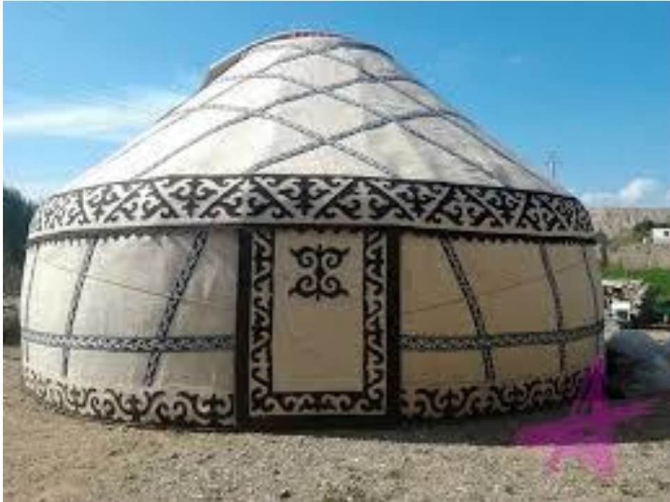
10.Boz üyün genel görüntüsü

Evin direği çatıdır, ailenin direği babadır. Dolayısıyla bu beddua aile direği olan baban ölsün anlamına da gelmektedir.