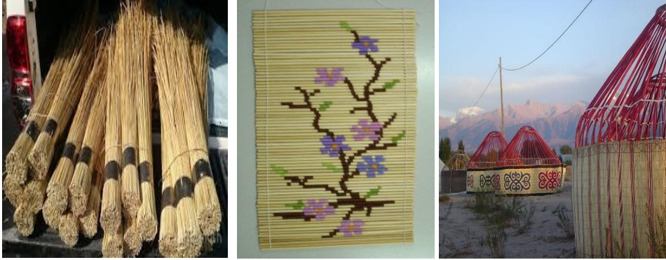
2.Hasır yapılacak sert gövdeli ot 3. Süslenerek yapılmış hasır 4. Kerege için hazırlanmış hasırlar

Boz üyün önemli kısımlarında biri de çiy adını verdikleri yüksek boylu sert otlardan örülen hasırlardır.