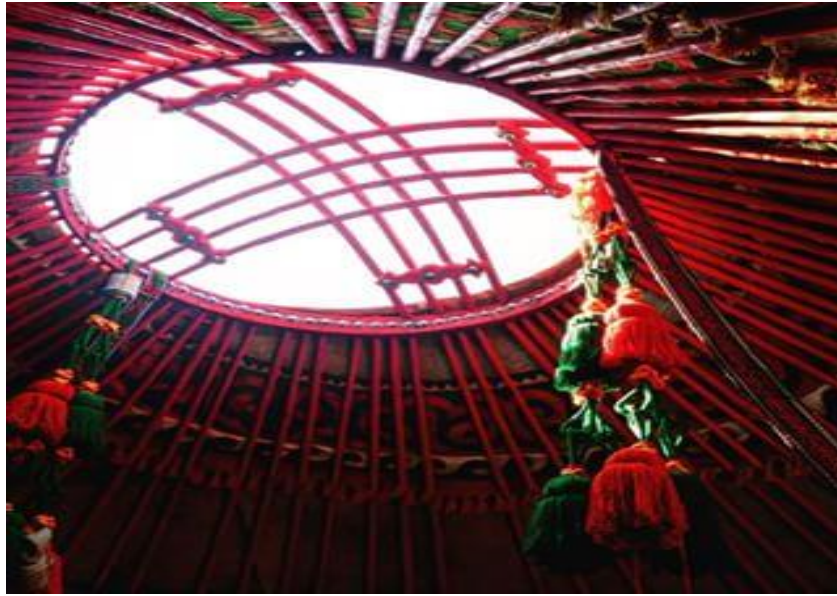
5.Boz üyün tündük kısmı

Kırgızlar üy-bülöö (aile), üylönüü (evlenme) terimlerini kullanırlar. Çünkü insanoğlunun hayatı evle bağlantılıdır. Dolayısıyla Kırgızlar boz üyü kurarken kundaktaki çocuğu tündüğe 2 baktırarak yukarı kaldırırırlar. Kırgızlar için tündük kutsaldır ve aile ocağıdır. Aile ocağını ancak çocuk devam ettirir. Dolayısıyla çocuğu yukarı tündüğe doğru kaldırarak Allah'tan çocuğun sağ salim olması, bu boz üyde yakılan aile ocağını söndürmeden devam ettirmesi istenir (Akmataliyev, 2011: 138).