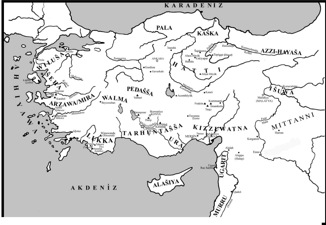
Harita 1 Geç Tunç Çağı'nda Anadolu (Mielke, 2021)

Yukarıda genel hatları ile bahsedilen tüm bu gelişmeler, Hattuşa'da uzun zamandan beri kriz yaşayan siyasi otoritenin MÖ 12. yüzyıl başında çökmesine neden olmuş ve Hititlerin Orta