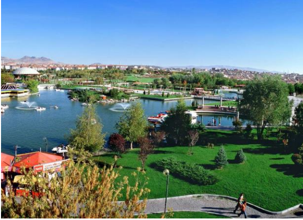
Şekil 4. Altınpark