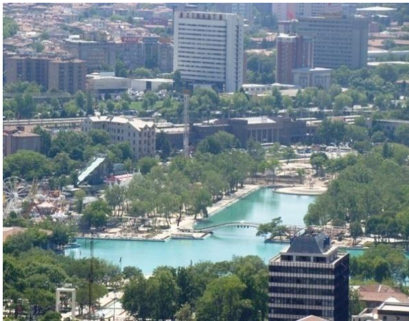
Şekil 2. Gençlik Parkı

1950'li yılların sonlarına doğru Gençlik Parkı, projesinde yer almayan öğelerle dolma sürecine girmiştir. 1957 yılında istenmeyen bu yerleşmelere alternatif oluşturacak bir proje çalışması yapılmıştır. Fakat 1964'lere gelindiğinde aynı durum tekrarlanmıştır. Zamanla yerel yönetimlerin para kazanma kaygısıyla, Gençlik Parkı, tarihî kişiliğini koruyamamış ve plânsız, yozlaşmış dolayısıyla bozulma sürecine girmiştir. Bu tarz yönetim sıkıntılarının dolayı Ankara'nın sosyo-kültürel açıdan en alt tabakasına hizmet veren izbe bir park haline gelmiştir. Kullanılan donatıların büyük kısmı tahrip edilmiş, proje içerisinde yer almayan kullanımlarla park sıkıştırılmıştır. Bunların sonucunda ise; Cumhuriyetin ve Ankara'nın sembolü olan çok önemli bir değer kayboma tehlikesi ile karşı karşıya kalmıştır (Sarıkaya 2007).