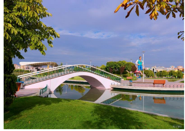
Şekil 5. Harikalar Diyarı