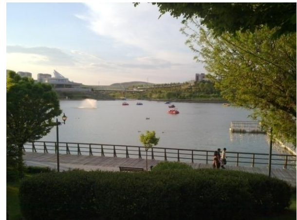
Şekil 3. Göksu Parkı

Göksu Parkı'nın toplam kullanım alanı 510.000 m 2 'dir. Bu alanın 140.000 m 2 'si göletten oluşmaktadır. Toplam yeşil alan 250.000 m 2 'dir. Park, su ve yeşilin bir arada olduğu, sosyal, kültürel ve sportif amaçlı kullanılacak birçok alandan oluşmaktadır.