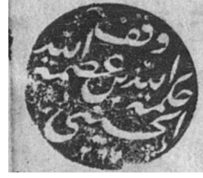
Şekil 2. Mühür

Üçüncüsü, eserin 42b sayfasında yer alan “tertîb-i dîvân eyledim”(1168), “tertîb-i dîvân-ı bedî”(1169), “hüsn-i hitâmı” (1169) gibi ifadelerle H 1169/M1755-56 tarihini düşürme çalışmalarından hareketle eserin bu tarihte tamamlanmış olabileceği söylenmektedir. Yazar, bu bilgilerin yanı sıra eserin tertibi içinde yer alan tarih manzumelerinin en geç 1169 tarihini gösterdiğini fakat derkenarlarda 1170 ve 1171 tarihlerinin yer almasından hareketle tamamlandıktan sonra esere eklemeler yapılmış olabileceğini dile getirmiştir.