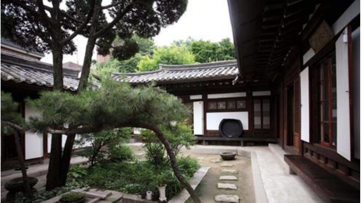
Şekil 5. Geleneksel Kore evi iç bahçesi ( Antique Alive, 2015 )

Hanok'un avlusu Batı mimarisindeki benzer örnekleri gibi beklenilenin aksine peyzaj öğeleri donatılmış değildir. Daha ziyade kasıtlı olarak boş bırakılmıştır ( Şekil 5 ). Bunun asıl nedeni, evi çevreleyen doğal ortamın zaten evin kendi bahçesi olarak görülmesidir (Sartor, 2019). Bahçeye ulaşmak için tek yapılması gereken kapıyı açmaktır. İç bahçenin boş bırakılmasının sebebi mahremiyetin yanı sıra alanda birçok şeyin tutulup depo olarak da kullanılabilmesidir. Hanok'un ülkenin hangi bölgesinde yer aldığına göre plan şeması ve iç bahçe düzeni de değişmektedir. Ülkenin kuzey kısımlarında ısıyı korumak için kare biçiminde iç bahçeler tercih edilirken, daha sıcak ve ılıman olan bölgelerde L şeklinde iç bahçeler kullanılır ( Tudor, 2014 ).