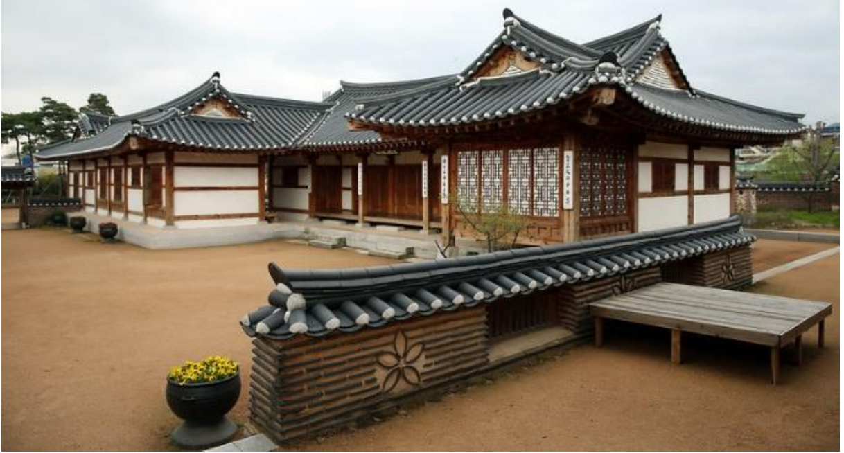
Şekil 1. Geleneksel Kore Evi Hanok, Gimhae, Güney Kore ( Korea.net , 2022)

önünde bulundurmışlardır. Doğu ya da batı yönü fark etmeksizin evler; arazi topraklarının verimli olduğu, kolay ulaşılan ve güzel bir manzaraya sahip alanlara inşa edilmektedir (Auri, 2022). Hanokların yerleştirildiği bölgelerde çevresi, coğrafya ve doğal ile uyumlu bir görünüm sergilerken, evler dağlara veya nehirlerle zarar vermeden iklimlendirilir.