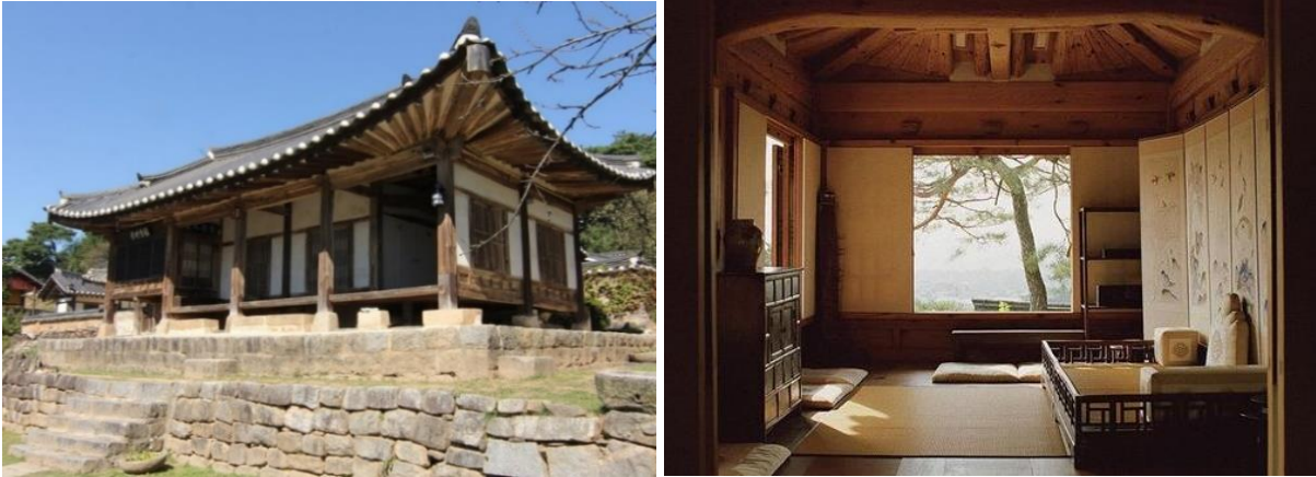
Şekil 3. a) Sarangchae-Erkekler Mahallesi ( Sanku, 2022 ). b) Anchaese-İç Mahalle ( Cerealmag, 2020 ).

Kadınlar bölümü olan anchaese sarangchae'nin yanında alçak bir duvarın arkasında yer almaktadır. Bu kısım evin özel ve kısıtlı bölümüdür, çoğu aile etkinliği burada gerçekleşmektedir ( Şekil 3 ). Tam karşılığı “iç mahalle” olan anchaese adı, soylu sınıf konutlarında kadınların yaşamlarının özünü de ele geçirmiştir ( Sanku, 2022 ). Evlendikten sonra bir kadın, kocasının evinin anchaese' sine taşınarak hayatının geri kalanını evden hiç çıkmayarak burada geçirmektedir. Dış dünya ile ilişkileri mutlak bir minimumla sınırlanmaktadır ve kendilerini ev hayatına adanmışlardır.