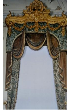
Resim 11: Yıldız Sarayı Şale Köşkü'nde, 18 Numaralı Oda'da perdelik olarak kullanılmış Çatma Kadife Örneği (Kaya vd, 1999: 170).