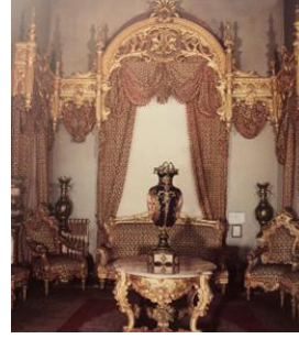
Resim 9: Fabrika desen numarası 629 olan Kumaş Desen Detayı ve Yıldız Sarayı Şale 17 Numaralı Oda'da Sandalye Döşemesi, Dolmabahçe sarayı 30 Numaralı Oda'da Döşemelik Olarak Kullanılmış Örneği (Kaya vd., 1999: 164)

Fabrika desen numarası: 629 olan kadife kumaş, perdelik ve döşemelik olarak kullanılmıştır. Kumaşta kullanılan renk özelliği, krem renk zemin üstüne kırmızı renkte desenli veya bordo renk zemin üzerine bordo renkte desenli ya da krem renk zemin üzerine koyu yeşil renkte desenlidir. Kumaşta kullanılan desen özelliği, Hereke çatma kumaşın deseni zeminden kabarık dokuda ağ şeklindeki motif yer almaktadır. Bu motifin içerisinde ise çiçek dalı yer almaktadır (Bkz. Resim 9.).