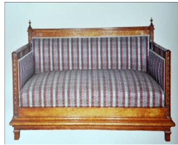
Resim 8: Fabrika desen numarası 904 olan Kumaş Desen Detayı, Şal desenli bu kumaş Dolmabahçe sarayı 181 Numaralı Oda'da Sedir Üzerinde Döşemelik Olarak Kullanılmış Örneğini (Kaya vd., 1996: 118)

Hereke ipekli kumaşlar, içerisinde çözgü ilmeli dokumalarda, gergin çözgülerin zeminde değişik örgülerle doku oluşturulurken, üzerine ekstra çözgüler bulunduran çok sayıda makaranın oluşturduğu çalgık sistemiyle daha serbest olan ikinci çözgü gruplarıyla ilmeler oluşturulur. Kadife