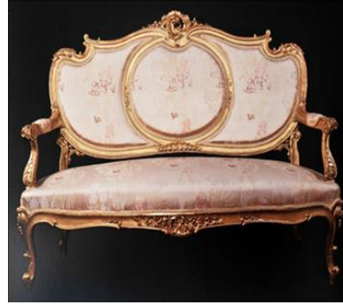
Resim 7: Fabrika desen numarası 870 olan Kumaş Desen Detayı, Dolmabahçe Sarayı, 42 numaralı Somaki Oda'da Kanepe Üzerinde Döşemelik Olarak Kullanılmış Kumaş Örneği (Kaya vd., 1999: 116)

Hereke ipekli klasik dokuma kumaşlarına fabrika desen numarası 904 olan döşemelik kumaşı örnek olarak verebiliriz. Kumaşın yeşil, siyah, beyaz, kırmızı, sarı, pembe renkte desenlerle süslediği görülmektedir. Ayrıca kumaşta, dört farklı renkte ve ton değerinde olan enden genişli boyuna çizgiler kullanılmıştır. Bu çizgilerin iç yüzey süslemesinde ise farklı renkte şal desenleri yerleştirilmiştir. Kumaşın teknik özelliği ise, bağlantı çözgülü, tek katlı kumaştır (Bkz. Resim 8.).