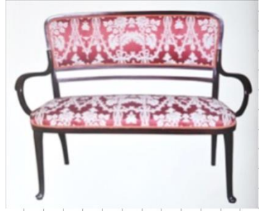
Resim 5: Fabrika desen numarası: 257 olan İpek Dokuma Kumaş Desen Detayı, Dolmabahçe Sarayı Camlı Köşk'ten Kanape Döşemelik Örneği (Kaya vd., 1999: 96)

Hereke ipekli dokuma kumaş örnekleri arasında 1900'lü yılların, Fransız modasına uygun, Lyon ipekli kumaşlarına benzer örnekler de tespit edilmiştir. 1898-1914 yılları arasında en parlak devrini yaşamış olan Art Nouveau akımının etkisinde bu desenler tasarlanmıştır. Bunların yanı sıra Rumi, Palmet, Şemse, Çin bulutu gibi geleneksel motiflerimizin de yer aldığı çok sayıda desen mevcuttur. Bu motiflerle üretilmiş ipek dokuma kumaş örneklerinden, fabrika desen numarası: 81 olan kumaş deseni, Beylerbeyi Sarayı Sarı Köşkündeki koltuk üzerinde döşemelik olarak kullanılmıştır. Kumaşın renk ve desen özelliğini incelediğimizde, kırmızı renk zemin üzeri, krem renk ve hardal renkte desenlerle süslenmiştir. Kumaşta kullanılan desenler, kırmızı renk zemin üzerinde, kenarları dilimli oval madalyonlar yer almaktadır. Bu madalyonların içinde merkezden kaymış bir Gülbezek ile Çin Bulutu motifi yer almıştır. Madalyonlar birbirlerine küçük stilize yapraklarla bağlanmış ve kaymış akslar üzerine yerleştirilmiştir (Bkz. Resim 6.).