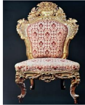
Resim 10: Fabrika desen numarası 7 olan Kumaş Desen Detayı, Dolmabahçe Sarayı, 14 Numaralı Oda'da yer alan sandalye üzerinde döşemelik olarak kullanılmış örneği (Kaya vd., 1999: 160)

Fabrika desen numarası:7 olan diğer bir kadife çatma dokuma kumaşı ise döşemelik olarak kullanılmıştır. Kumaş, açık sarı zemin üzerine kırmızı renkli desenlerle süslenmiştir. Kumaşta kullanılan desen, içlerinde birer çiçek, kenarlarında yaprak motifleri bulunan, ağ doku