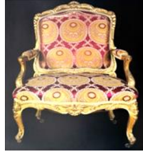
Resim 6: Fabrika desen numarası 81 olan Kumaş Desen Detayı, Beylerbeyi Sarayı Sarı Köşk'te, Koltuk Üzerinde Döşemelik Olarak Kullanılmış Örneği (Kaya vd., 1996: 68)