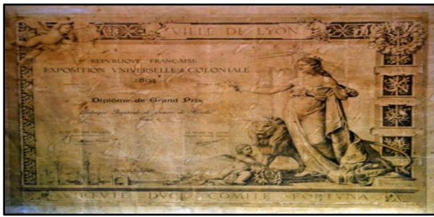
Resim.2: Hereke Fabrika-i Hümayünü, 1894 Yılında Fransa'nın Lyon Şehrinde Açılan Fuarda Aldığı Büyük Ödül. (Kaya vd., 1999: 19)

1902 yılında 20 tezgâhtan oluşmuş çuha, şayak, iplik bölümleriyle, 1905 yılında yünlü dokuma dairesi, Hereke Fabrikası'na eklenmiştir. Fes giymenin zorunlu olduğu bu dönemde ithal edilen Fesler yeterli olmayınca, 1908 yılında Fes bölümü üretime başlanmıştır. Hereke Fabrikası 1910 yılında Brüksel Fuarı'nda, 1911 yılında Torino Fuarı'nda ürettikleri tekstillerle ödüller almıştır. Hereke Fabrikası'nda yine o tarihlerde çorap,