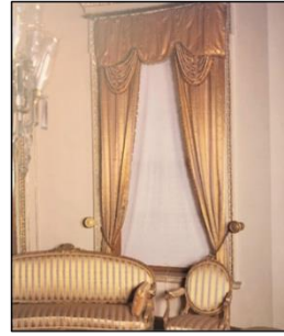
Resim 4: Fabrika desen numarası:1001 olan Desen Detayı ve Küçükku Kasrı 5 numaralı Oda (Kaya vd., 1999: 130)