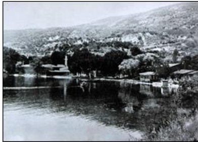
Resim.1: 19.yüzyıl sonu Hereke, Fotoğrafçı Berggren çektiği (IRCICA Fotoğraf Arşivi 90490-5), (Kaya vd., 1999: 10)

Hereke Fabrikası, fabrikanın yanından geçen Ulupınar dere suyu, enerji kaynağı olarak kullanılacak biçimde tasarlanmıştır (Bkz. Resim1.). Hereke fabrikası, daha sonra da adını koruyarak gelişim göstermiş ve yakın bir tarihe kadar da Hereke'de üretimine devam etmiştir. 1850 yılında Bakırköy'de kurulan yeni fabrikaya, Hereke Fabrikası'nda pamuklu dokumalar için kullanılan tezgâhlar taşınmıştır. Saray için dokunan ipekli canfes, kadife ve ipekli döşemelik kumaşlar içinde Hereke'de yer alan Kemhahâne binasına, Fransa'dan Jakarlı tezgâhlar getirilerek, kurulmuştur. 1871 yılında Haydarpaşa-İzmit arasına, yapılan demiryolunun açılmasıyla da Hereke Fabrikası çok daha büyük bir canlılık kazanmaya başlamıştır.