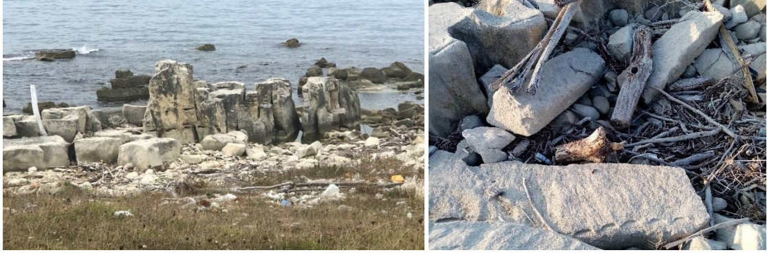
Lev. 9. Çaylıođlu, Sayarkası, Taş Atölyesi, Taş Bloklar ve Tamamlanmadan Bırakılmış Yarım Fabrikasyon Eserler (2022)