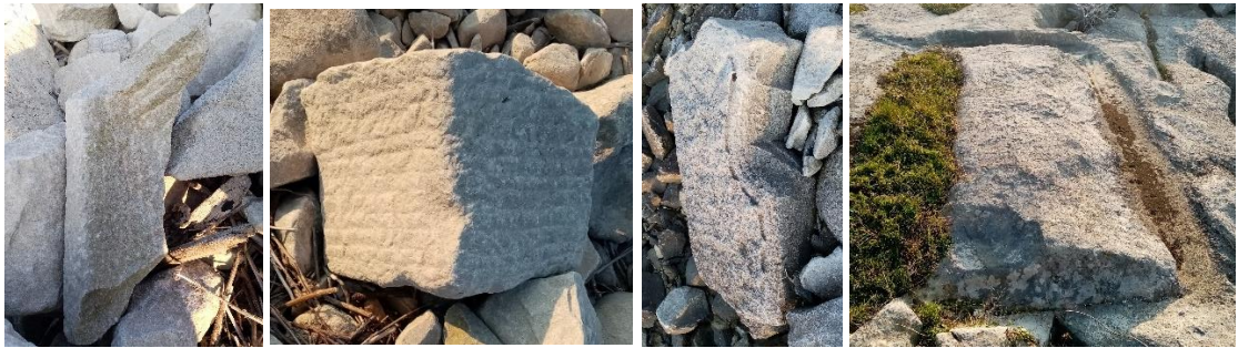
Lev. 11 Çaylıođlu, Sayarkası, Taş Atölyesinde Tespit Edilen Yarım Fabrikasyon, Lahit ve Mimari Plastik Eserler (2022)