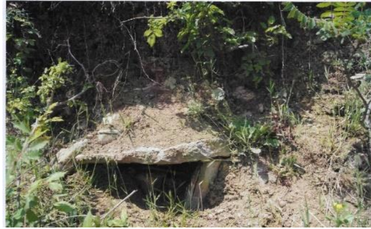
Lev. 8. Çaylıođlu, Limanüstü Mevki, Nekropol