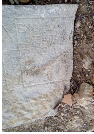
Lev. 4. Çaylıođlu, Tabula Ansata İçinde Yazıt Parçası (E. Özcan, 2019)