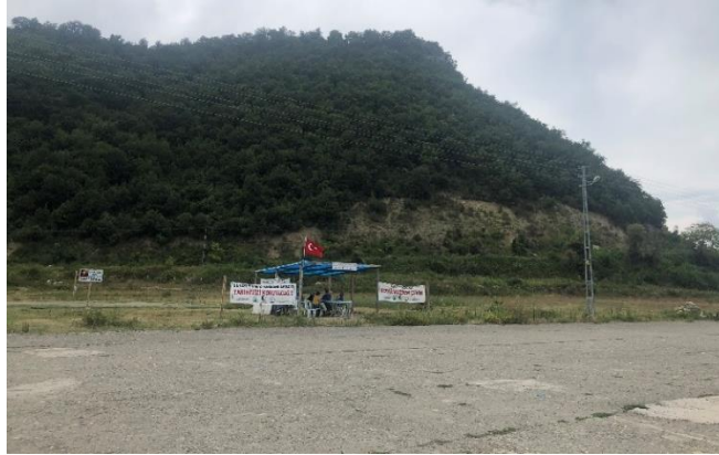
Lev. 6. Çaylıođlu, Ustaburnu, Limanüstü Mevkideki Antik Nekropol (2022)