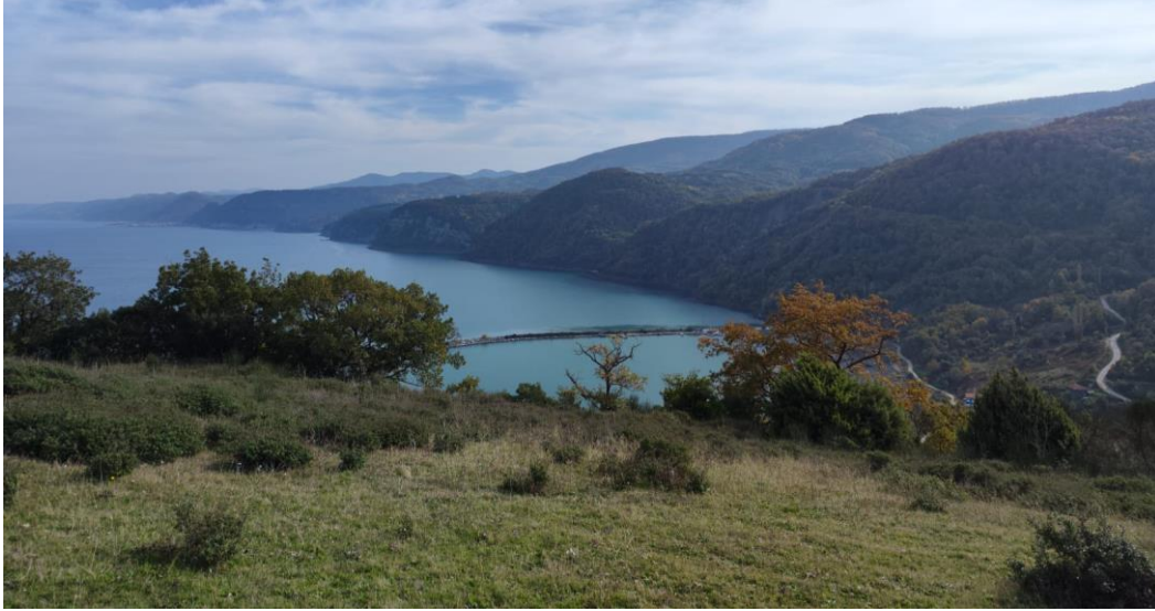
Lev. 2. Çaylıođlu, Dođu Giranüstü (Akropol-Kale) (2022)