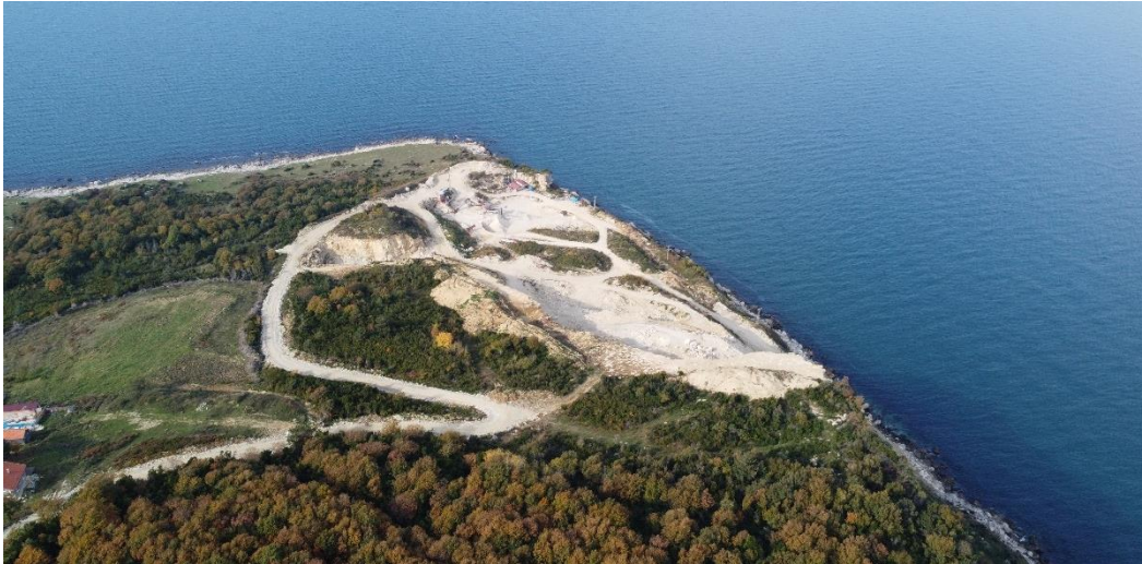
Lev. 3. Çaylıođlu, Usta Burnu'ndaki Modern Taş Ocađı (A.C.Akyol, 2022)