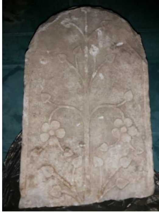
Lev. 10. Çaylıođlu, Osmanlı Dönemi Mezar Taşı (18.-19. Yüzyıl) (2022)