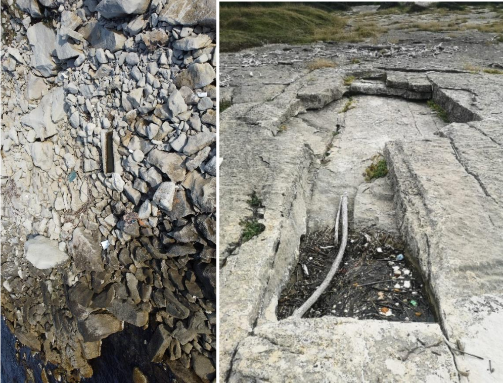
Lev. 5. Çaylıođlu, Sayarkası, Taş Atölyesi, Yarım Fabrikasyon Üretimler (2022)