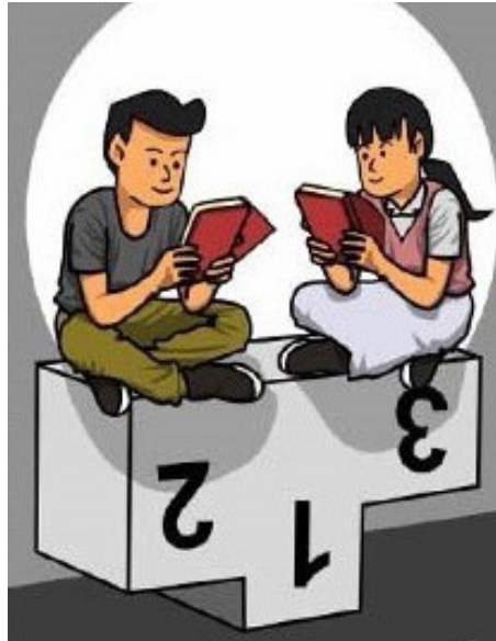
Şekil 1. Toplumsal Cinsiyet Eşitliği Üzerine

Küresel tarih çalışmaları, toplumsal cinsiyet tarihçilerinin yer alıp deney yapabilecekleri yeni tartışmalar ve yeni bir alan açmıştır. Hâlâ oluşum aşamasında olan bir alan olduğu için, toplumsal cinsiyet tarihçileri, geleneksel tarih yazımında eksik olan büyük bir işlenebilirlik alanına sahiptir (Wiesner-Hanks, 2011). Toplumsal cinsiyet tarihçilerinin, Avrupa-merkezciliği reddeden ve toplumsal cinsiyet araştırmacılarını her zaman Batılı bilim adamlarının egemen olduğu alanın kurucu kategorilerini yeniden düşünmeye teşvik eden merkeziz bir dünya tarihinde yer almalarına olanak tanır (Calvi, 2010, s. 641). Ulus-devletlerin sınırlarını aşan ve Avrupa toplumsal cinsiyet tarihçiliğinin yerleşik sınırlarına ve fikirlerine meydan okuyan bir toplumsal cinsiyet tarihi çağrısında bulunur. Cinsiyet tarihçiliğinin Doğu Avrupa'da yerleşmek için daha fazla sorunu olduğundan, bu süreç Amerika Birleşik Devletleri ve Birleşik Krallık'ta daha hızlı gerçekleşmektedir. Buna mukabil, Anglofon akademik toplulukların