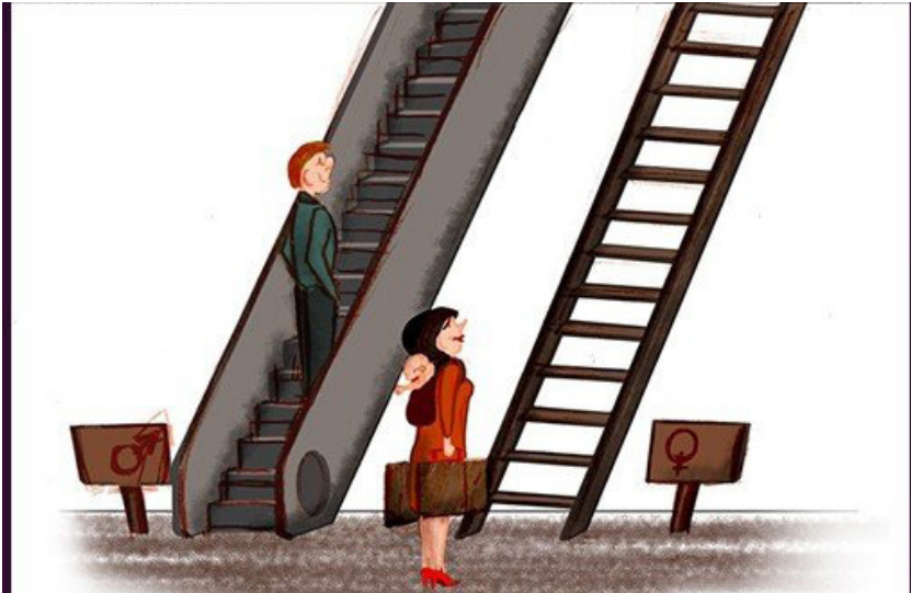
Şekil 2. Kariyer Basamaklarında Toplumsal Cinsiyet Eşitsizliği

Aynı zamanda, toplumsal cinsiyet çalışmaları, toplumsal cinsiyet inşasının ve anlamının daha iyi anlaşılmasına yaptıkları katkıyla, toplumsal ve kültürel pratiklerin dönüşümüne, dolayısıyla toplumu kalıcı ve verimli bir şekilde dönüştürmeye katkıda bulunmuştur. Bunlardan ötürü, toplumsal cinsiyet çalışmalarının, kısa varoluşları boyunca, insan örgütlenmesinin ve toplumsal yaşamın tüm biçimlerinin ve sistemlerinin analizi için toplumsal cinsiyeti temel bir kategori olarak dayattığını savlamak mümkündür (Răducu, 2011, s. 18).