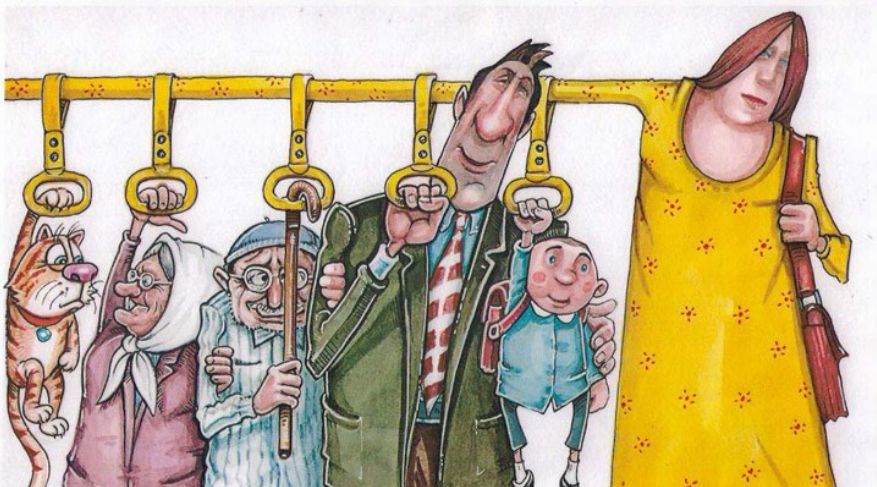
Şekil 3. Sosyolojik Olarak Gerçekten Yüklü Kadın: Nerede Eşitlik?...

Tarihsel olarak, eğitimsel cinsiyet veya batı kültürlerinde cinsiyet farklılıklarına yönelik üç ana yaklaşım olmuştur. Birincisi, kadın ve erkek arasındaki sosyal ve kültürel farklılığın biyolojik, doğal ve dolayısıyla değişmez olarak görülmesi anlamında -biraz- muhafazakâr olmaktadır. Nitekim birçok kültürde ve tarihin birçok döneminde, bu bakış açısı kadınların aşağılığına odaklanan geniş bir literatür tarafından desteklenerek tartışmasız kalmıştır. Örneğin, 19. yüzyıl Britanya’sında, erkeklerin ve kadınların toplumda ayrı roller üstlenmeleri beklenmekteydi ki, bu şekilde erkekler kamusal alanla ve kadınlar ise özel alanla ilişkilendiriliyordu (Vicus, 1972). Kadınların üniversitelere girmeleri halinde üreme kapasitelerinin zarar göreceğini sözde “kanıtlayan” ve yine sözde bilimsel çalışmalar yayınlanmaktaydı (Delamont ve Duffin, 1978). Nitekim bu bakış açısının 20. yüzyıldaki gelişimi, cinsiyetler arasın-