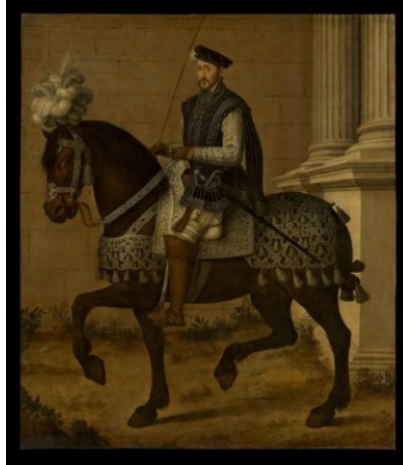
Görsel 3: Fransa Kralı II. Henri.