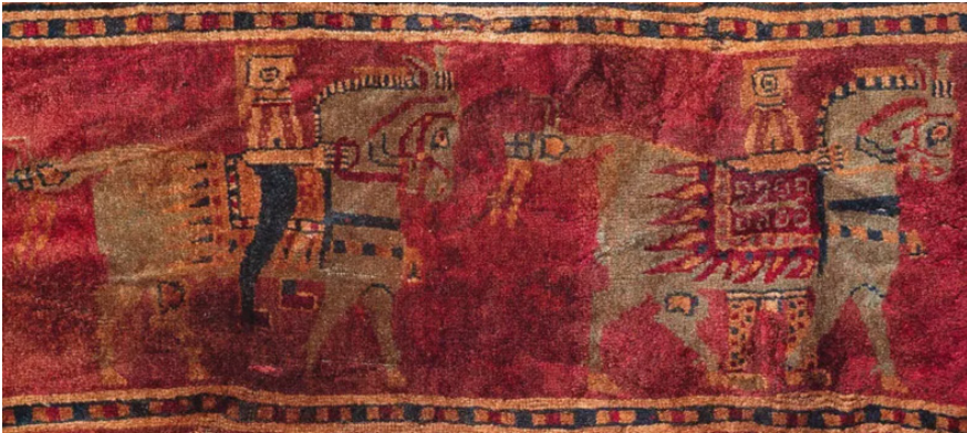
Görsel 1: Halıda Yer Alan Süvari Detayı.