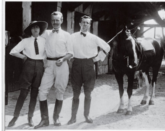
Görsel 7: Gabrielle Chanel ve Etienne Balsan, Royallieu, 1909.