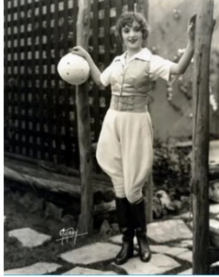
Görsel 8: Madge Bellamy Jodhpurs ile ,1920ler