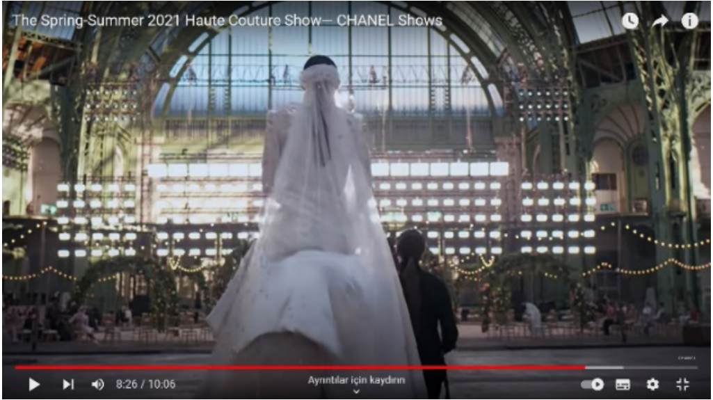
Görsel 21: Chanel, 2021 İlkbahar/Yaz Haute Couture.