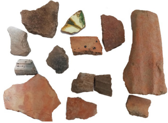
Şekil 2: Masumu-Pak Kalesi'nin Genel Bir Görünümü ve Seramik Buluntuları

Yerden itibaren ortalama yüksekliği 25 m olan kale, 1 hektardan daha az bir alanı kaplamaktadır. Kalenin kuzey, kuzeydoğusu ve kuzeybatısı bir uçurum ile sona ermekte ve uçurumun sona erdiği aynı istikamet üzerinde "Dürüt Deresi" adındaki bir akarsu geçmektedir. Kale konumsal olarak stratejik bir öneme sahiptir. Hozat – Ovacık – Çemişgezek üçgenine egemen bir konumda yükselen bir tepe üzerinde kurulmuş olması, kale tipindeki yerleşimin konumsal öneminin nedenini açıklamaktadır. Bu yerleşim, daha önce kayıtlarda bulunmamakta olup, 2021 yüzey araştırması kapsamında bilimsel literatüre kazandırılmıştır.