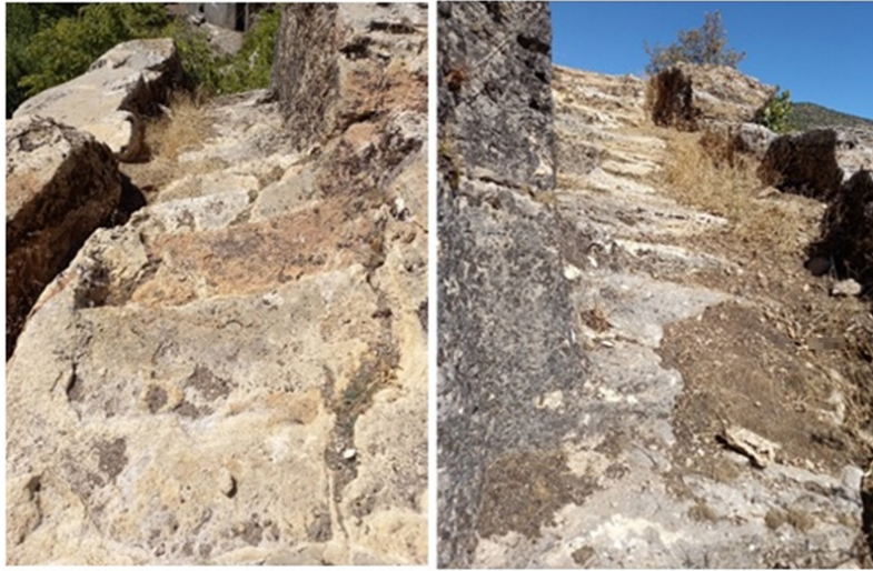
Şekil 9: Aşağı Doluca Kalesi'nin Güneydoğu Girişi (sol) ve Güneybatısındaki Kaya Basamakları (sağ)

Kaleye giriş kaya merdivenleriyle güneydoğudan sağlanmıştır (Şekil 9). Köy evlerinin içerisinde yükselen bu kaya merdiveni, sitadeldeki açık hava tapınım alanının 25 m güneydoğusuna kadar uzanmaktadır. Söz konusu basamakların yirmi altı kadarı seçilebilmektedir. Bu merdiven basamakları 135 cm genişliğinde 55 cm uzunluğunda ve 20 cm yüksekliğindedir. Kalenin güneybatısında yükselerek sitadele ve açık hava tapınım alanına yönelmiş kaya basamaklarından oluşan bir başka merdivenli giriş daha da bulunmaktadır. Bu basamaklı giriş, güneydoğusunda yer alan merdivenli girişten farklı olarak kale içerisindeki erişim ile ilişkili görünmektedir. Açık hava alanının 20 m güneyinde yer alan bu basamaklar 140 cm genişliğe, 70 cm arasındaki uzunluğa ve 15 cm yüksekliğe sahiptir.