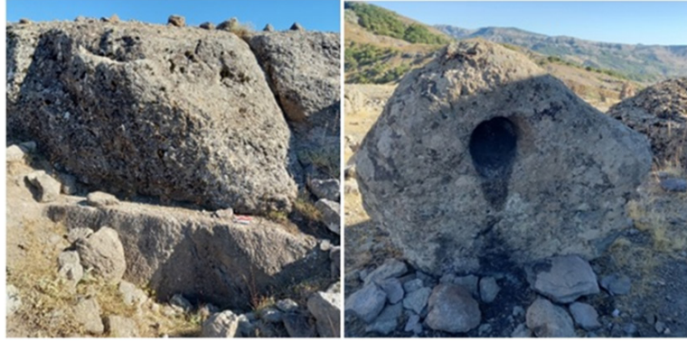
Şekil 7: Masumu-Pak Kalesi'nin Güneybatısındaki Kaya Fasadı ve Kuzeybatısındaki Oyuklu Kaya Bloğu

Güneybatı yamaçtaki kayalık bir alanda 2.5 m genişliğe sahip düzgünleştirilmiş kaya fasadı, kalenin önemli mimari unsurlarındadır. Burada 40 cm öne doğru çıkıntı yapan yontularak düzleştirilmiş kaya yüzeyinin gerisinde bir kaya duvarı yükselmektedir. Yerleşimin aynı güney yamacında Demir Çağı'na ait olabilecek farklı kaya işçilikleri izlenebilmektedir. Kuzeybatı cephesinde ise üzerinde 30 cm çapında yuvarlak formlu bir nişe sahip bir kaya bloğu bulunmaktadır ve günümüzde bu kaya oyuğuna mum yakmak suretiyle bir kutsiyet atfedilmiştir. Yüksekliği 1.5 m'yi aşan bu kaya parçasının işlevi ve orijinal yerinin neresi olduğu belirsizdir (Şekil 7).