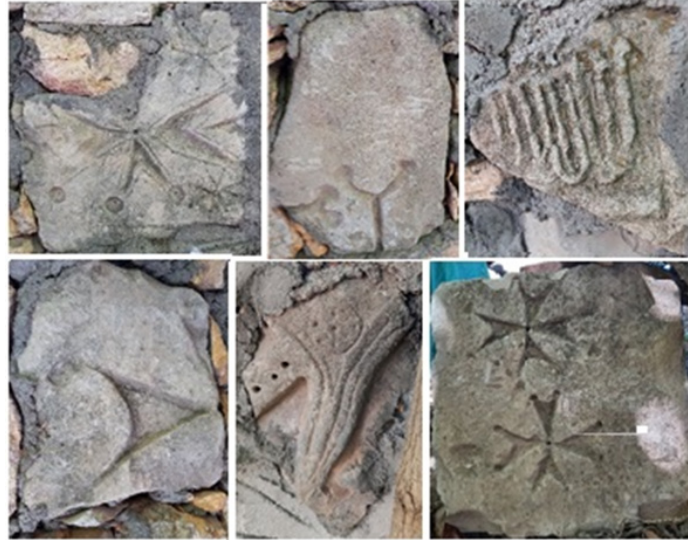
Şekil 12: Aşağı Doluca Ev ve Bahçe Duvarlarındaki Devşirme Malzeme

Köy içerisinde içerisindeki ev ve bahçe duvarlarında, kale ya da kalenin çevresinden getirilmiş olan pek çok devşirme taş malzemenin kullanılmış olduğu saptanmıştır (Şekil 12). İçlerinden bazıları Orta Çağ'a ait oldukları anlaşılmaktadır. Uçları loplul, kolların uçları içe üçgen biçiminde oyulmuş Malta tipi haçlar Bizans mimarisinde oldukça yaygındır 1 . Sandal (Çarıklı) Kilise gibi Bizans Dönemi Kapadokya kiliselerinde örneklerinde de örneklerine rastlanmaktadır 2 . Ayrıca bu devşirme eserler arasında İslami Dönem'e ait olması gereken Arapça bir yazıt parçası da dikkat çekmektedir. Farklı zaman dilimlerinde ev ve bahçe duvarlarının yapımı için köy içerisinde kalan kaleden taş çekilmesinden ve kaçak kazılardan ötürü, buradaki Orta Çağ yapı kalıntılarının tamamı tahrip olmuştur. Dolayısıyla Orta Çağ'a ait olması gereken iskânın, niteliği ve büyüklüğü hakkında yerleşimin uğramış olduğu ağır tahribattan ötürü bir saptama yapmak mümkün değildir.