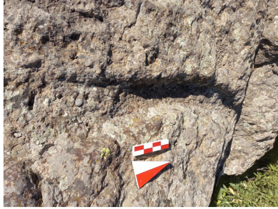
Şekil 6: Masumu-Pak Kalesi Açık Hava Tapınım Alanının Doğusunda Yer Alan Kanal

Güneybatı yamaçtaki kayalık bir alanda 2.5 m genişliğe sahip düzgünleştirilmiş kaya fasadı, kalenin önemli mimari unsurlarındadır. Burada 40 cm öne doğru çıkıntı yapan yontularak düzleştirilmiş kaya yüzeyinin gerisinde bir kaya duvarı yükselmektedir. Yerleşimin aynı güney yamacında Demir Çağı'na ait olabilecek farklı kaya işçilikleri izlenebilmektedir. Kuzeybatı cephesinde ise üzerinde 30 cm çapında yuvarlak formlu bir nişe sahip bir kaya bloğu bulunmaktadır ve günümüzde bu kaya oyuğuna mum yakmak suretiyle bir kutsiyet atfedilmiştir. Yüksekliği 1.5 m'yi aşan bu kaya parçasının işlevi ve orijinal yerinin neresi olduğu belirsizdir (Şekil 7).