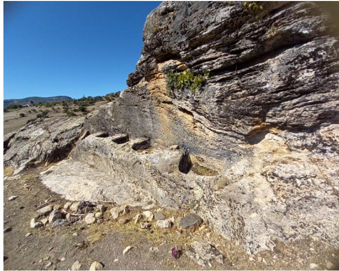
Şekil 11: Aşağı Doluca Açık Hava Tapınağı'nın Doğudan Görünümü

Açık hava tapınım alanınının 8 m kuzeyinde 100 x 80 cm ölçülerinde yer alan dikdörtgen formlu sarnıç ya da bir kuyunun varlığı saptanmıştır. Toprak ve çalılıklarla kapanmış buna benzer başka sarnıçlarında varlığı gözlemlenebilmektedir. Yuvarlak formlu olmayan köşeli sarnıçlar, Van yakınlarında önemli bir Urartu yerleşimi olan Çavuştepe'den de tanınmaktadır.