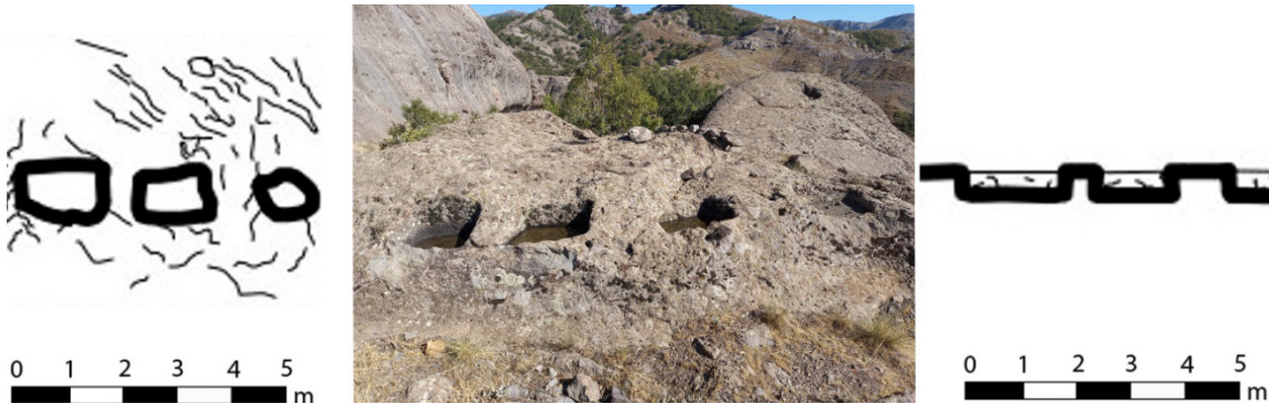
Şekil 5: Masumu-Pak Kalesi Açık Hava Tapınağı