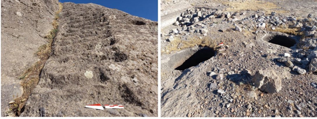
Şekil 4: Masumu-Pak Kalesi'nden Basamaklı Giriş (sol), Sarnıçlar ve Bazı Temel İzleri (sağ)

Düz bir platform görünümündeki kale sitadeli, üzerinde çapları 1.5 m olan yan yana yapılmış yuvarlak formlu iki adet kaya sarnıcı/kuyu saptanmıştır. Sitadelde ayrıca 7 m x 3 m ebatlarında ve 1 m derinliğinde bir yapıya ait temeller gözlemlenebilmektedir (Şekil 4).