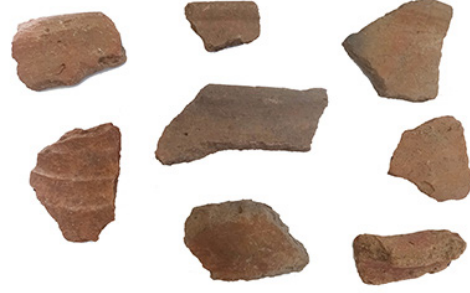
Şekil 8: Aşağı Doluca Kalesi'nin Batıdan Bir Görünümü ve Seramik Buluntuları

Kaleye giriş kaya merdivenleriyle güneydoğudan sağlanmıştır (Şekil 9). Köy evlerinin içerisinde yükselen bu kaya merdiveni, sitadeldeki açık hava tapınım alanının 25 m güneydoğusuna kadar uzanmaktadır. Söz konusu basamakların yirmi altı kadarı seçilebilmektedir. Bu merdiven basamakları 135 cm genişliğinde 55 cm uzunluğunda ve 20 cm yüksekliğindedir. Kalenin güneybatısında yükselerek sitadele ve açık hava tapınım alanına yönelmiş kaya basamaklarından oluşan bir başka merdivenli giriş daha da bulunmaktadır. Bu basamaklı giriş, güneydoğusunda yer alan merdivenli girişten farklı olarak kale içerisindeki erişim ile ilişkili görünmektedir. Açık hava alanının 20 m güneyinde yer alan bu basamaklar 140 cm genişliğe, 70 cm arasındaki uzunluğa ve 15 cm yüksekliğe sahiptir.