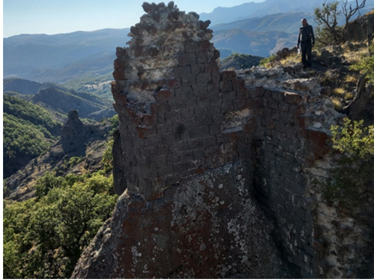
Şekil 3: Masumu-Pak Kalesi'nin Güneydoğusundaki Harçlı Sur Duvarları

Kaleye ait Orta Çağ görünümlü harçlı sur duvarları kale sitadelinin güneyinde ve güneydoğusunda izlenebilmektedir (Şekil 3). erleşimin güneydoğu cephesinde yer alan bazı sur kalıntıları, kale burçları işlevindedir. Kalenin kurulu olduğu kayalık tepenin doğu ve kuzeyi boydan boya kat eden bir kuşak şeklinde yontulmuş bir izi gözlemlemek mümkündür. Bu aşınmış hat, muhtemelen yerleşim içi ulaşım ağıyla ilişkili olduğu izlenimi verse de fonksiyonunun ne olduğu hakkında kesin bir şey söylemek mümkün değildir. Kalenin yaklaşık olarak 100 m ilerisinde, üzerinde kaya yontum izlerinin olduğu ve az da olsa günlük kaba kap parçalarının bulunduğu ikinci bir tepe yer alır. Söz konusu tepenin kaleyle ilişkili bir alan olduğu söylenebilir.