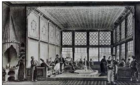
Şekil 2. İstanbul'da bulunan bir kahvehane tasvirinin görseli (Ürer, 2010; URL-3)

Kahvenin en hâkim yerine alçıdan yapılan yaşmaklı bir ocak konumlanmaktaydı. Ocağın iki tarafında da içinde fincanların ve kahve takımlarının bulunduğu delik adı verilen dört gözlü raflar yer almaktaydı. Rafların biraz ilerisinde tütün ocakları bulunmaktaydı. Kahvehaneler köy odalarına ya da eğlenme, sohbet etme mekânlarıyla benzerlikler taşımaktaydı (Ürer, 2010). Şekil 2'de İstanbul'da bulunan bir kahvehane tasvirinin görseli sunulmuştur.