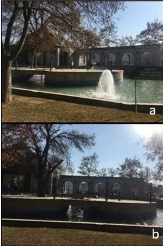
Şekil 15. Selçuklu Millet Kiraathanesi'nin açık alan görünümü

dekoratif aydınlatmalar ile ışıklandırılmıştır (Şekil 15).