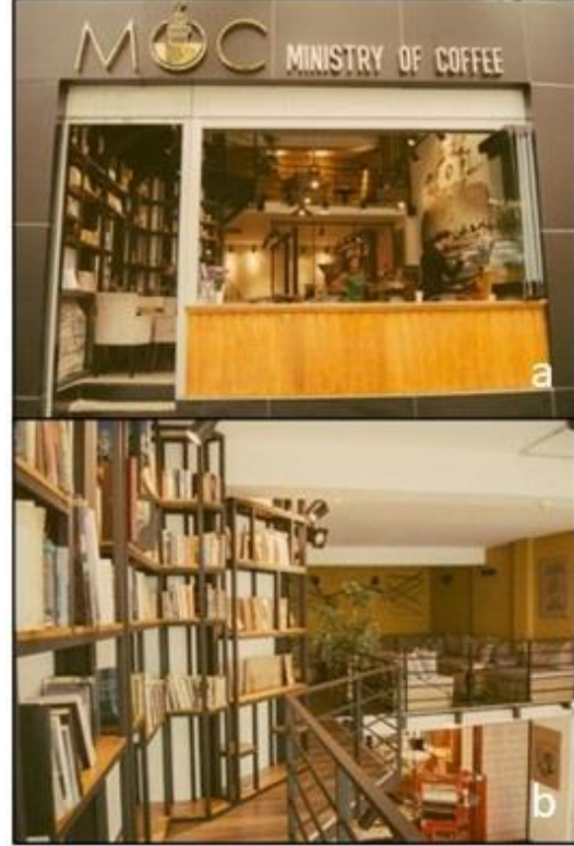
Şekil 12. M.O.C'in genel görünümü (URL-16)

İstanbul'un Nişantaşı ilçesinde bulunan Kahveleriyle ünlü olan M.O.C, yani Ministry of Coffee kitap kafe, haftanın her günü 08.00-00.30 arası hizmet vermektedir (URL-22). İçeri girildiğinde duvarı kaplayan kütüphane ve tam karşısında kahve satış bölümü bulunmaktadır (URL-12). M.O.C aynı zamanda SCAE onaylı bir eğitim merkezi olarak kullanılmaktadır (URL-16). Şekil 12'de görüldüğü üzere yüksek tavana sahip olan mekâna yarım asma kat uygulanmıştır. Mekânın geneli metal ızgaralar kullanılarak dekore edilmiştir.