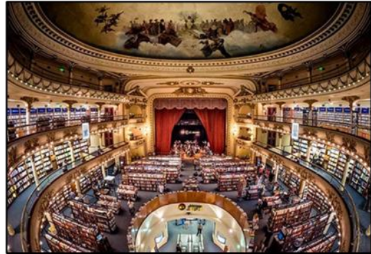
Şekil 5. El Ateneo Grand Splendid'in kütüphane bölümü görseli (URL-10)