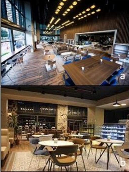
Şekil 11. Kahvehane Halktaş'ın genel görünümü (URL-15)