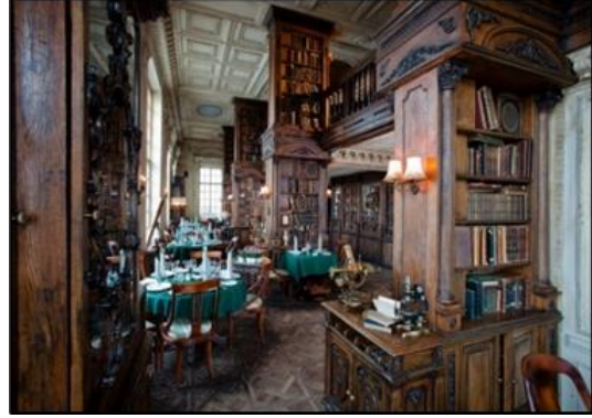
Şekil 6. Café Pushkin'in kütüphane katı görseli (URL-13)