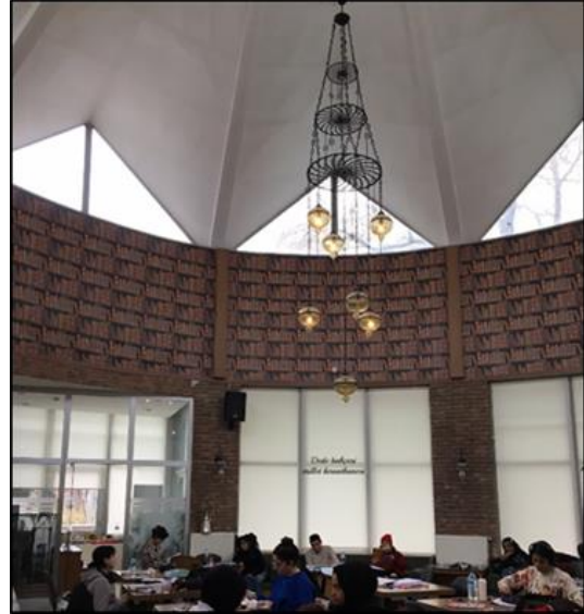
Şekil 18. Selçuklu Millet Kiraathanesi girişinin solunda bulunan alan yönetim odasının görünümü

Kıraathane girişinin solunda sedirli oturma bölümünün hemen yanında bulunan alan yönetim odası olarak kullanılmaktadır. Yönetim odası içeri ile bağlantıyı koparmamak ve sekizgen alanın bütünlüğünü bozmamak adına duvar yerine cam ile bölünerek oluşturulmuştur (Şekil 18).