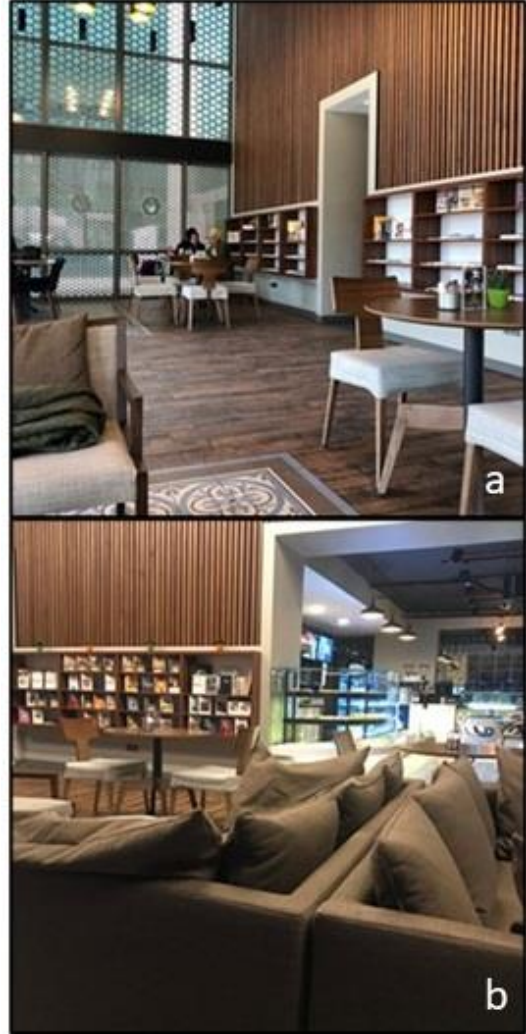
Şekil 10. Kahvehane Halktaş'ın giriş bölümünden görünüm (URL-15)

İstanbul'un Fatih ilçesinde bulunan Kahvehane Halktaş, 102 kişilik kapasitesi ve 220 metrekarelik kapalı alana sahip bir kitap kafe olarak hizmet vermektedir. 3. Dalga Kahve Satışı (Third Wave) konsepti ile hizmete açılan bu sosyal tesis haftanın yedi günü 07.30-22.00 saatleri arası açık bulunmaktadır (URL-14). Geniş bir alana sahip olan mekân loft tarzda tasarlanmış, donatı elemanlarında çoğunlukla koyu ahşap renkleri tercih edilmiştir. Giriş bölümünün yüksek duvarları, koyu ahşap çitalarla kaplanmıştır. Mekânın üç tarafında yüksek camlar kullanılmış olup, yeterince ışık alan bölümde ışığı azda olsa kesmek için metal ızgaralar kullanılmıştır. Girişin tam karşısındaki duvara konumlandırılan kitaplık yaklaşık bir metre yüksekliğe sahiptir (Şekil 10).