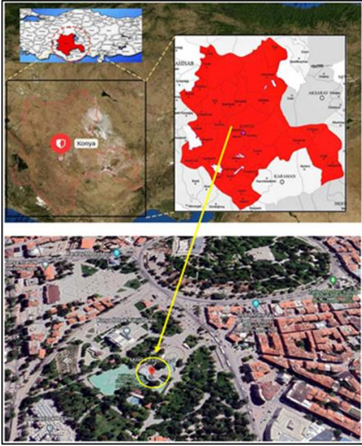
Şekil 13. Konya Selçuklu Millet Kiraathanesi'nin konumu (URL-19)

hizmet vermeye başlamıştır (URL-18). Şekil 13'de Selçuklu Millet Kiraathanesi'nin konumu verilmiştir.