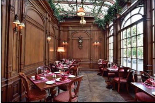
Şekil 9. Café Pushkin'in teras katı görseli (URL-13)