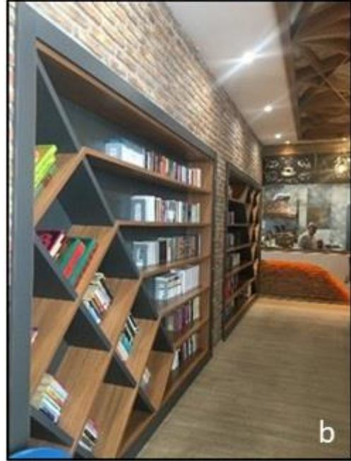
Şekil 21. Selçuklu Millet Kiraathanesi girişinin sağında bulunan koridorun görünmleri

Kiraathanenin sağ tarafında bulunan ikinci koridor da aynı şekilde bireysel çalışma alanı olarak tasarlanmış ve koridorun sonunda tuvaletin bulunduğu alan ahşap bir separatör yardımıyla mekândan ayrılmıştır. İlk koridorda bulunan çay ocađının iki tarafa da kolay hizmet sağlayabilmek