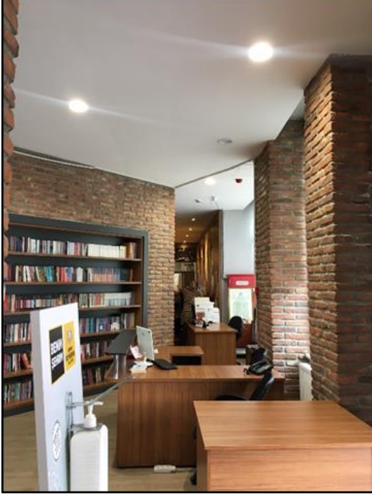
Şekil 20. Selçuklu Millet Kiraathanesi girişinin sağında bulunan personel alanından görünm

Kiraathanenin sağındaki koridorlar bireysel çalışma alanı olarak tasarlanmış tek kişinin kullanabileceđi masalardan oluşmaktadır. İlk koridorun sonunda bulunan çay ocađı ikinci koridorla bir açıklık yardımıyla ikinci koridorla bağlanacak şekilde tasarlanmıştır. Koridorun sağında bulunan duvar eski dönemi anlatan bir duvar kađıdı ile kaplanmış, koridor oluşturmak için separatör olarak kullanılan duvar kitaplık olarak tasarlanmıştır. Her iki koridorun da tavanına ahşap malzemedeki sekizgen köşeli yıldız şeklinde bir bordr tasarlanarak ierisine sarkıt avizeler yerleştirilmiştir (Şekil 21).