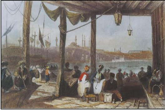
Şekil 3. İstanbul'da deniz manzaralı bir kahvehane tasvirinin görseli (Ürer, 2010; URL-4)

Kahvehanelerin başka bir türü olan yeniçeri kahvehaneleri büyük ve oldukça süslü İstanbul'un deniz manzaralı yamaçlarına veya denizde kazıklar üzerine inşa edilmekteydi. Bu tür kahvehanelerde sofalar, saz yeri, peykeler ve bir baba sofası bulunmaktaydı. Tamamı ahşap oymalı, boyalı, nakışlı, çiçek kabartmalı ve altın yaldızlı idi. Ortada mermer havuz yer almaktaydı. Peyke ve sofalar kuzu ve ayı postu, kilim ve yastık gibi materyaller ile döşenmekteydi. Yeniçeriler birbirlerinin kahvehanesine uğur getirmesi adına kanarya kafesi hediye etmekteydi. Bir kahvehanede en az 30-40 kanarya kafesi bulunmaktaydı (Ürer, 2010). Şekil 3'de İstanbul'da deniz manzaralı bir kahvehane tasvirinin görseli sunulmuştur.