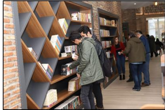
Şekil 19. Selçuklu Millet Kiraathanesi girişinde sağdaki koridorda bulunan gömme kitaplığın görünümü (URL-20)

Kıraathane girişinde sağda ki koridorda bulunan gömme kitaplığa ait görsel Şekil 19'da sunulmuştur.