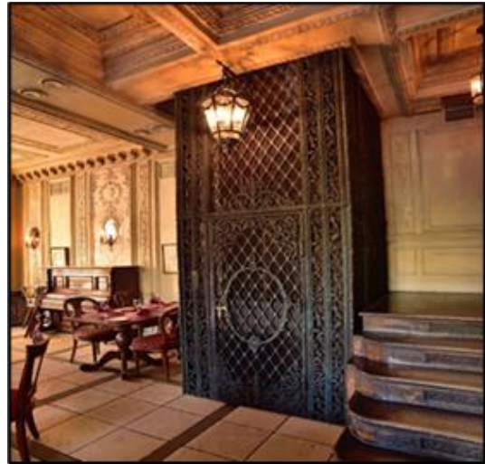
Şekil 7. Café Pushkin'in duvarlarında ve tavanların etrafında alçı işleri ile dökme demir ızgara asansör görseli (URL-13)