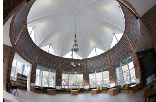
Şekil 24. Selçuklu Millet Kiraathanesi girişinde ki sekizgen alanda bulunan sedirin görünümü (URL-18)