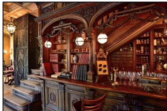
Şekil 8. Café Pushkin'in dökme demir ızgara asansör ve bar bölümü görseli (URL-13)