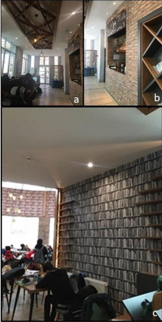
Şekil 22. Selçuklu Millet Kiraathanesi girişinin sağında bulunan ikinci koridorun görünümü

adına açılan servis açıklığı kitaplığın bulunduğu duvar ile aynı şekilde dekoratif tuğla taşlarıyla kaplanmıştır. Sol tarafta bulunan duvar ise kitaplık baskılı duvar kağıdı ile kaplanmıştır (Şekil 22).