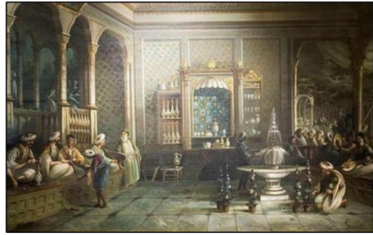
Şekil 1. İstanbul Tophane'de bulunan bir kahvehane tasvirinin görseli (Ürer, 2010; URL-2)

ortada tüm mekâna hâkim bir havuz ya da şadırvan bulunmaktaydı. Ocağın bulunduğu köşenin karşısında yer alan, merdivenle çıkılan, etrafı parmaklıklarla çevrili, yaklaşık 20 kişinin sığabileceği, kerevetli baş sedir bulunmaktaydı. Bu alana kahvehanenin müdavimi olan seçkin kişiler oturmaktaydı (Ürer, 2010). Şekil 1'de İstanbul Tophane'de bulunan bir kahvehane tasvirinin görseli sunulmuştur.