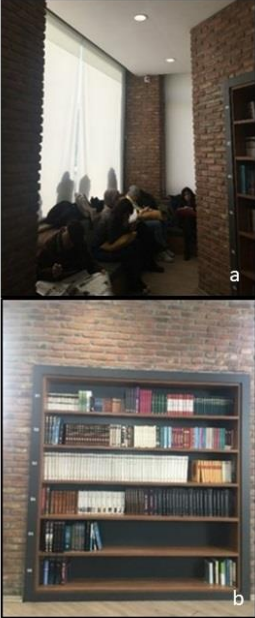
Şekil 17. Selçuklu Millet Kiraathanesi girişinin solunda yer alan oturma ve kitaplık bölümünden görünüm

Kıraathane girişinin solunda sedirli oturma bölümünün hemen yanında bulunan alan yönetim odası olarak kullanılmaktadır. Yönetim odası içeri ile bağlantıyı koparmamak ve sekizgen alanın bütünlüğünü bozmamak adına duvar yerine cam ile bölünerek oluşturulmuştur (Şekil 18).