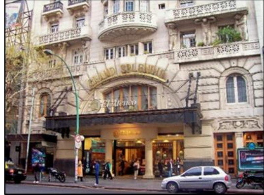
Şekil 4. El Ateneo Grand Splendid'in dış cephe görseli (URL-9)

Arjantin'in başkenti Buenos Aires'te 1919 Mayıs ayında opera binası olarak El Ateneo Grand Splendid 1.050 kişilik kapasiteye sahiptir. Yaklaşık 2.000 metrekarelik bir alana inşa edilen mekân 2000 yılının başlarında mimari yapısı muhafaza edilerek bir kitap kafeye dönüştürülmüştür. Mimar Pero ve Torres Armengol yapımı olan binanın sütunları Troiano Troiani tarafından hazırlanmış ve tavan freskleri Nazareno Orlandi tarafından yapılmıştır. Yılda 1 milyonun üzerinde ziyaretçiyi ağırlayan El Ateneo Grand Splendid (URL-5), 2008 yılında The Guardian tarafından dünyanın en güzel ikinci kitapçısı olarak ve 2019 yılında ise National Geographic tarafından "dünyanın en güzel kitapçısı" olarak seçilmiştir (URL-6). Kütüphanesinde yaklaşık 120.000 kitap ve tiyatronun sahne alanı olarak kullanılan bölümde kitap okuyup kahve içilebilen bir bar bulunmaktadır. Mağazanın etrafına kitap ararken dinlenebilmek için koltuklar bulunmaktadır. Yapının bodrum katı çocuk kitapları, üst katında ise sergiler ve teşhirler için kullanılmaktadır (URL-7). Salonun locaları, sahnesi, balkonları, son derece görkemli bir okuma salonu durumundadır (URL-8). Şekil 4'de El Ateneo Grand Splendid dış cephesine ait görseli ve Şekil 5'de kütüphane bölümüne ait görseli sunulmuştur.