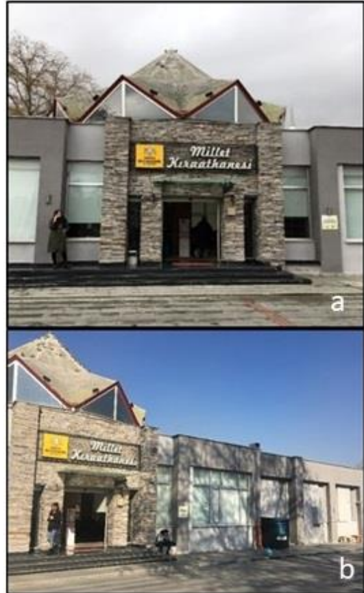
Şekil 14. Selçuklu Millet Kiraathanesi'nin dış cephe görünümü

restoran olarak kullanılan bu alan, revize edilerek 2018 yılından itibaren Millet Kiraathanesi olarak hizmet vermeye devam etmektedir. Yaklaşık 90 metrekare kapalı alana sahip olan kiraathane içerisinde bir adet çay ocağı, yönetim odası, tuvalet, sohbet etme alanı, tekli ve toplu çalışma alanları ve kütüphane bölümlerinden oluşmaktadır. İçerisinde güncel yayınların da bulunduğu 5.000 adet kitap bulunduran kiraathane pazar günleri hariç haftanın altı günü 09.00-22.00 arası hizmet vermektedir. Giriş bölümüne mevsim şartlarına uygun dekoratif taş kaplama uygulanan kiraathaneye giriş sensörlü kapı ile sağlanmaktadır (Şekil 14).