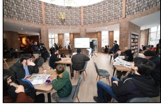
Şekil 23. Selçuklu Millet Kiraathanesi girişinden genel görünüm (URL-21)

Kiraathanede dört kenarı sedirle çevrelenen sekizgen alan uygulamalı sanat eğitimleri, söyleşiler ve seminerler için de kullanılmaktadır (Şekil 23; Şekil 24).