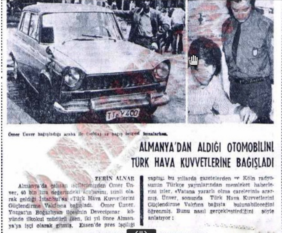
Ek-3: Almanya'da Yaşayan Bir Türk İşçinin Milliyet Gazetesinde Yer Alan Bağış Haberi 28 Temmuz 1972