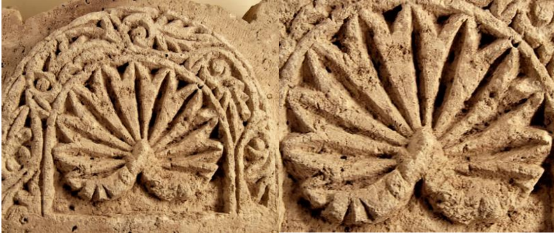
Görsel 2. Taş İşlemeciliğinde Kullanılan Lotus Motifi Örneği

Lotus: Türkler, Orta Asya'da herhangi bir yere bağlı kalmadan doğa ile iç içe bir yaşam sürmüşlerdir. Bu nedenle inançları doğrultusunda lotus çiçeği ile özel bir bağları oluşmuştur. Bilgelik, zariflik ve güzellik anlamı taşıyan bu çiçek, ayrıca ölüm ve yaşamın sembolü olarak kabul edilmektedir. Türklerin pek çok sanat eserinde kullanmış oldukları bu motifi, Anadolu'ya yerleştiklerinde de birçok mimari yapılar üzerinde taş işleme sanatı olarak eserlerinde kullanmışlardır (Özçalık, 2017, 25) (Görsel 2).