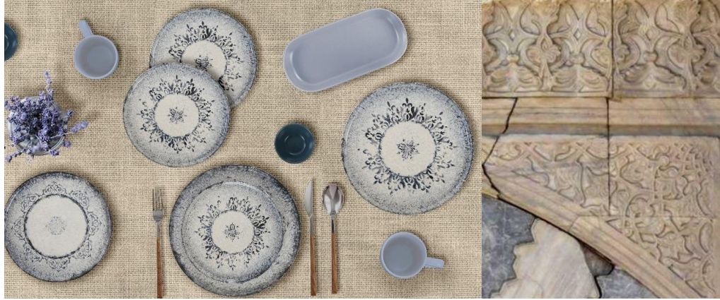
Görsel 10. Rumi ve Mai Serisi

olduğu gibi tabağın kenar kısımlarına uygulanmış olup, eskitme file etkisi ile de yapıdaki dokuların görünümü stilize edilerek özgün bir etki bırakılmaya çalışılmıştır (Görsel 11). “Yıldız Serisi” olarak hazırlanan bu dekor tasarımında kahverengi ve yeşil tonlarından oluşan karma renk anlayışı ile eskitme efektlerine yer verilmiştir. Ayrıca on iki kenarlı yıldız motifinin kullanıldığı bu tasarımda, on iki adet yıldız kullanılarak, sofraya seramiği dekor tasarımında motif tekrarı ile ulama yapılmıştır. Yıldız motiflerinin kenar kısımlarında bitkisel motifler kullanılarak tasarım tamamlanmak istenmiştir (Görsel 11.1). Farklı renklerin de kullanıldığı bu seride, alternatif kombinasyonlar yapılarak tüketicinin tercihlerini etkileyebileceği düşünülen motiflerin yanı sıra, renk çeşitliliği de oluşturulmak istenmiştir.