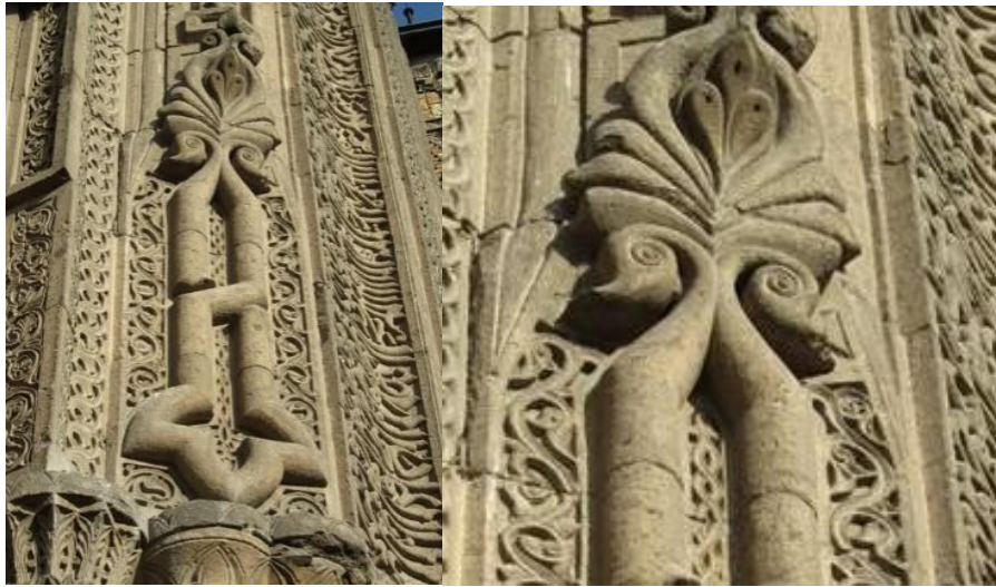
Görsel 4. Taç Kapıların Nişlerindeki Kıvrık Dal Motifli Bordürler, Kaynak:

Kıvrık Dal: Kıvrık dal motifi Anadolu Selçuklu mimarisinde yer alan taç kapıların ön yüzlerinde bulunan bordürlerin düzenlenmesinde kullanılmaktadır. İnce sarmaşık biçiminde tasarlanan kıvrık dallar, taç kapının yan kanatlarındaki nişleri çevreleyecek biçimde kullanılır. Anadolu Selçuklu taş işlemeciliğindeki bitkisel motifler, doğada görebildiğimiz bitkilerden yola çıkılarak yapıldığı gibi, doğada göremediğimiz fakat bitkileri andıran motiflerde yine bu sanat dalında karşımıza çıkmaktadır (Algan, 2008: 83) (Görsel 4). Kıvrık dal motifi çeşitli stilize edilen çiçek ve yaprak bezeleri ile birlikte kullanılmaktadır. Kıvrık dal motifi çiçek ve yaprak bezemeleri ile bir araya geldiğinde ölümsüzlüğü simgelemektedir (Algan, 2008: 169).