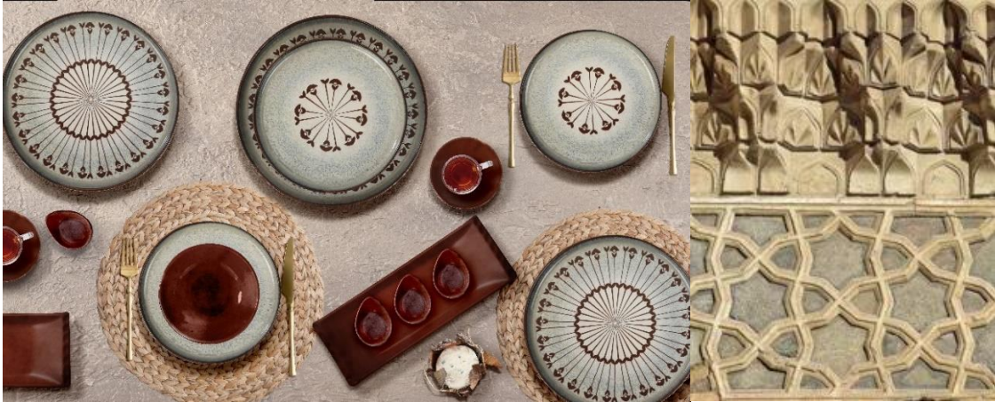
Görsel 8. Selçuklu Bulganç Serisi