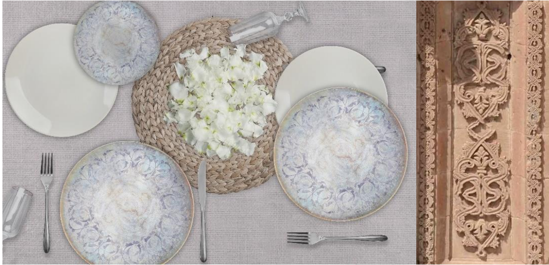
Görsel 14. Madalyon Serisi