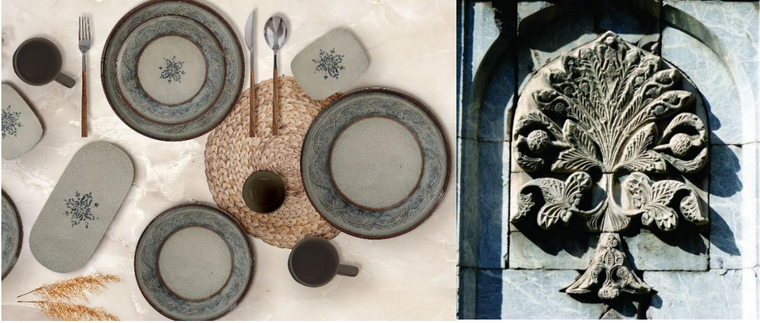
Görsel 9. Hayat Ağacı Kam Serisi

sürece dünyanın varlığına şahit olan özel nitelikli kişiler olarak kabul edilirler. Hayat ağaçları da görebilen ve yeşil kaldığı sürece dünyanın varlığına şahit olan sembolik motifler olarak kabul edilirler. Tasarlanan bu seride hayat ağacı motifi stilize edilmiş ve sofraya seramiği yüzey tasarımları olarak betimlenmiştir. Bu kapsamda merkezde dört adet kullanılan hayat ağacı motifi ile dört köşeli bir motif ortaya çıkartılmıştır. Anadolu Selçuklu mimarisinin en önemli yapılarından biri olan taç kapılarının kenar nişlerinde kullanılan hayat ağacı motiflerinin yerleşim şekli (Görsel 9.1), sofraya seramiğine uygun olarak yüzey dekor tasarımının bordürleri oluşturulmuştur. Seramik tabakların kenar kısımlarında motif olarak tasarlanan bordürler, hayat ağacının yaprakları stilize edilerek elde edilmiştir. Taç kapı kabartma kemerlerinden esinlenilerek bordürlerin iç ve dış kısımlarındaki kahverengi fileler oluşturulmuş ve dekor tasarımı tamamlanmıştır.