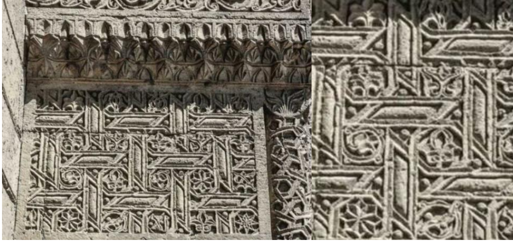
Görsel 6. Düzenli Geometrik Motifli Desenler

Geometrik Süslemeler: Geometrik biçimlerin düzenli bir biçimde bir araya gelmesi sonucunda, geometrik motifler oluşmaktadır. Geometrik motiflerin sistemli bir düzende oluşmasıyla birlikte farklı ağlar ortaya çıkmaktadır. Metal, ahşap, seramik ve tekstil olmak üzere pek çok alanda kullanılmakta olan geometrik motifler, sembolik anlam bakımından da oldukça zengin ve manevi anlamları yüksek şekillerdir. İslam sanatında da yoğun olarak kullanılan bu dekorasyon unsuru, ister arabesk ve geometrik desenler olsun, iste karmaşık düzende olsun pratik ve düşünceli bir biçimde tasarlanmıştır (Shojanoori, 2016: 467) (Görsel 6).