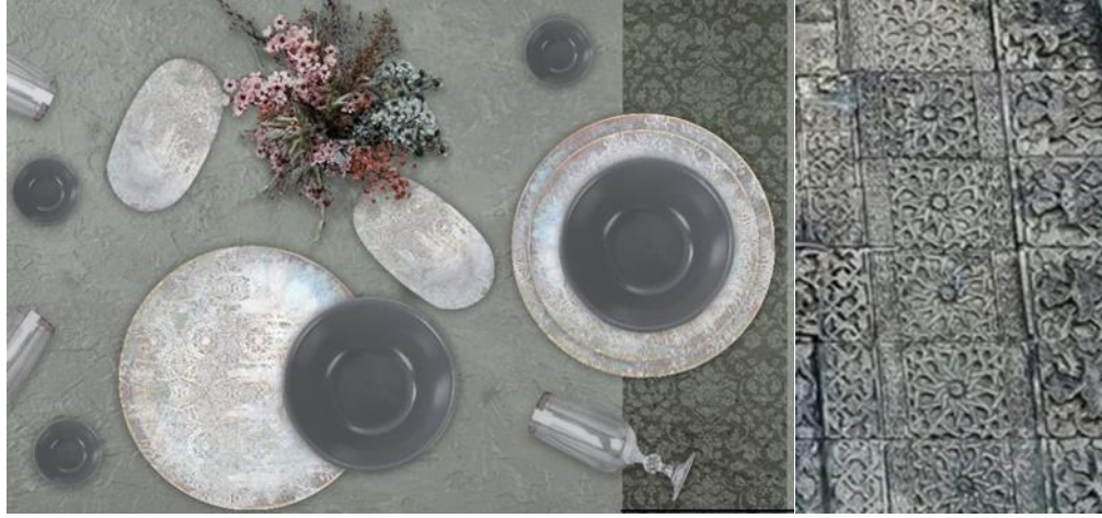
Görsel 13. Stüko Geçme Serisi

tonlarının kullanıldığı bu dekor tasarımında yine aynı renklerle file uygulaması yapılarak kompozisyon bütünlüğü sağlanmaya çalışılmıştır (Görsel 13.1).