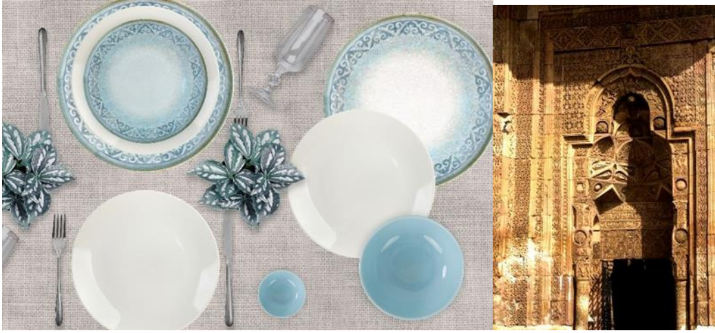
Görsel 12. Bitkisel Karma Serisi

olan bitkisel motifler, farklı biçimlerde hazırlanarak yüzey süslemelerinde yerlerini almıştır. Bu uygulama örneğinde hem tek başına sadece bir yaprak ya da dalla beraber kullanılmış, hem de geometrik biçimlerle birleştirilerek farklı kompozisyonlar yaratılmıştır (Görsel 12). “Bitkisel Karma Serisi” olarak hazırlanan sofraseraamiği yüzey tasarımında geometrik bir biçimde stilize edilen bitki motiflerine yer verilmiştir. Bu tasarımda yaprak motifi kıvrık dal motifiyle birleştirilerek üçgen biçimi oluşturulmuştur. Üçgen yaprak kompozisyonu, tabak etrafında çevrilierek bir şerit oluşturacak şekilde sınırlandırılmıştır. Turkuaz ve beyaz rengin uyumuyla birlikte yüzey tasarımında belirli alanlarda boşluklar bırakılarak gözü yormayacak bir düzen oluşturulmaya çalışılmıştır. Kombindeki tabakların bazılarının iç kısımlarında bazılarının ise kenar kısımlarında turkuaz renkli doku ve motif kullanılarak, yüzeyde hareket etkisi oluşturulmaya çalışılmıştır. Ayrıca tasarlanan bu serideki tabakların kenarlarına turkuaz ve kahverengi file getirilerek, kompozisyon sınırlandırılmıştır.