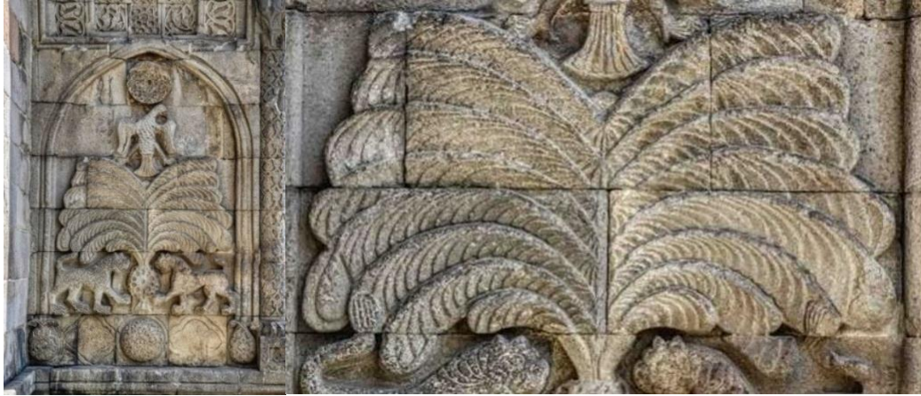
Görsel 5. Hayat Ağacı Motifi

Karma Süsleme: Karma süsleme, geometrik ve bitkisel motiflerin üst üste getirilmesi sonucunda ortaya çıkan süsleme ögesidir. Bu birleşmeyle ortaya çıkan süsleme sisteminde motifler kendi özelliklerini yitirmemektedir. Karma süsleme sisteminde iç içe geçme uygulamasının yanı sıra hatlar keskin ve belirgin biçimde bırakılmaktadır. Bir diğer karma süsleme uygulaması ise, geometrik ve bitkisel motiflerin aynı yüzey üzerinde yan yana getirilmesi ile oluşturulmaktadır. Bu uygulama esnasında iki şerit arasında bir friz veya ince bir bant kullanılmaktadır (Algan, 2008: 95). Anadolu Selçukluları döneminde pek çok taç kapıda bitkisel motiflerle geometrik motifler karıştırılarak karmaşık geçişli kompozisyonlar hazırlanmıştır. Geometrik süslemelerin yapıldığı şeritlerin zeminlerine bitkisel motiflerle süslemeler yapılmıştır.