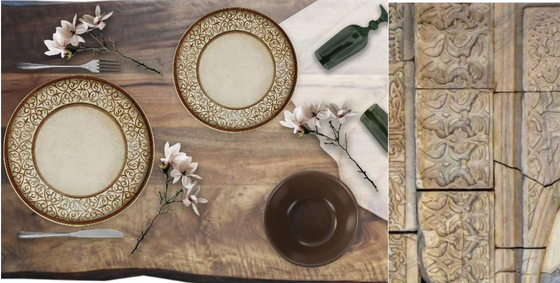
Görsel 15. Taş ve Toprak Serisi

Uygulama Örneği 8: Araştırmanın sekizinci uygulama örneği, “Taş ve Toprak Serisi” olmuştur. Bordürler Anadolu Selçuklu dönemi taç kapılarının en karakteristik özelliklerinden biridir. Çeşitli motiflerin bir araya gelmesi ile oluşturulan bu uygulamalarda bitkisel şekiller bir araya getirilerek çeşitli kompozisyonlar ortaya çıkarılmıştır. Bu tasarımda kıvrık dal, rumi ve hatayi gibi çeşitli figürler bir araya getirilerek bordürler oluşturulmuştur (Görsel 15). “Taş ve Toprak Serisi” olarak adlandırılan sofrta seramiği, yüzey dekor tasarımı ismini taç kapıların zaman içerisinde karşılaşmış olduğu doğal deformasyonlar sonucunda oluşturdukları görüntüden almaktadır. Zaman içerisinde renginde yaşanan değişiklikler bu tasarım çalışmasında yüzey renklerine yansıtılmış, kahverengi ve sarı tonlar tasarımın baskın renkleri olmuştur. Bitkisel bordürlerde yer alan motiflerin birlikte kullanılması ile de tabak etrafında bir şerit görüntüsü oluşturulmaya çalışılmıştır. Bu tasarımda motifler, tek renk olacak biçimde sadece kahverengi ile oluşturulmuştur. Zemin renginde kullanılan sarı renk ise değişim sonucunda taşın almış olduğu renkten esinlenilerek elde edilmiştir. Kıvrık dal, rumi ve hatayi motiflerinin stilize edilerek kullanıldığı bu tasarımda karma bir motif çalışması yapılmıştır. Motiflerin oluşturduğu kompozisyonun iç ve dış kısımları yine motiflerde kullanılan renk ile sınırlandırılmıştır.