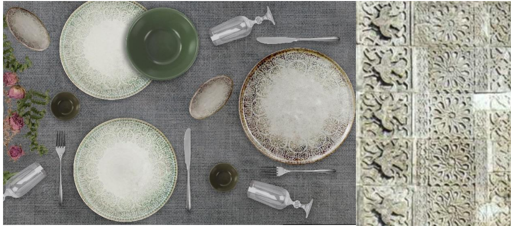
Görsel 11. Yıldız Serisi