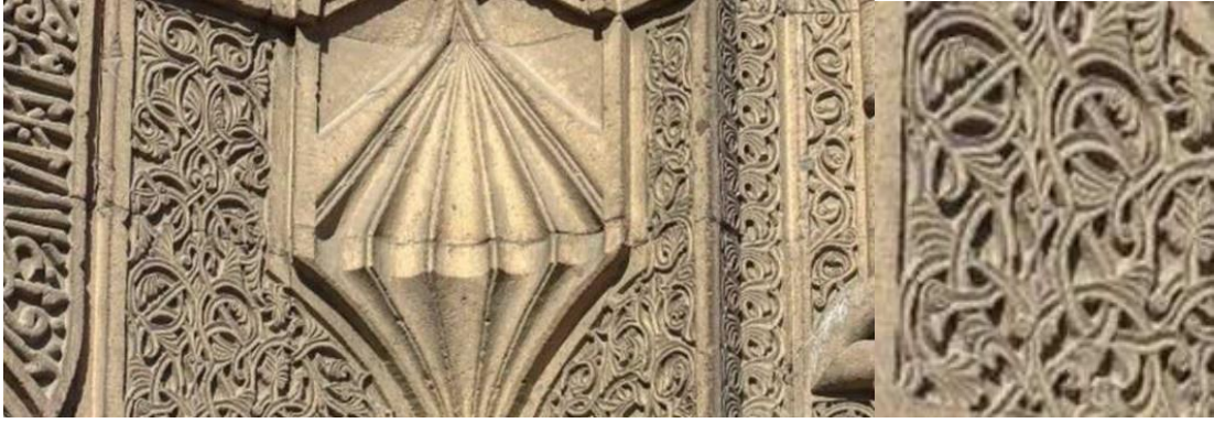
Görsel 3. Taş İşlemeciliğinde Kullanılan Rumi Motifi Örneği

Akantis (Acanthus): Akantis (acanthus), ilk çağlardan bu yana kullanılmakta olan, mimari eserlerde de yoğun bir şekilde bulunan bir bitkisel motif örneğidir. Az ya da çok oranda stilize edilmiş akantis yaprakları sütun başlıklarının ayrılmaz bir parçası olmuştur. Akdeniz çevresinde yer alan uygarlıkların taş işlemeciliği sanatında yaprak, kıvrım ya da rozet formunda sayısız eserde karşımıza çıkmaktadır. Akantis motifi, yabani bir bitkinin ve bahçelerde bulunan kültür bitkilerinin, bölge ve dönem üsluplarına göre değişkenlik göstererek stilize edilmiştir (Demiriz, 1984: 19).